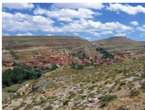
Figura 7: vista desde la pedriza