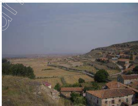
Figura 5: paisaje de los campos de cultivo de Jorcas