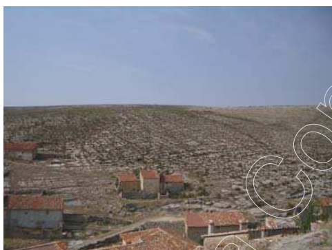
Figura 4: paisaje de Jorcas

En este lugar no es muy representativo el paisaje que ofrecen los bosques de coníferas, ya que, únicamente un 4% de la superficie total del territorio, es zona de monte.