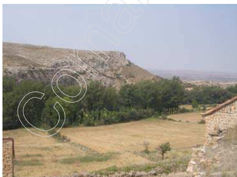
Figura 6: paisaje de campo de cereal, de vegetación de ribera, y de zona montañosa.