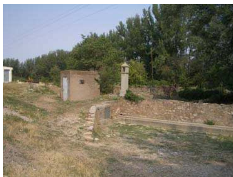
Figura 3: Fuente de El Salvador