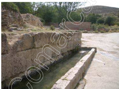
Figura 2: Fuente del pueblo

El municipio cuenta también, con un gran número de fuentes, entre las que destacan “La Fuente Alta o del Gamellón”. “La Fuente Baja o de Abajo”, y “La Fuente Salvador”. Estas fuentes, al igual que otras que se encuentran en el municipio, cuentan con un escaso caudal, que es debido, en gran parte, a la escasez de precipitaciones que se da actualmente. Junto a las fuentes, es frecuente encontrar abrevaderos, que son de uso agrario.