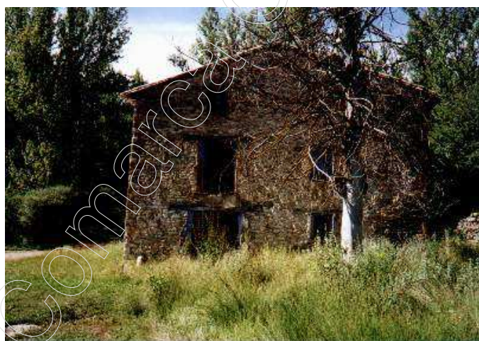
Figura 9: molino

Se localiza a unos 2 km del núcleo urbano, en la margen derecha del río Alfambra. Actualmente está abandonado, y presenta parte de sus muros caídos. Tiene dos muelas o piedras de moler, una de ellas era utilizada para moler trigo, y otra para moler la cebada y piensos para el ganado.