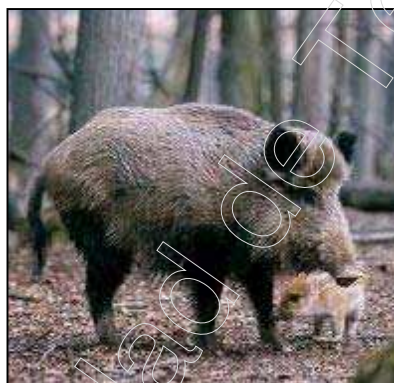
Figura 6: ejemplar de jabalí