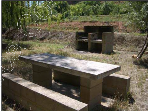
Figura 10: merendero de Tramacastiel

En el barrio de Mas de la Cabrera existe otro merendero, también ubicado en la ribera, y equipado con mesas, fogones, fuentes y columpios; la vegetación que rodea este entorno está formada principalmente por chopos.