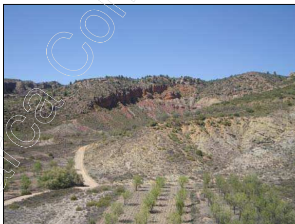
Figura 8: paisaje de Tramacastiel

La vegetación que predomina en el paisaje es la típica de suelos poco profundos y climas continentales secos, donde las precipitaciones son escasas, y no dejan que se desarrollen extensas masas vegetales.