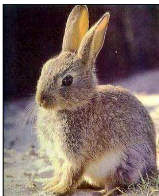
Figura 5: ejemplar de conejo

Entre los mamíferos destaca la presencia de especies cinegéticas, como son el jabalí ( Sus scrofa ), conejo común ( Oryctolagus cuniculus ), y liebre común ( Lepus capensis ). Debido a la presencia de estas especies, junto con otras también cinegéticas, en el término existe un coto de caza.