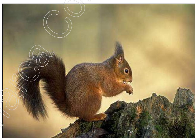
Figura 7: ejemplar de ardilla