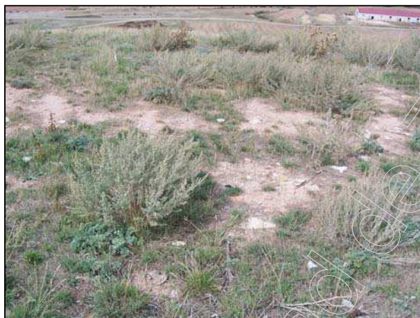
Figura 19: vegetación antrópica