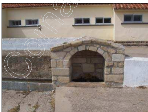
Figura 15: Fuente del Barrio Alto