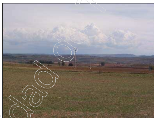
Figura 24: campo cultivo cereal