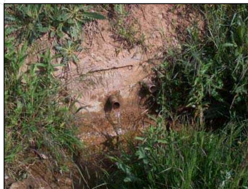
Figura 8: Fuente "El Cañico"