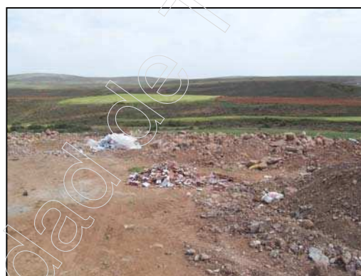
Figuras 26 y 27: escombrera