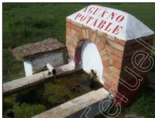
Figura 4: Fuente "El Beceril"