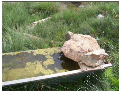
Figura 12: Fuente "Ribazo"

Además de estas fuentes, que están repartidas por el terreno de El Pobo, también existen fuentes ubicadas dentro del núcleo urbano, en concreto, seis, cuya localización es la siguiente: