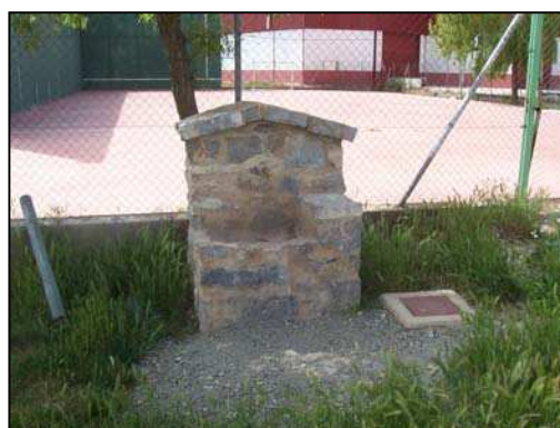
Figura 16: Fuente junto al frontón