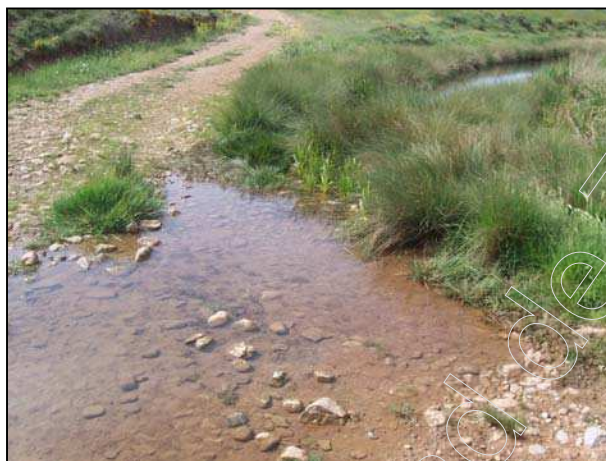
Figura 2: río Seco

Destaca la existencia de un cauce superficial de agua, que corresponde al río Seco, río de escaso caudal perteneciente a la Confederación Hidrográfica del Júcar, que nace en este término municipal, concretamente en la Sierra del Pobo, y va a dar lugar al río Alfambra, al unirse, en Aguilar del Alfambra, con el río Blanco.