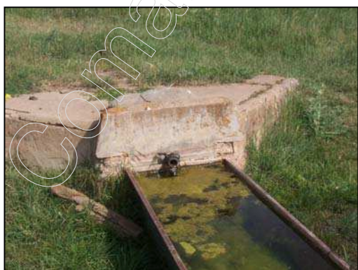
Figura 9: Fuente "Villar de La Solana"