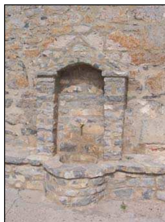
Figura 14: Fuente del Ayuntamiento