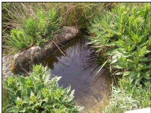
Figura 11: Fuente "Lansana"