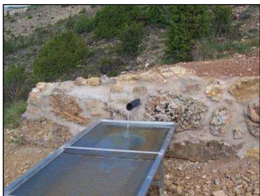
Figura 5: Fuente "La Penilla"