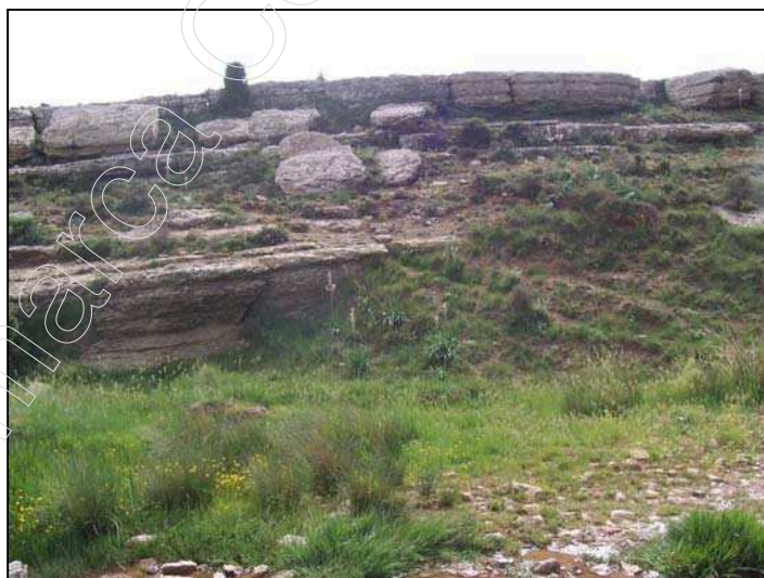
Figura 1: materiales aflorantes

La Sierra del Pobo forma parte de las Serranías de Gúdar, y está situada en el extremo occidental de éstas, quedando limitada por la fosa de Alfambra-Teruel, lo que hace que, toda la sierra actúe como divisoria del valle del Alfambra y la depresión del Pobo.