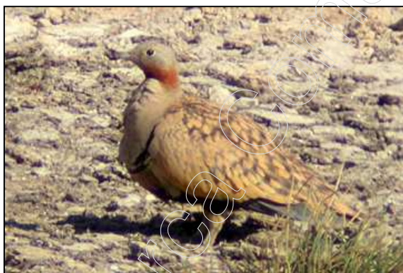
Figura 21: Ganga Ortega

Ganga Ortega ( Pterocles orientalis ) está catalogada desde el 5 de abril de 1990, según el R.D. 439/1990, como especie de especial interés, y Alondra Dupont ( Chersophilus duponti ) está catalogada como especie sensible a la alteración de su hábitat.