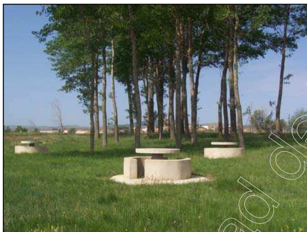
Figura 25: merendero Fuente "El Cubo"

Esta fuente tiene interés para los habitantes del Pobo debido a que es un lugar de uso recreativo para ellos, pues junto a la fuente hay un merendero que está equipado con mesas, sillas y fogones.