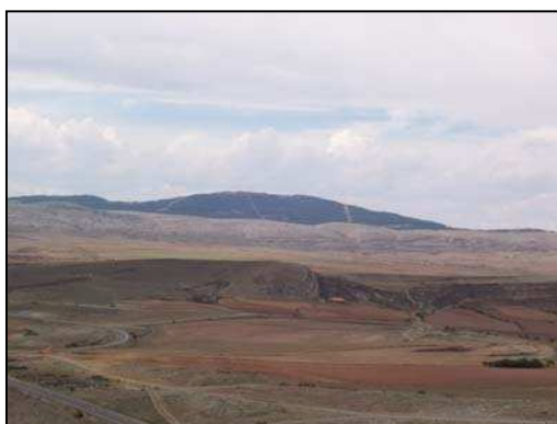
Figura 23: vista de la Sierra de El Pobo

Alrededor del núcleo urbano, las formas del relieve son llanas y suaves, y los campos de cultivo de cereal son el elemento predominante. Sin embargo, contrastando con este paisaje, existe otro, en el que el relieve es abrupto, con numerosos pliegues y fracturas, que se corresponde con la zona de la Sierra del Pobo. Aquí, el pinar de pino albar ( Pinus sylvestris ), ocupa la mayor parte del terreno, confiriendo un gran valor al entorno.