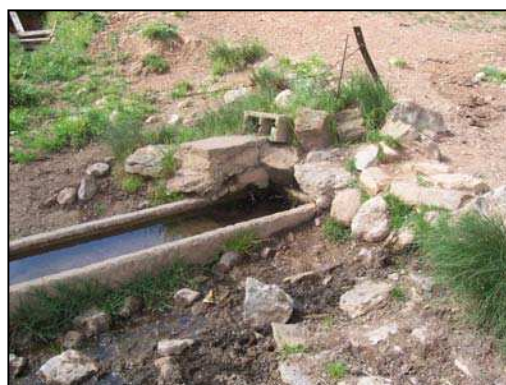
Figura 10: Fuente "Santa Ana"