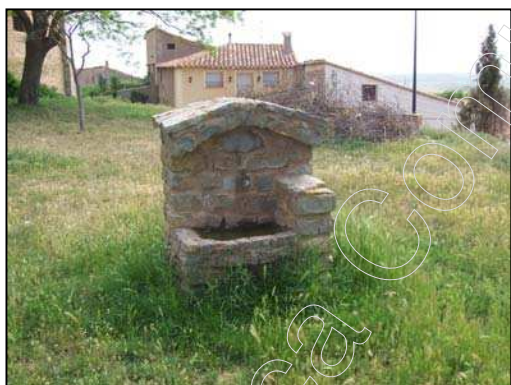
Figura 13: Fuente de La Iglesia