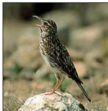
Figura 22: Alondra Dupont

Además de aves, en El Pobo viven otros animales, como mamíferos: ardilla roja ( Sciurus vulgaris ), lirón careto ( Eliomys quercinus ), ratón de campo ( Apodemus sylvaticus ), tejón ( Meles meles ), jabalí ( Sus scofra ), garduña ( Martes foina ),...; reptiles y anfibios, también existen en el municipio, pero sobre todo, el grupo animal más variado y abundante es el de los artrópodos, aunque muchas de las especies pertenecientes a este pasan desapercibidas por el pequeño tamaño que presentan.