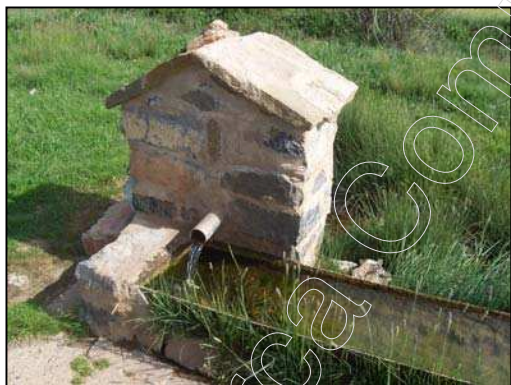
Figura 7: Fuente "El Cubo"