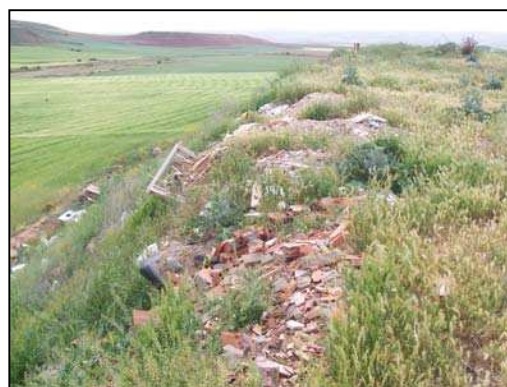
Figuras 28 y 29: antigua escombrera