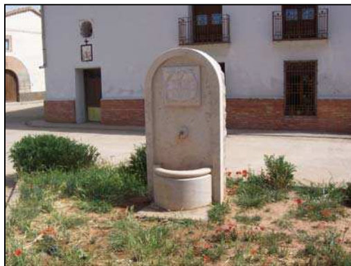
Figura 17: Fuente del consultorio

La unidad hidrogeológica a la que pertenece el municipio es la de Alfambra-Teruel, de la Confederación Hidrográfica del Júcar. Los acuíferos que se encuentran en esta unidad son los siguientes: