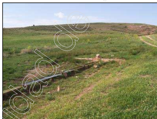
Figura 6: Fuente "El Collado"