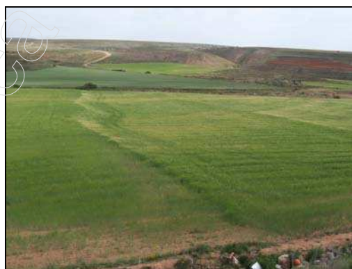
Figura 18: campos de cultivo de cereal

En los alrededores del núcleo urbano, la vegetación natural prácticamente es inexistente, debido a que se ha visto desplazada por vegetación antrópica, como son campos de cultivo, o especies nitrófilas que aparecen en los bordes de los caminos y en los cultivos abandonados. Entre los cultivos, únicamente se da el cultivo de secano, en concreto, de cereal, ocupando una extensión de unas 9.000 ha. La escasez de agua en el municipio hace que no exista cultivo de regadío en el mismo.