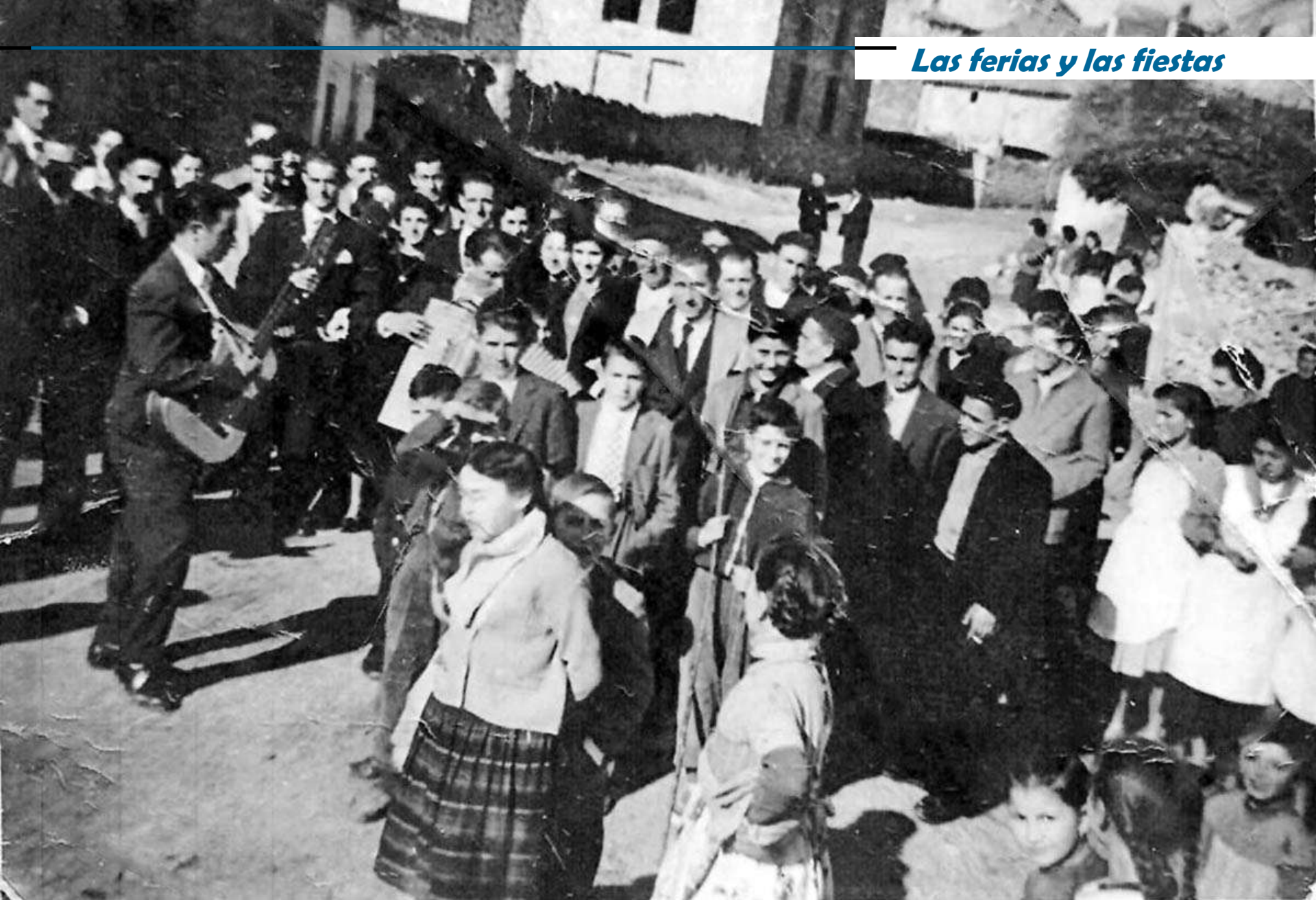
Fiesta y ronda de bodas. 1959.