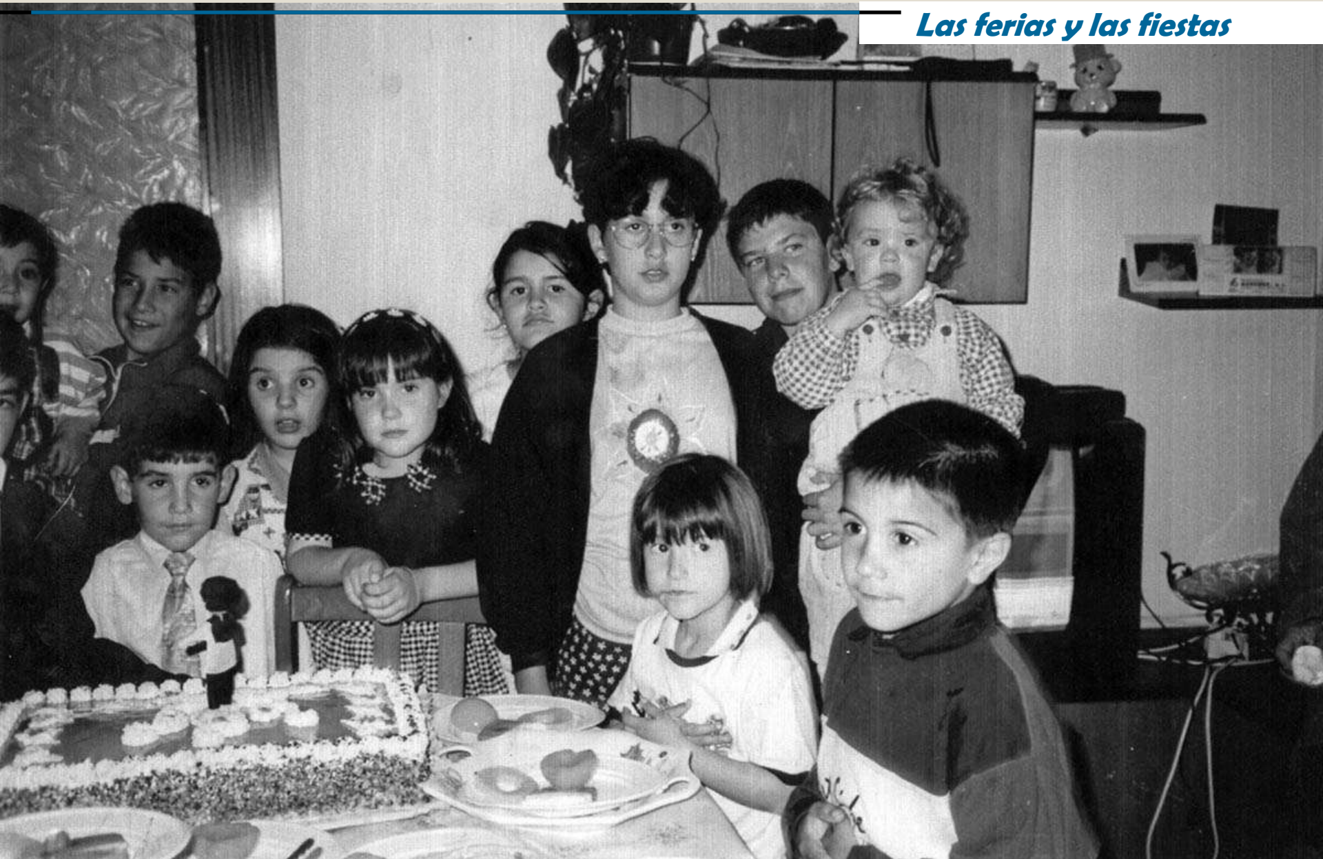
Fiesta de cumpleaños. Años 80.