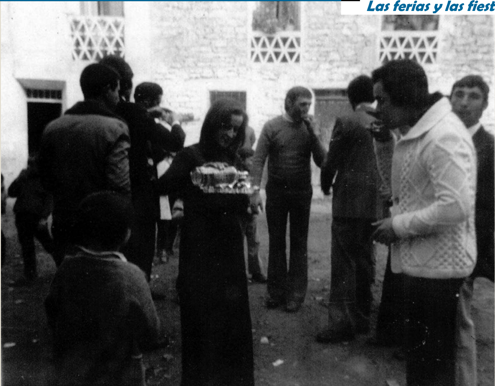
Convite. Años 70.