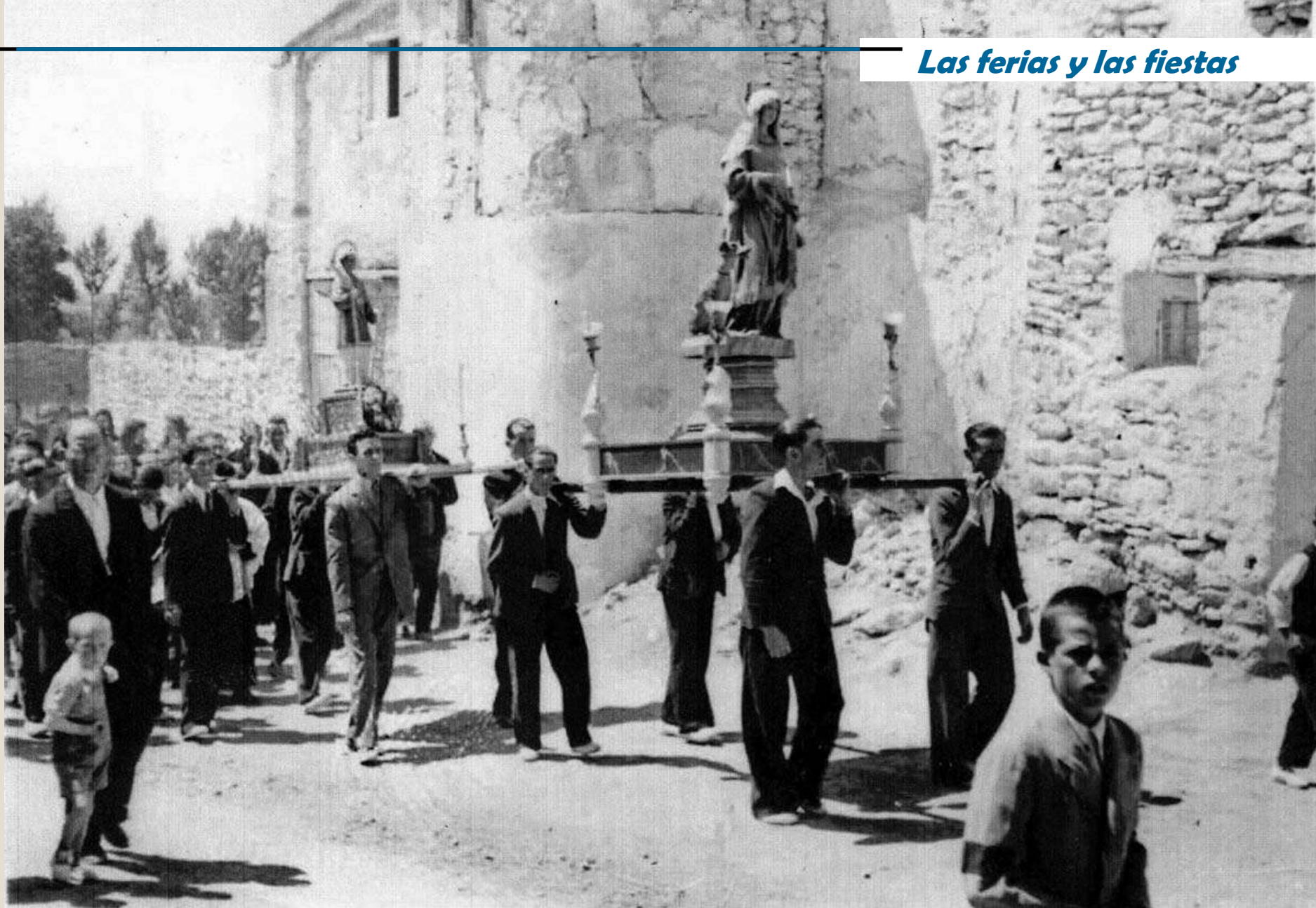
Procesión de Santa Quiteria y San Lorenzo, en las fiestas de agosto. Escorihuela, 1957-1958.