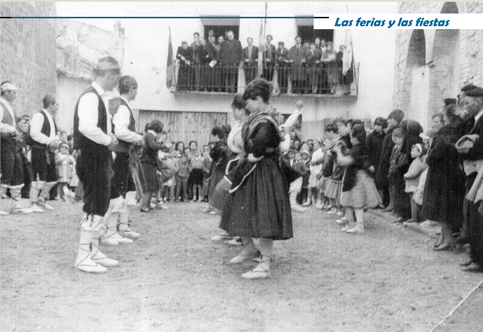
Bailando la jota delante del Ayuntamiento. Años 60.