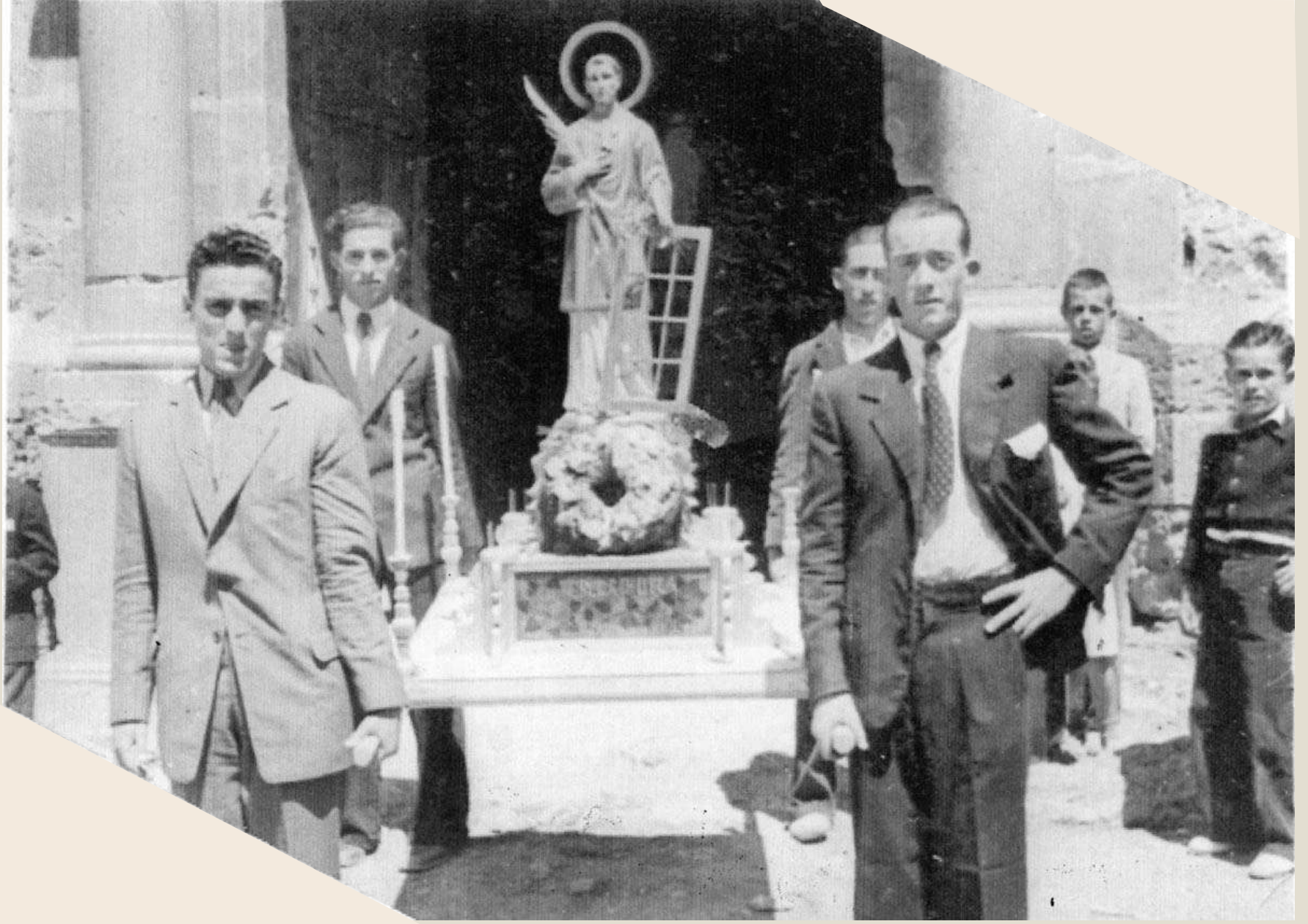
San Lorenzo con el roscón adornado en la peana a la puerta de la iglesia, el 10 de agosto 1957-1958.