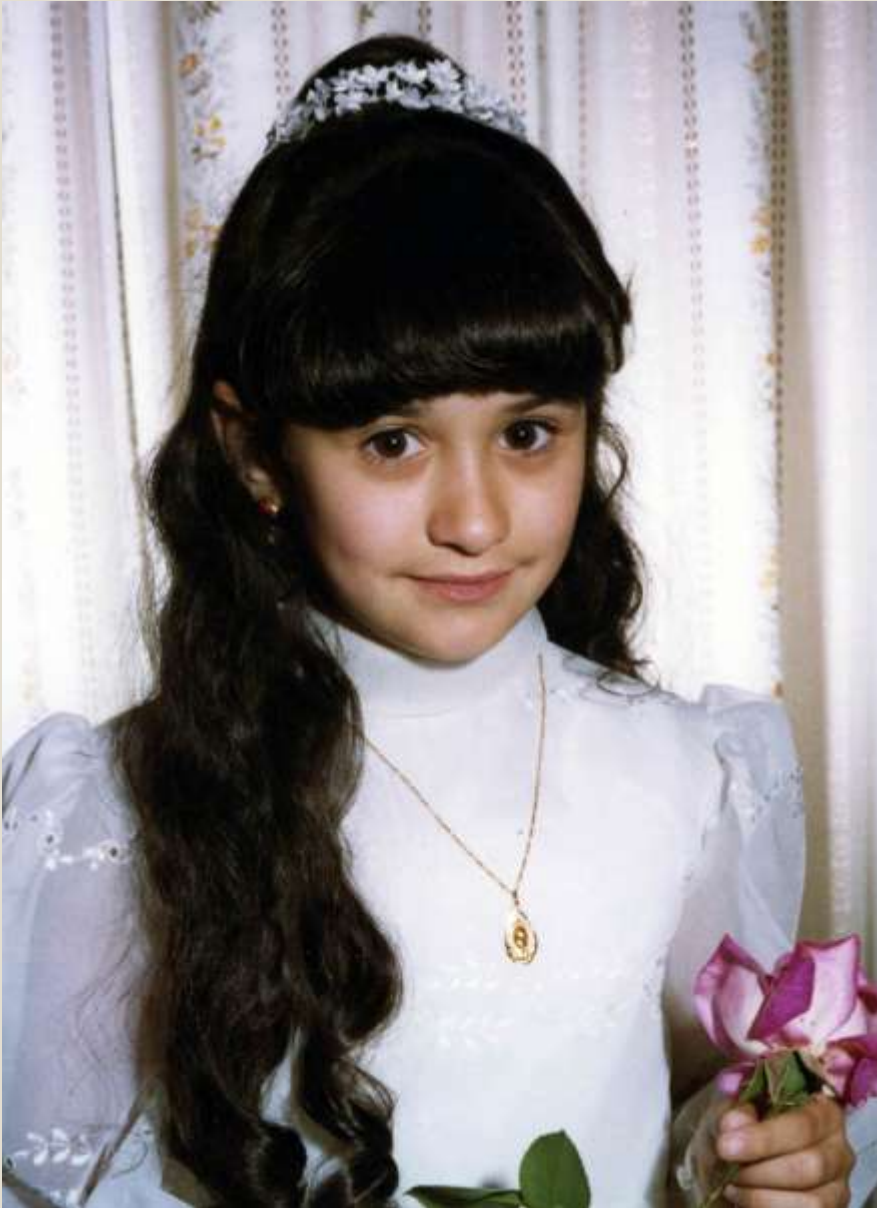
Comuni3n de la Prima Miguela en Tortosa, 1977.