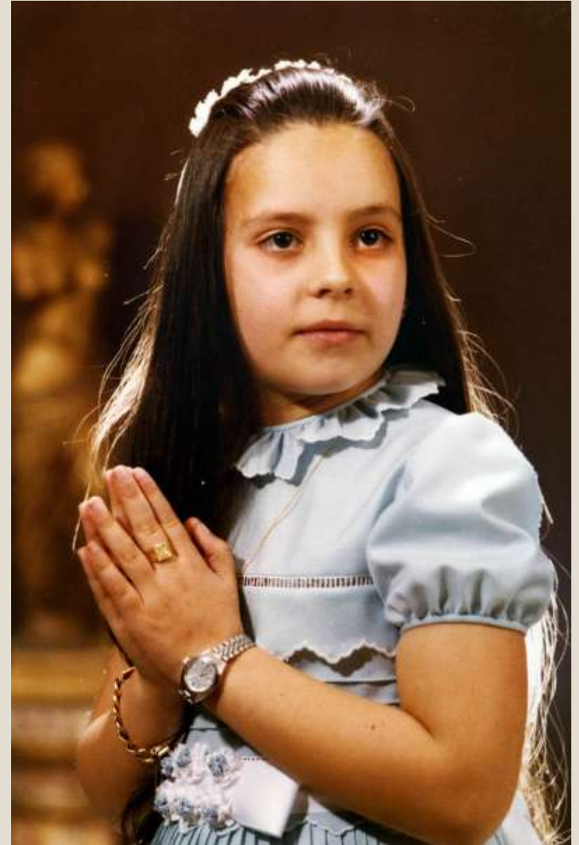
Comuni3n de M a Jos3 en Zaragoza, en 1977.