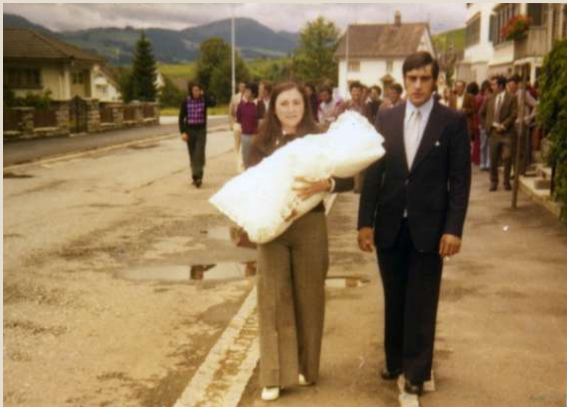
La familia se reunió en Suiza para celebrar un bautizo. Era 1974