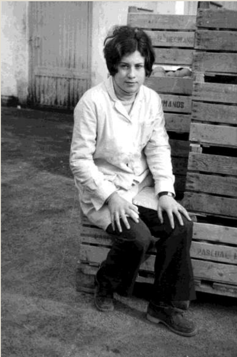
Campaña del cítrico en Almenara. 1970