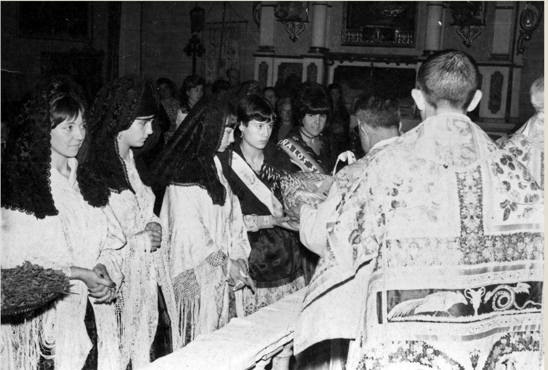
Ofrenda en la iglesia de las reinas de las fiestas 1968,