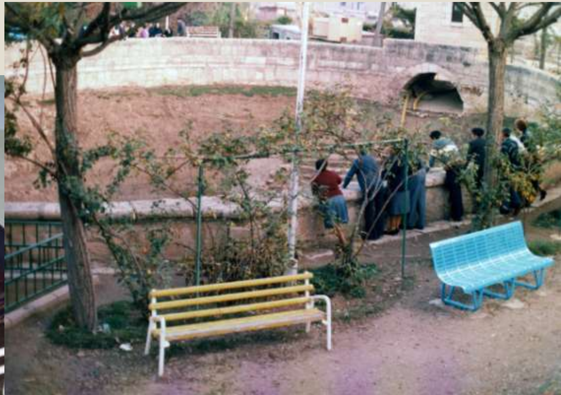
Vecinos mirando la fuente de Cella vacía durante la sequía en 1994..