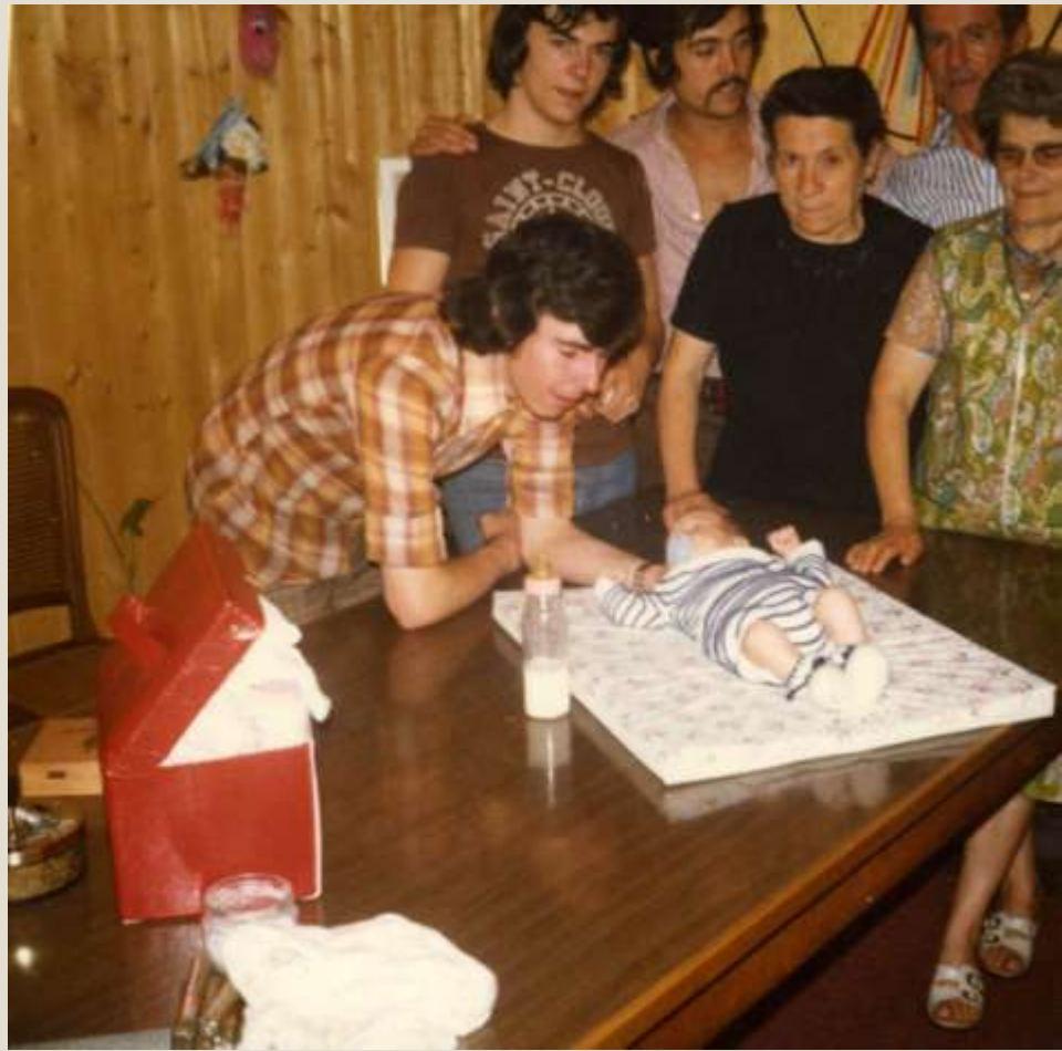
Celebración del bautizo y primer cumpleaños en Suiza. La familia de España, Francia y Suiza, se reunió en 1974.