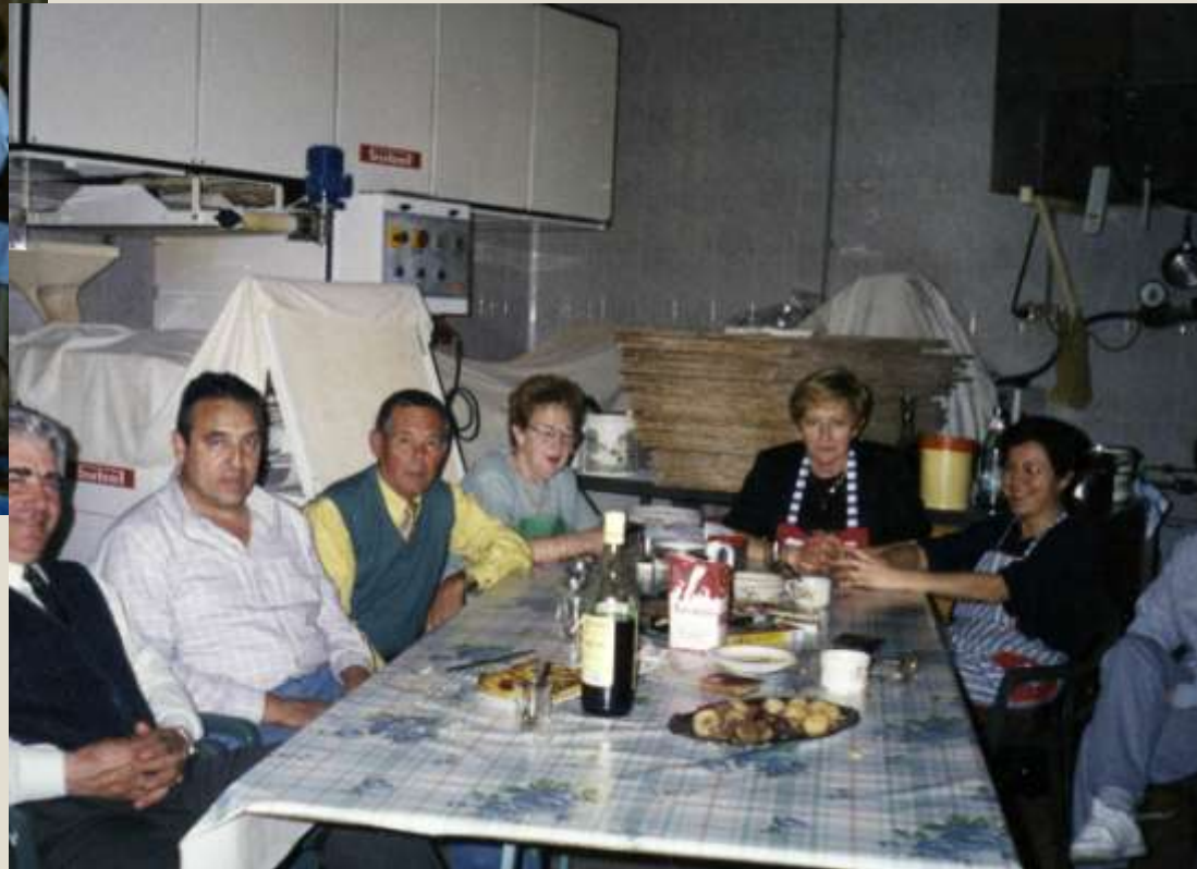
Celebrando la navidad en el horno familiar, en Cella, 1997.