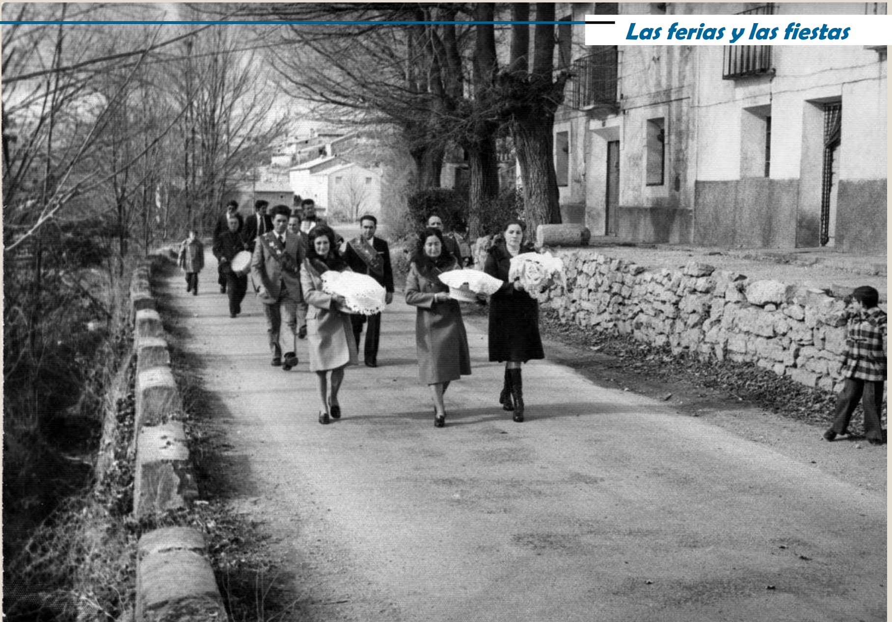
Clavarios y clavarias en las fiestas de San Blas en los años 70 por la carretera con el alcalde, el tambor y la dulzaina detrás de camino a la iglesia.