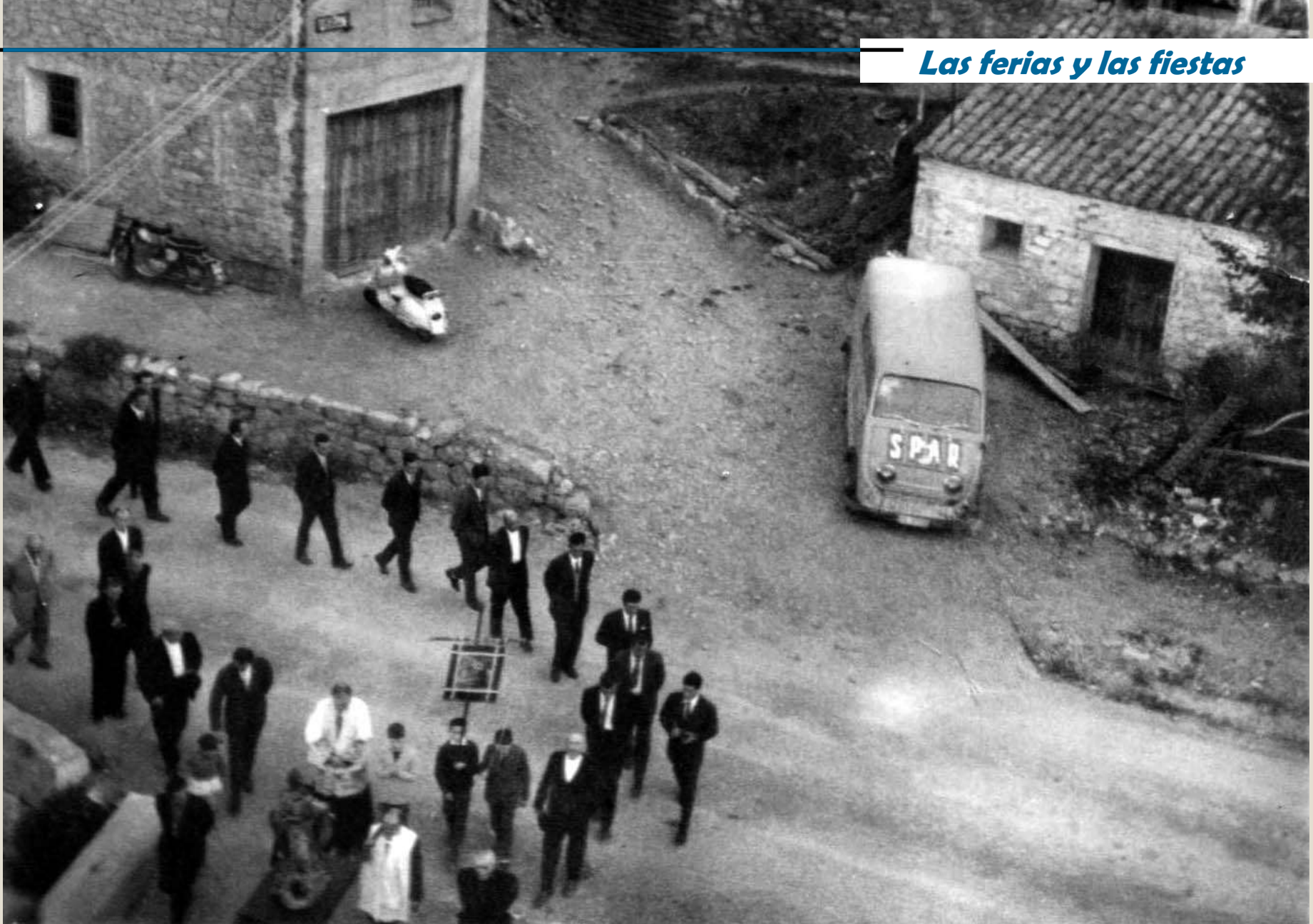
Procesión por la carretera hacia la iglesia frente a casa Emilio, cartel de teléfono, y furgoneta del SPAR. Años 60.