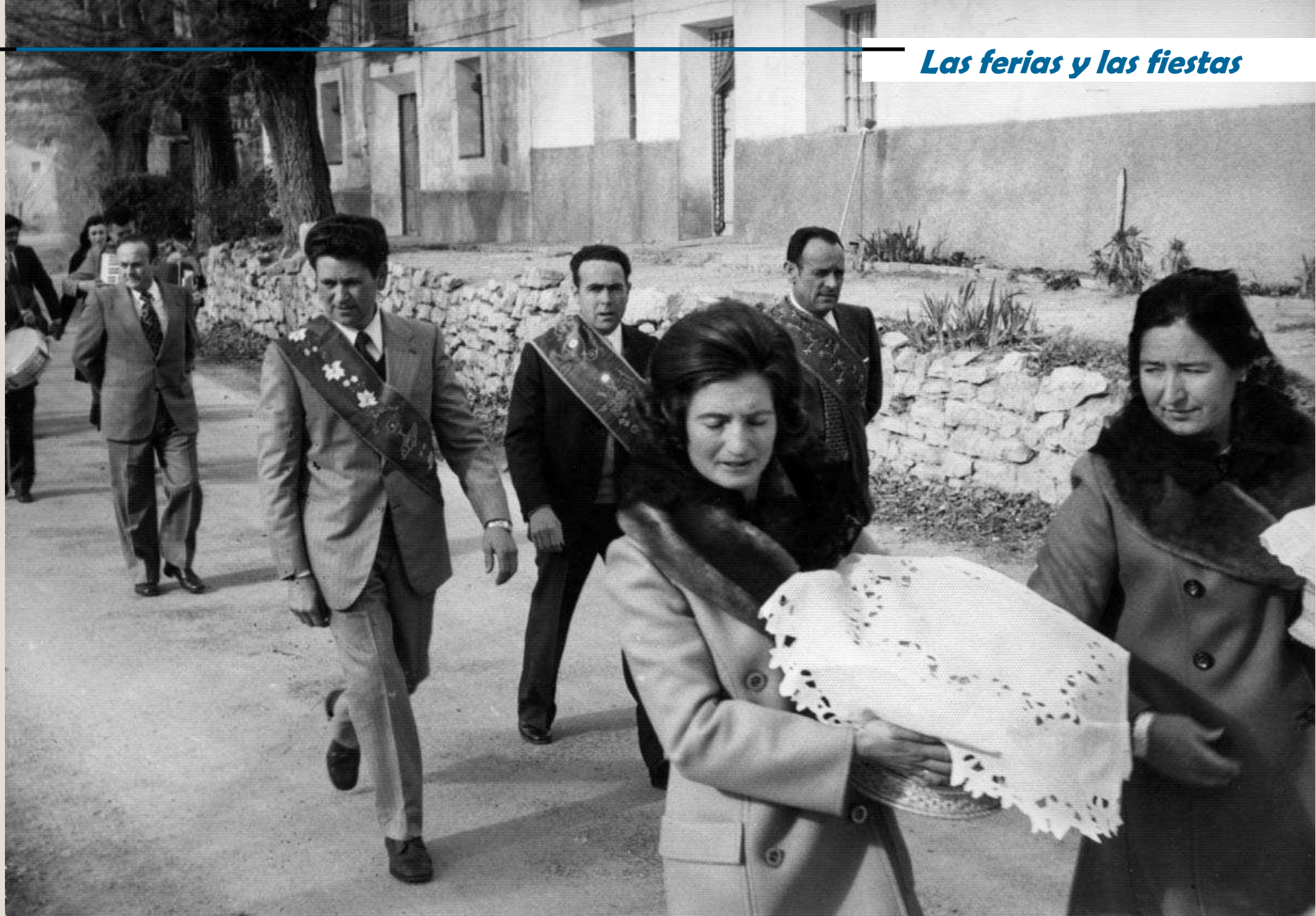
La fiestas de San Blas son el día 3 de febrero, las fiestas de invierno.