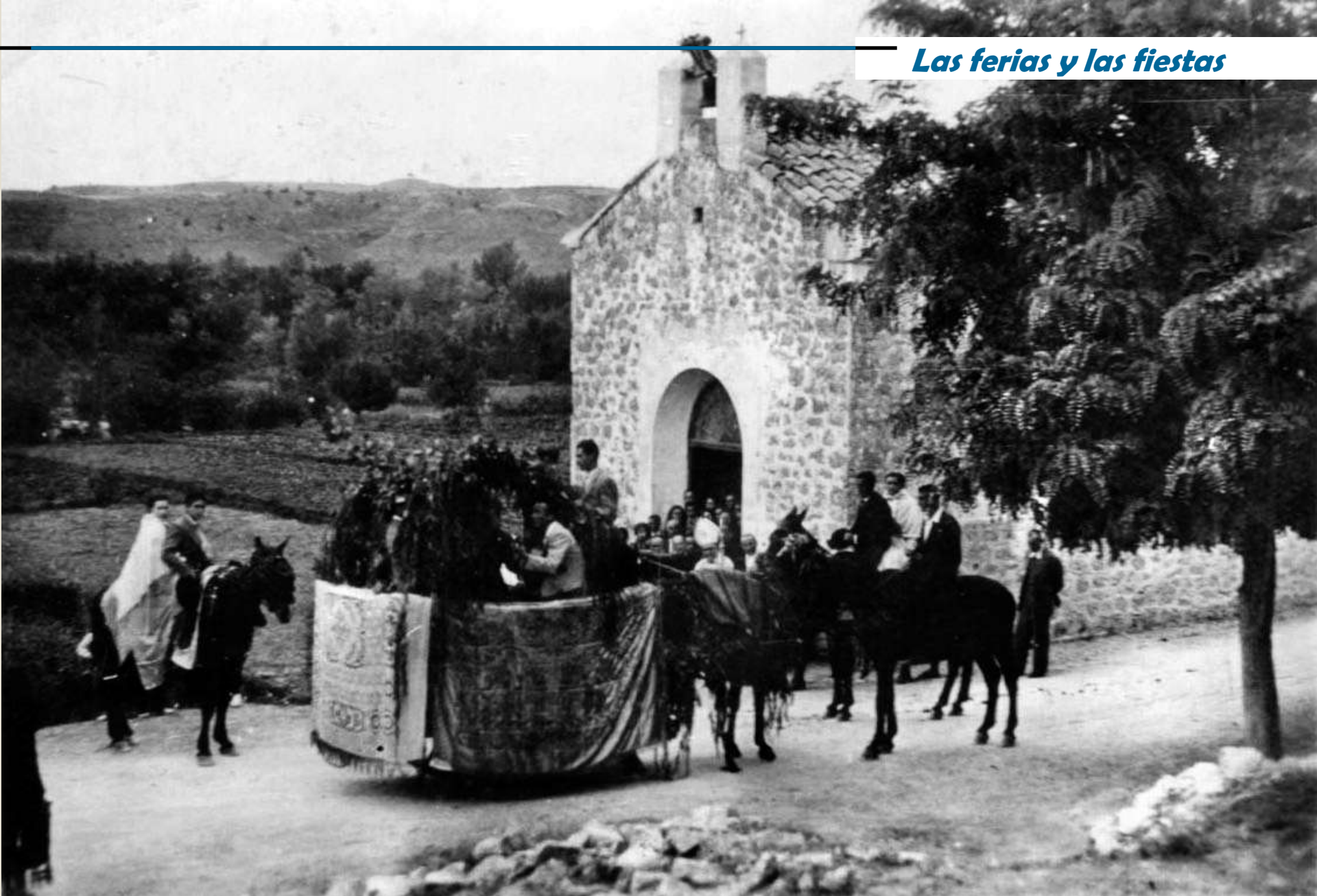
Ermita de San Blas, destruida en el ensanche de la carretera en los años 80. Fue utilizada también como escuela durante años. Años 50-60.