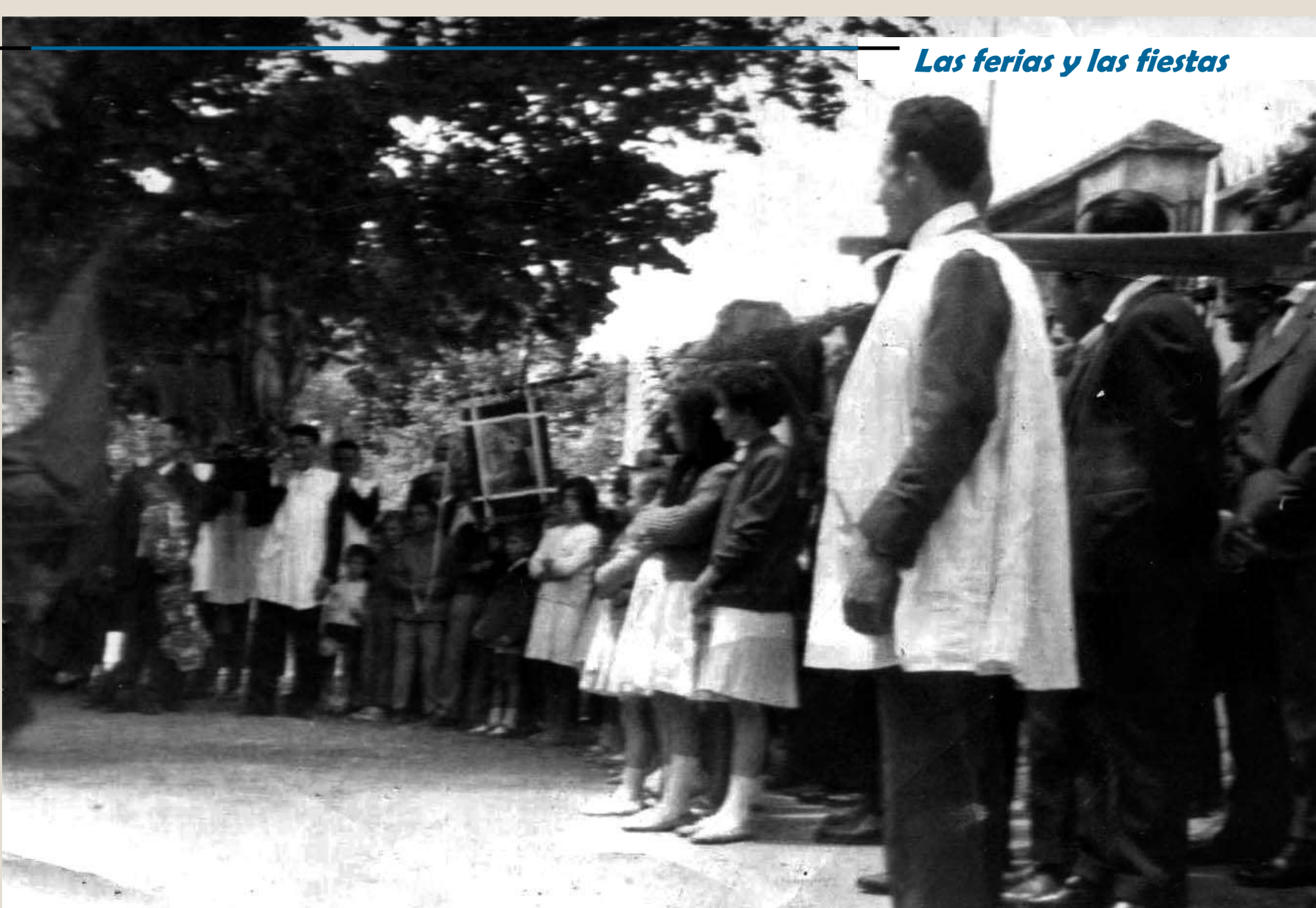
Antigua plaza del Olmo, carretera del pantano, con San Blas y estandarte de los niños. Años 60.