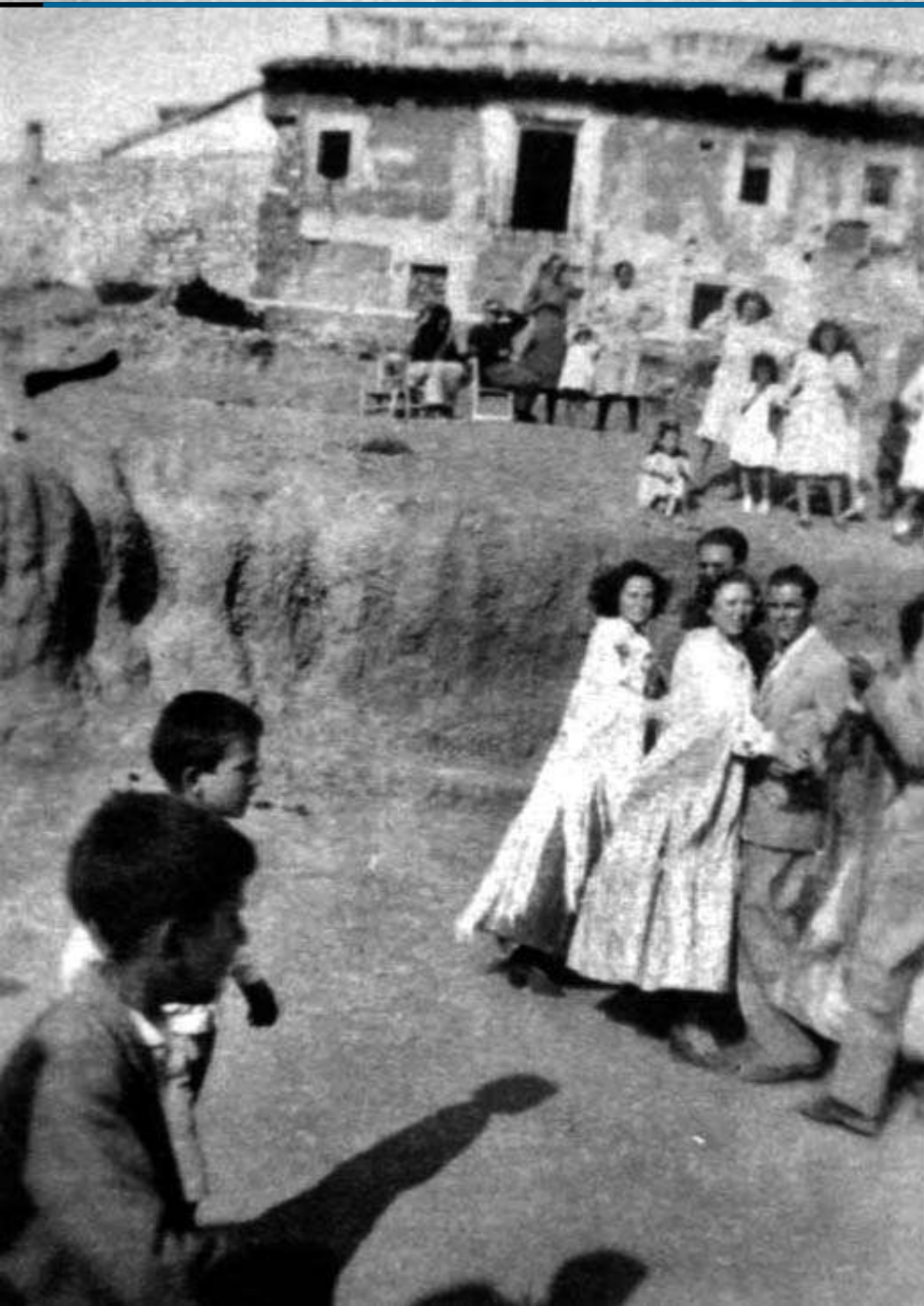
Jóvenes bailando en fiestas. Años 50.