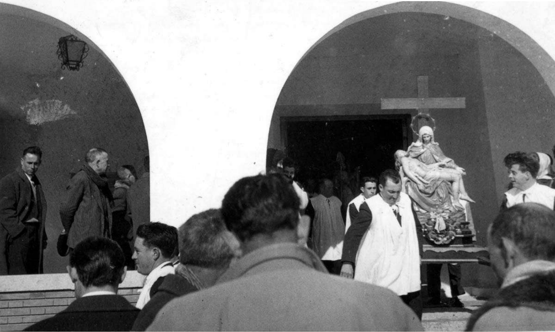
Fiesta de San Blas, sacando la Piedad. Años 60.