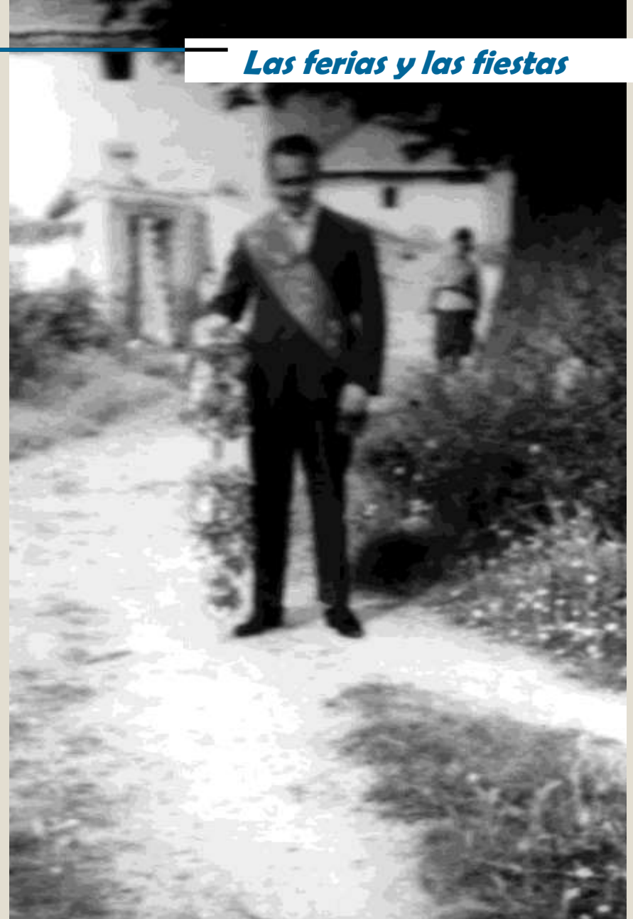
Fiestas de la Piedad. La inmaculada. Años 60.