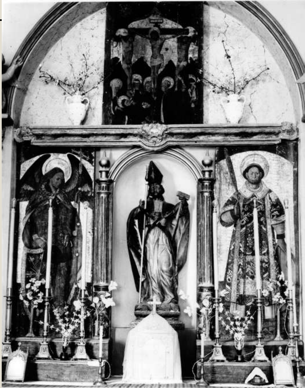
Retablo de la ermita de San Blas, ahora en el obispado de Teruel.