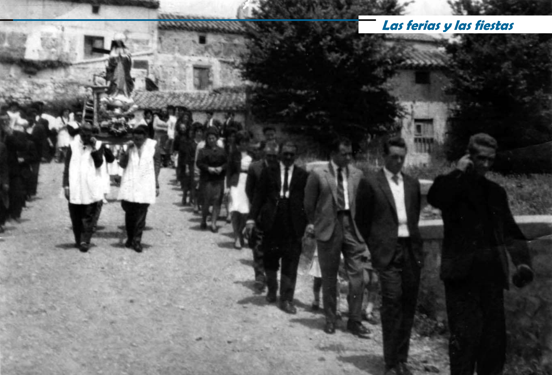
Procesión bajando de la hacia la iglesia con la inmaculada. Años 60.