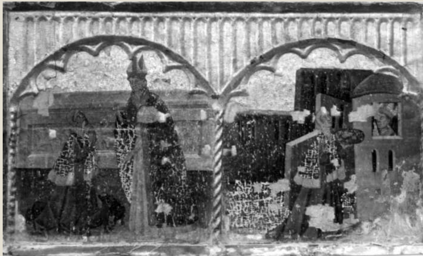
Tablas pintadas de la ermita de San Blas, ahora en el obispado de Teruel.