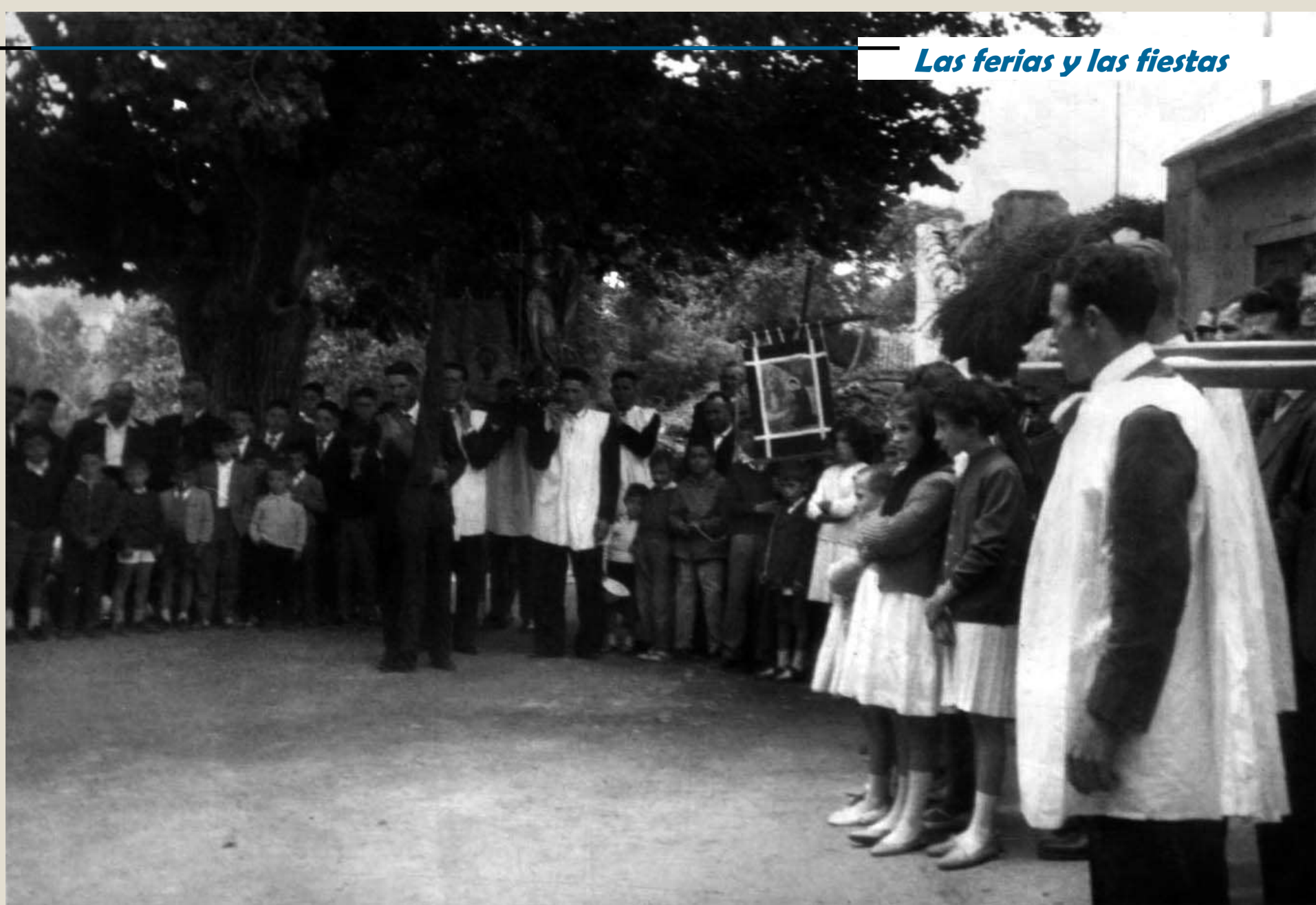
Antigua plaza del Olmo, carretera del pantano, con San Blas y estandarte de los niños. Años 60.