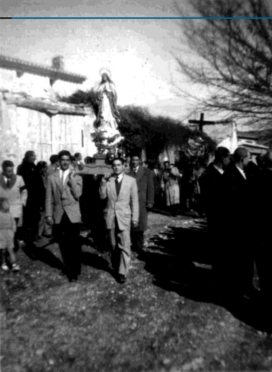
Procesión en las fiestas de San Blas. La inmaculada, detrás la Piedad. ¿Años 50?