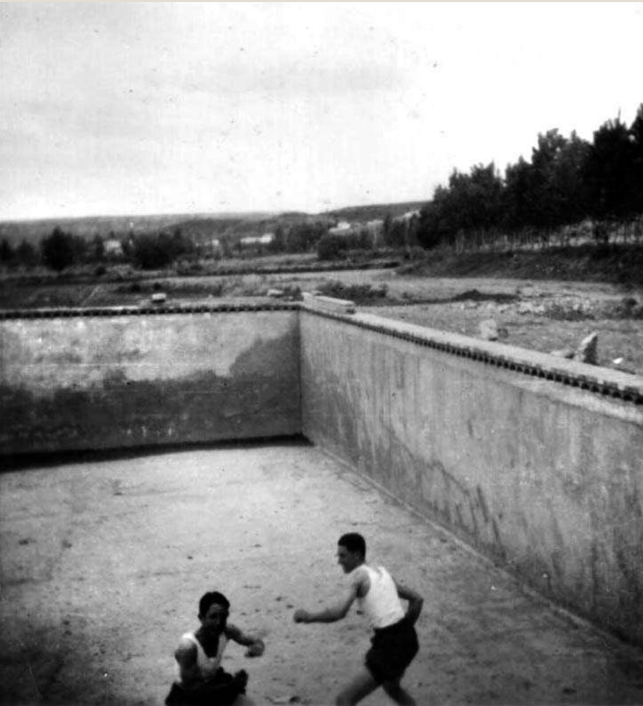
En la piscina de la Masía del Puente.