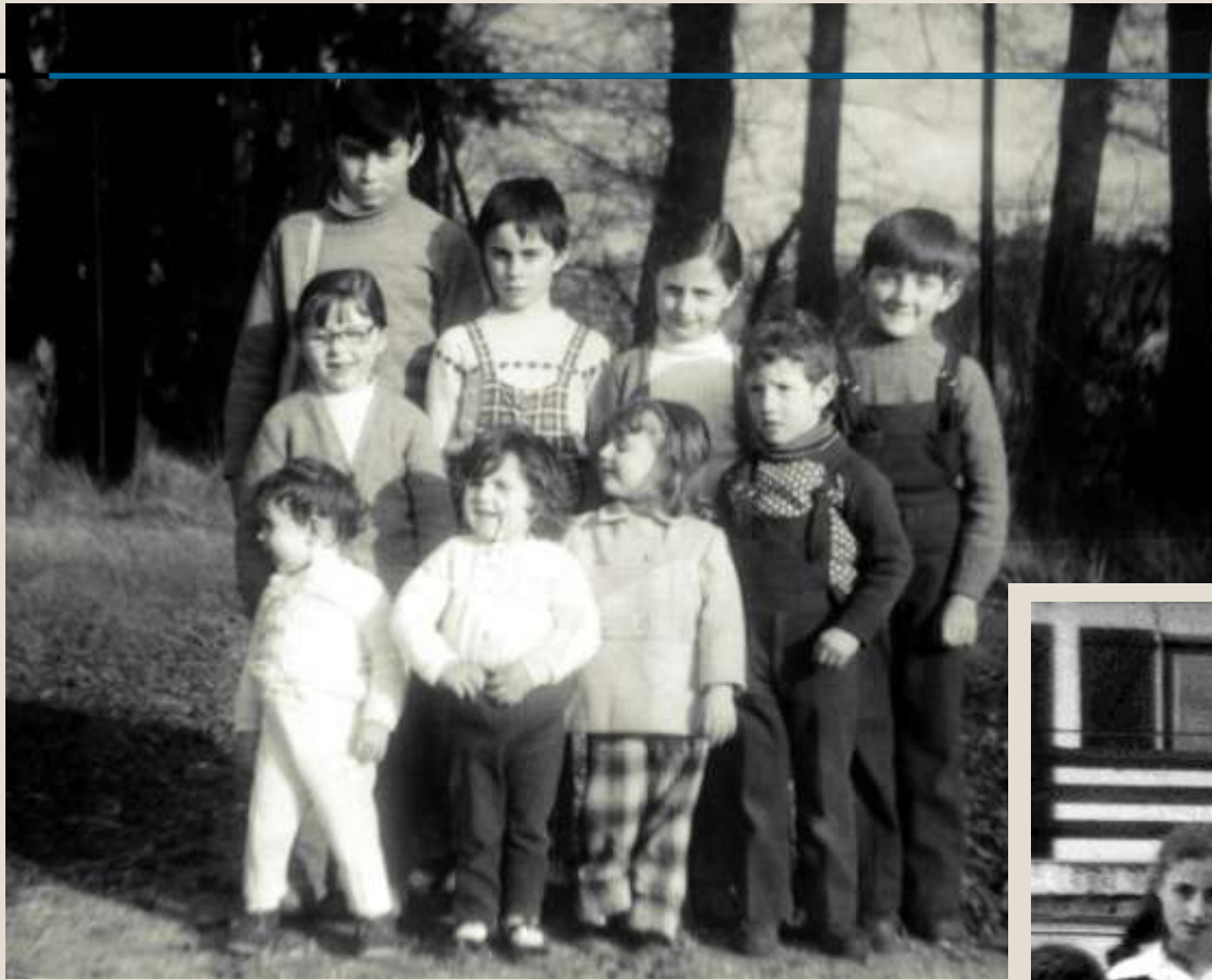
Reunión de primos Villarroya. 1975.