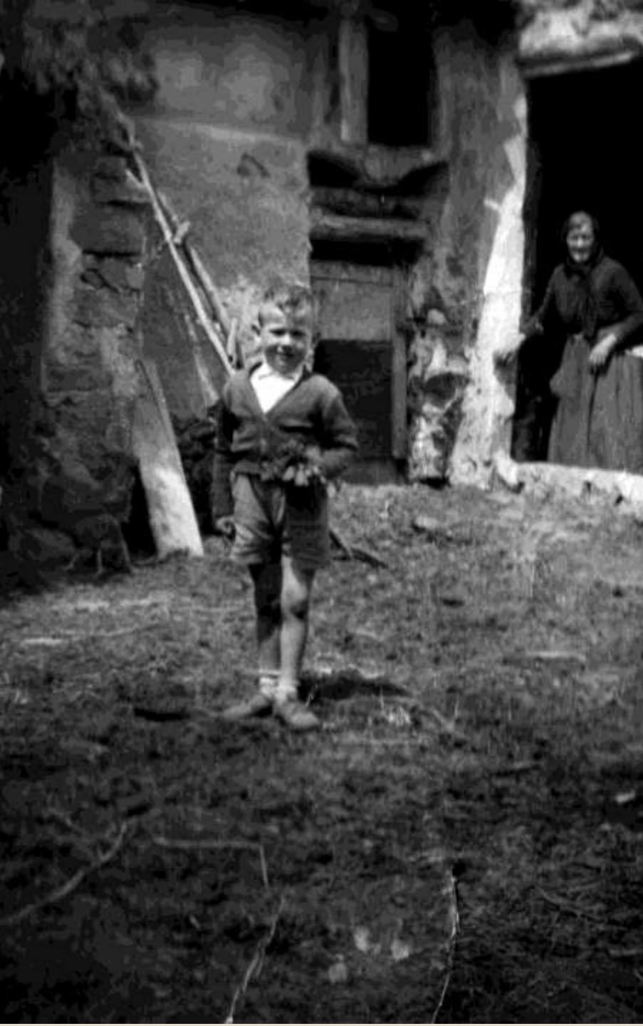
Niño con abuela en corral. Años 40.