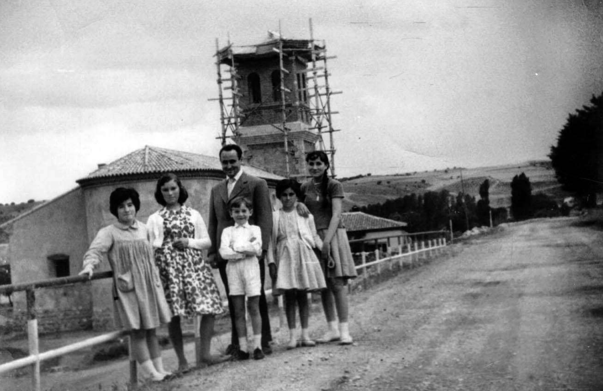
Carretera Toril–Masegoso, a la altura de la iglesia, en construcción. Años 50-60.