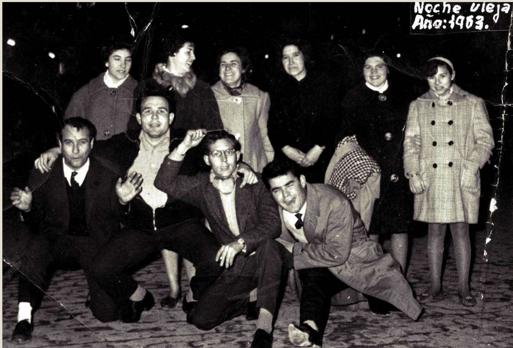
Nochevieja en Plaza del Torico. 1963.