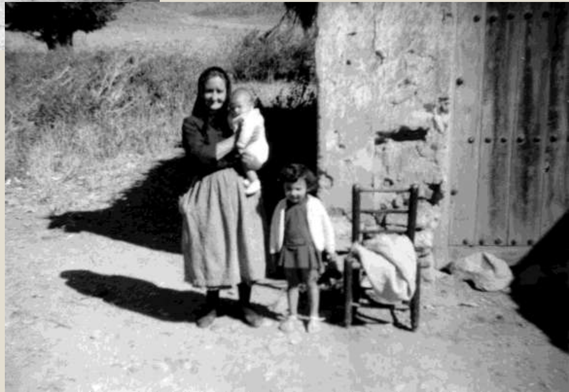
Abuelas con niños, al lado de la Rambla.