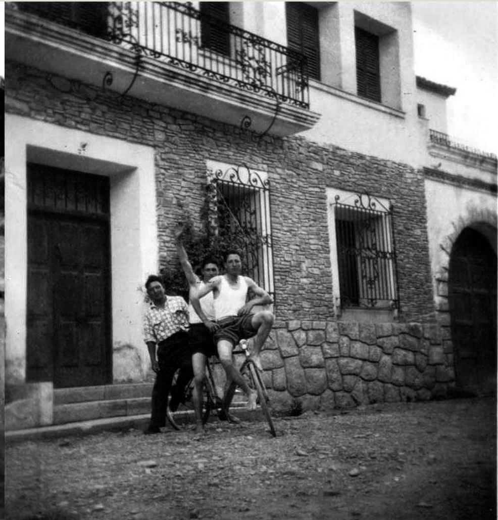
En la Masía del Puente, fachada principal.