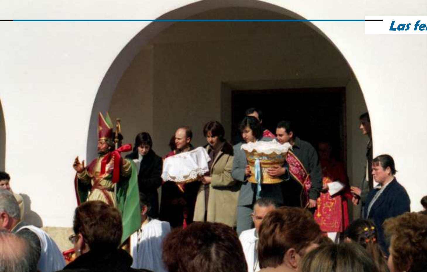
Fiesta de San Blas, Año 2000. Salida de la iglesia precedidos por la imagen del santo.