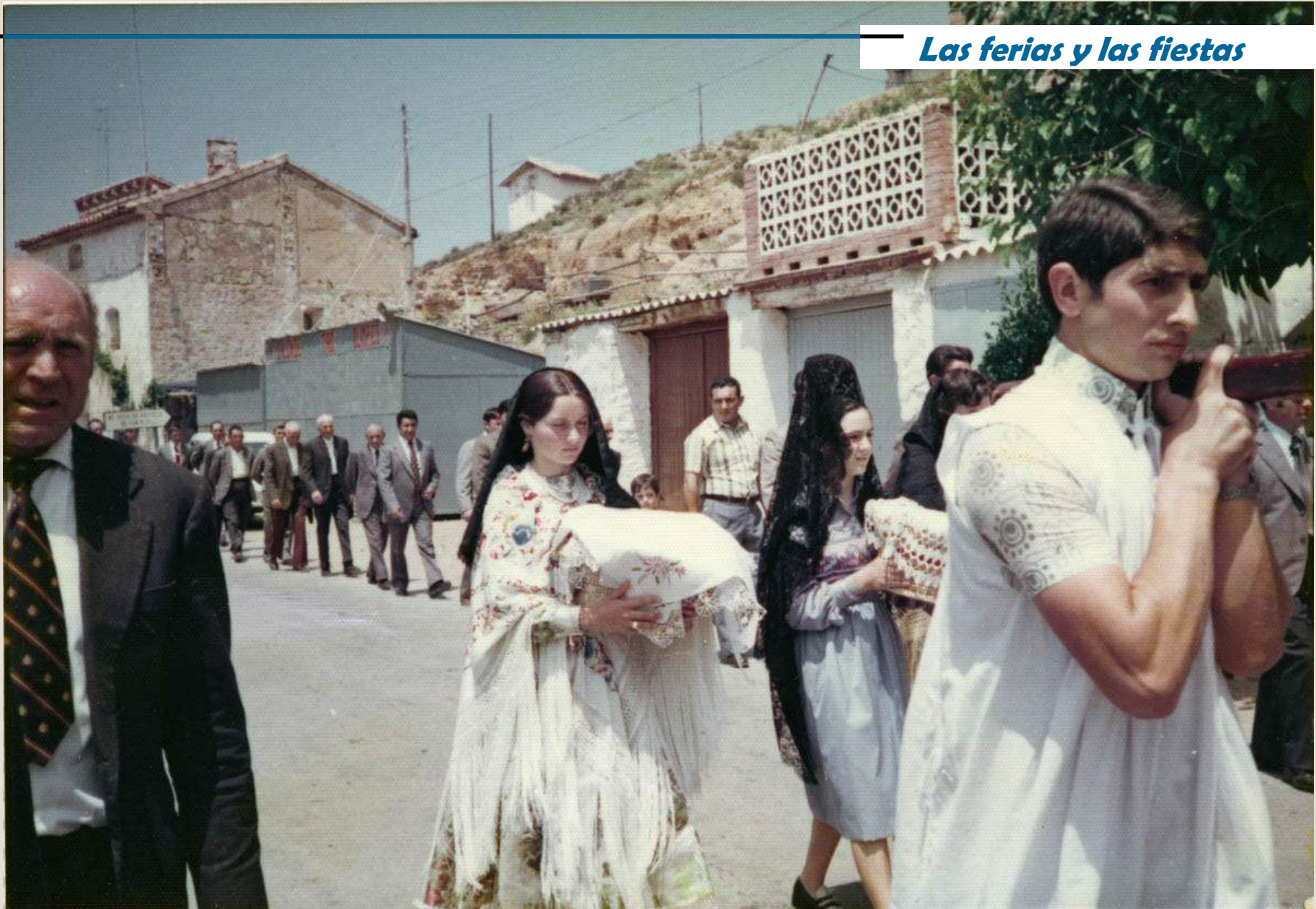
Procesión de La Inmaculada por la carretera. 1990.