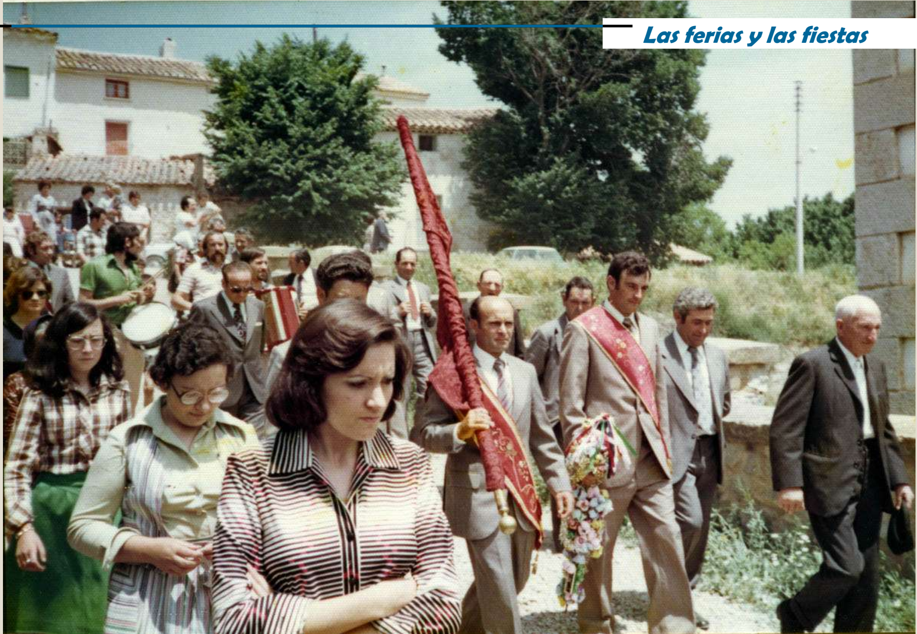
Fiestas de La Piedad 1990. Clavarios bajando a la iglesia con bandera y chuzo.