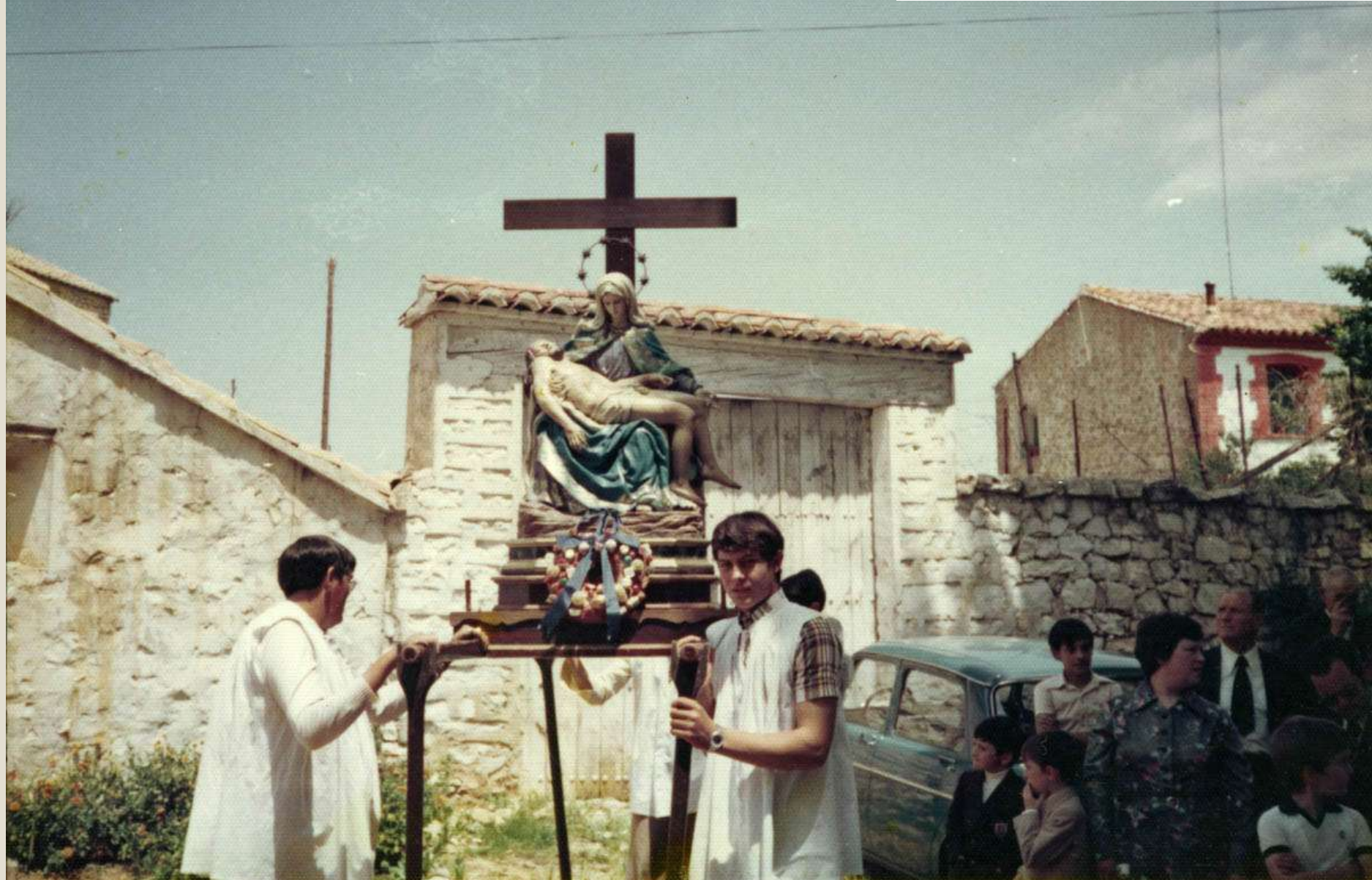
Descanso de la imagen de La Piedad con sus portadores. 1990. Vemos el roscón adornado.