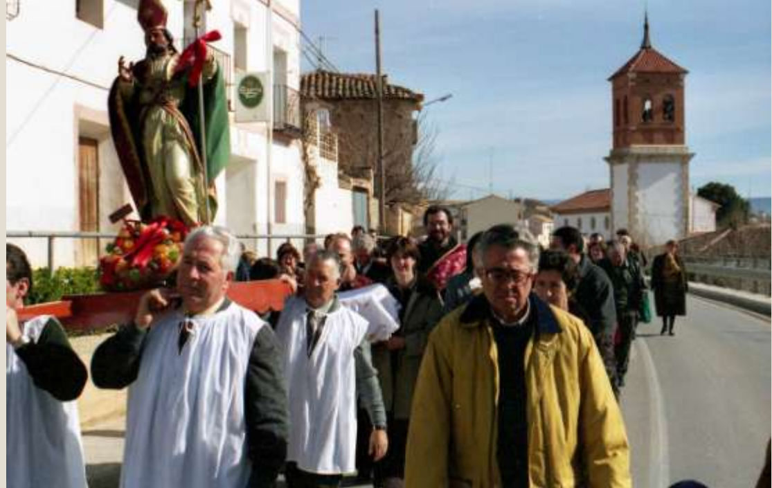
Fiestas de San Blas, procesión por la carretera.