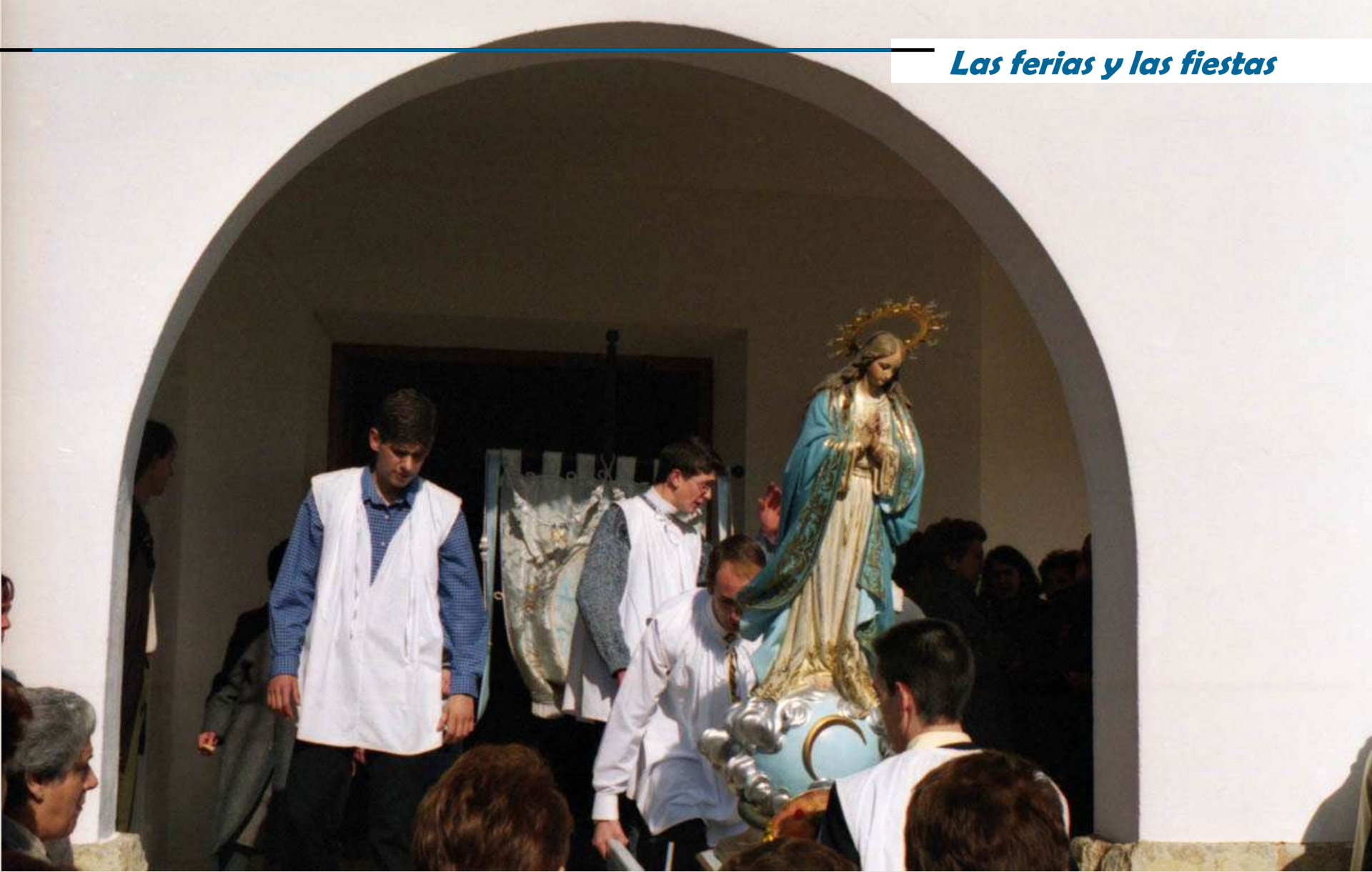
Fiesta de San Blas, Imagen de la inmaculada.