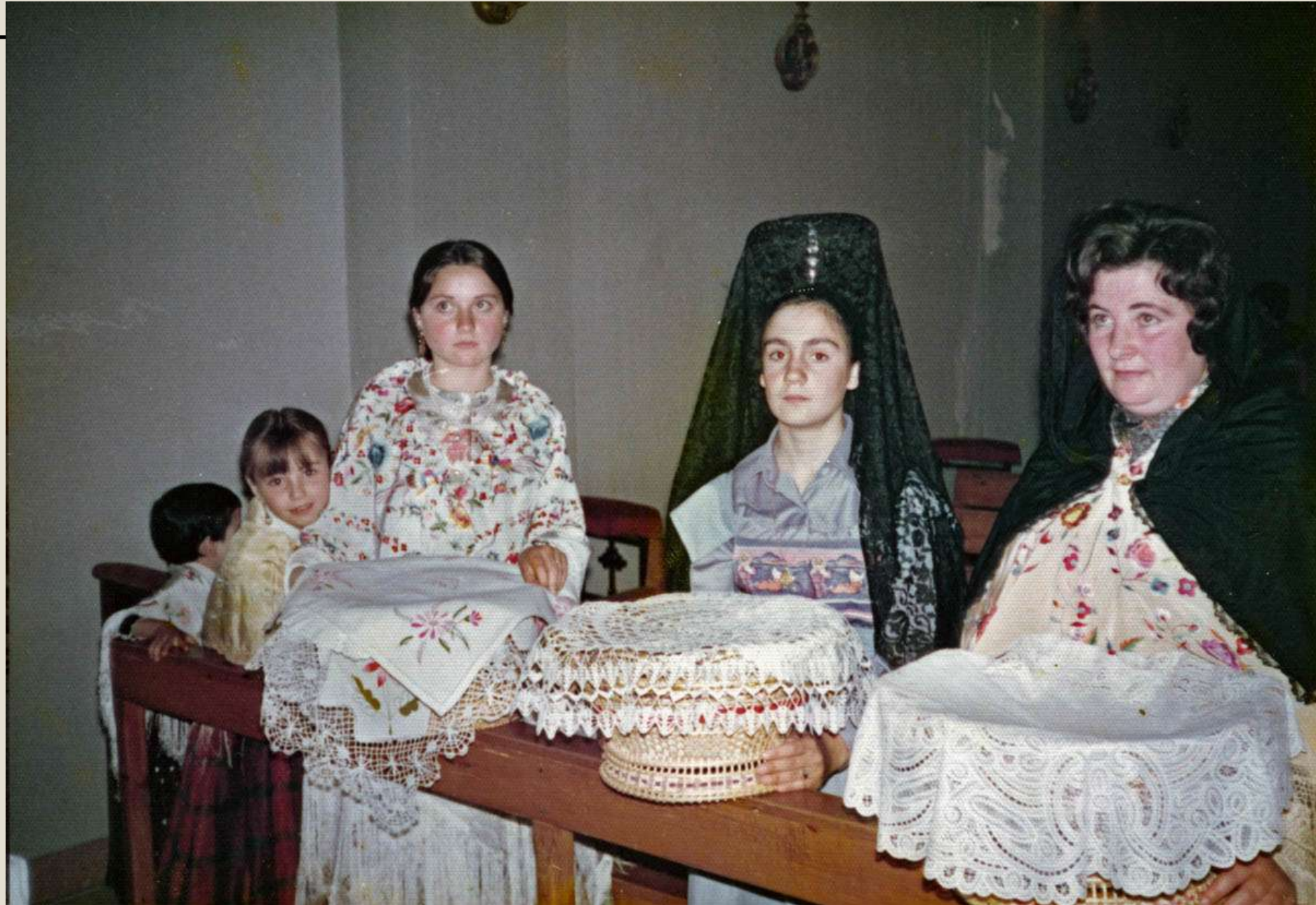
Fiestas de la Piedad, Clavarias con las pastas consagradas en la iglesia. 1990