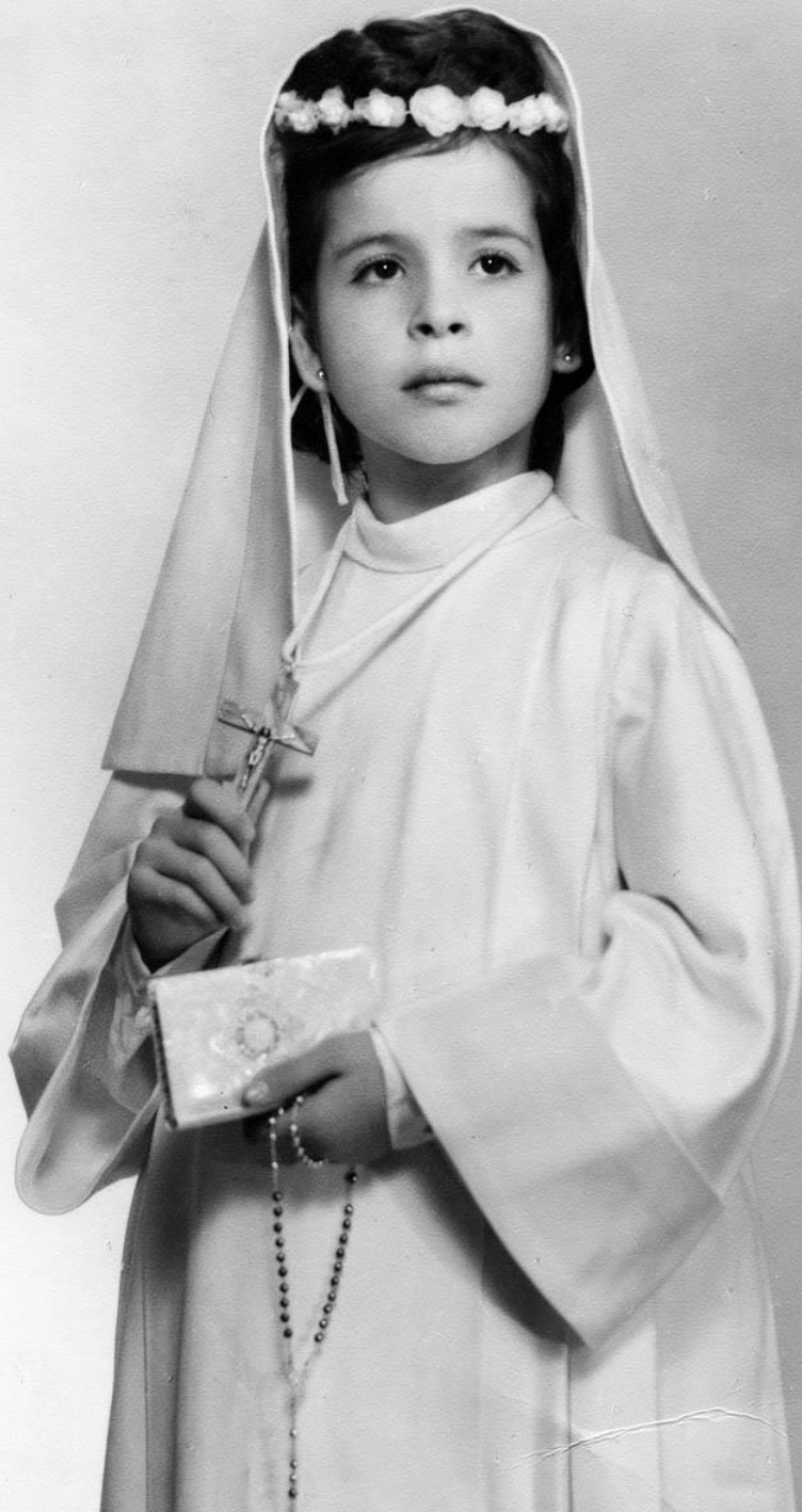
Foto de Comunción de Esperanza, Teruel, 1963.