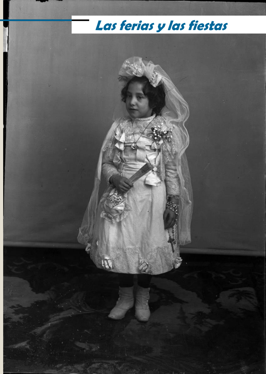
Fotos de Primera Comunción en Teruel a principios de siglo XX