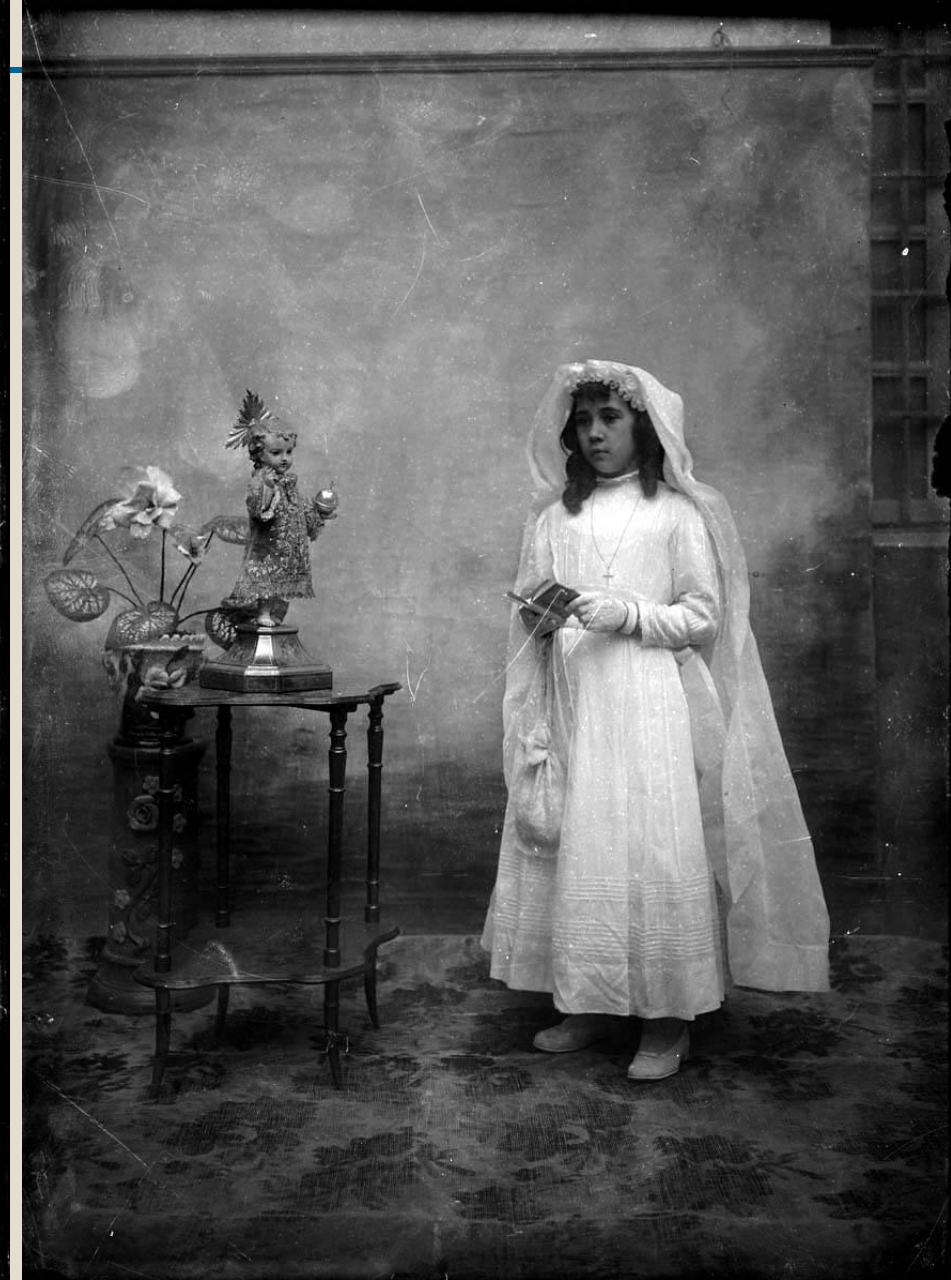
Niñas vestidas para la Primer Comunión en el Asilo de Enseñanza del Sagrado Corazón de Jesús. Las niñas uniformadas son las niñas acogidas y las otras son estudiantes libres.en Teruel. Alrededor de 1910.