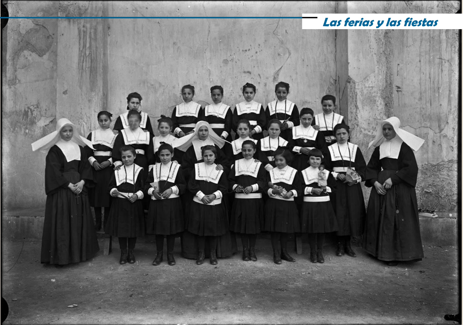
Niñas vestidas para la Primer Comunión con monjas. Asilo de Enseñanza del Sagrado Corazón de Jesús, en Teruel. Alrededor de 1910.