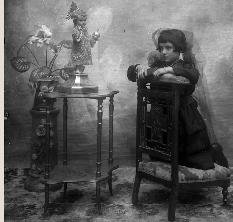
Foto de Primera Comuni3n en Teruel a principios de siglo XX