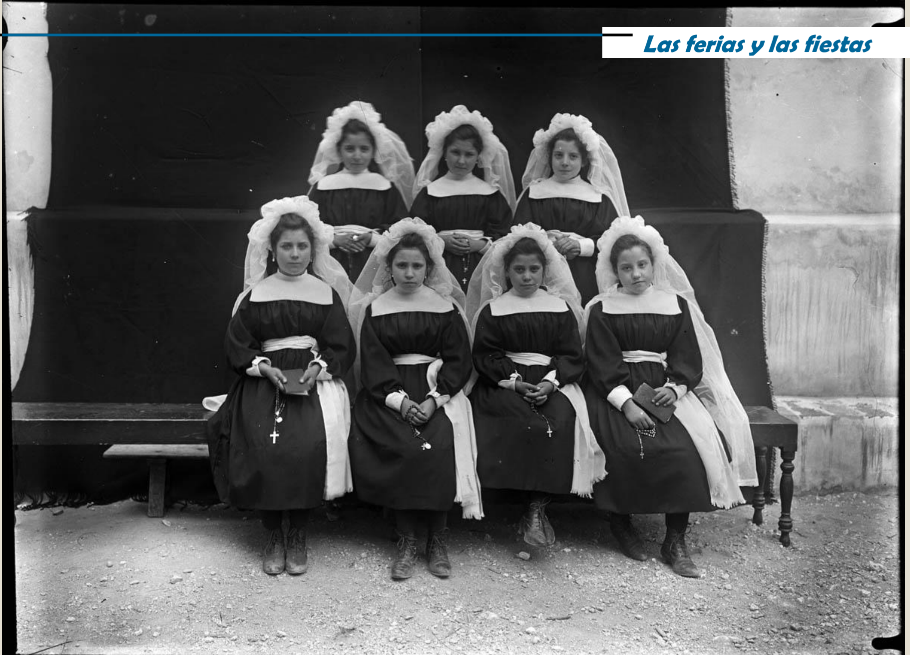
Niñas vestidas para la Primer Comunión. Asilo de Enseñanza del Sagrado Corazón de Jesús, en Teruel Años 1900-1910.