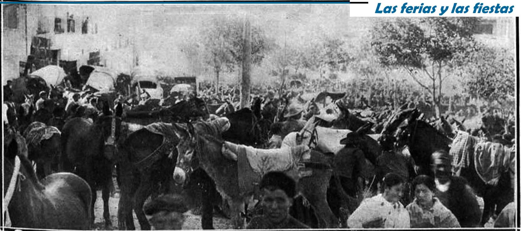
TERUEL.—Aspecto de la feria de ganados.

Feria de Ganado de San Fernando en la Ronda del cuatro de Agosto. 1914.