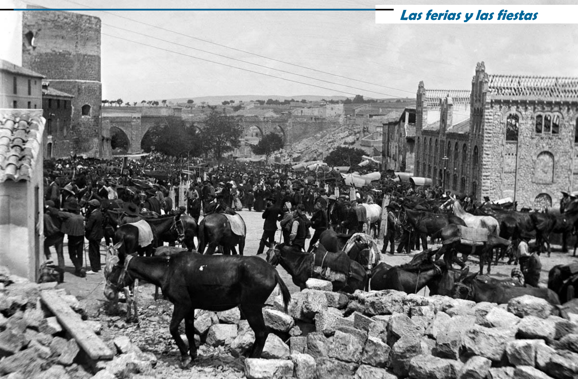
Feria de Ganado de San Fernando en la Ronda del cuatro de Agosto. 1902. A la derecha las escuelas sin terminar.