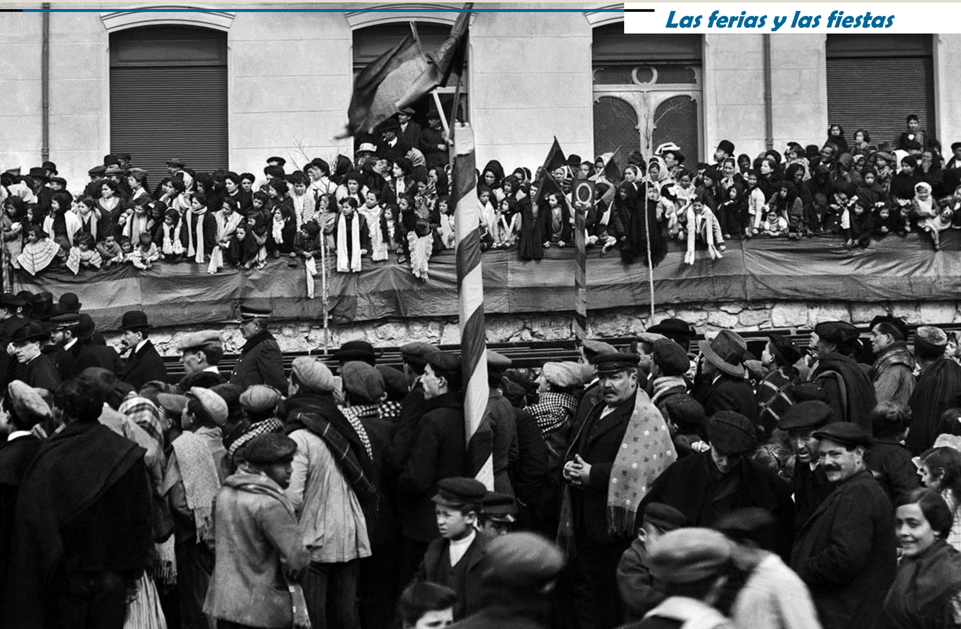
Fiestas en la Glorieta. Alrededor de 1914. Detalle del público.