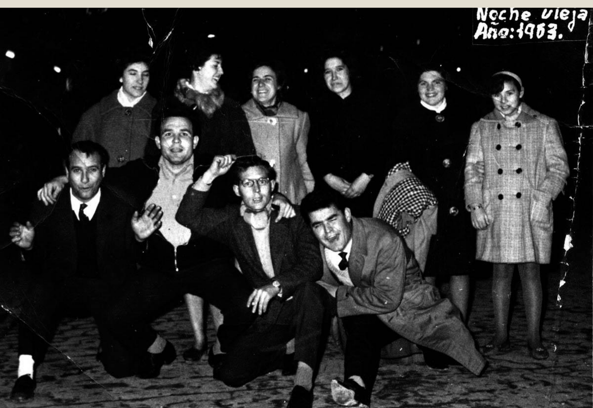
Noche vieja en la Plaza del Torico. 1963.