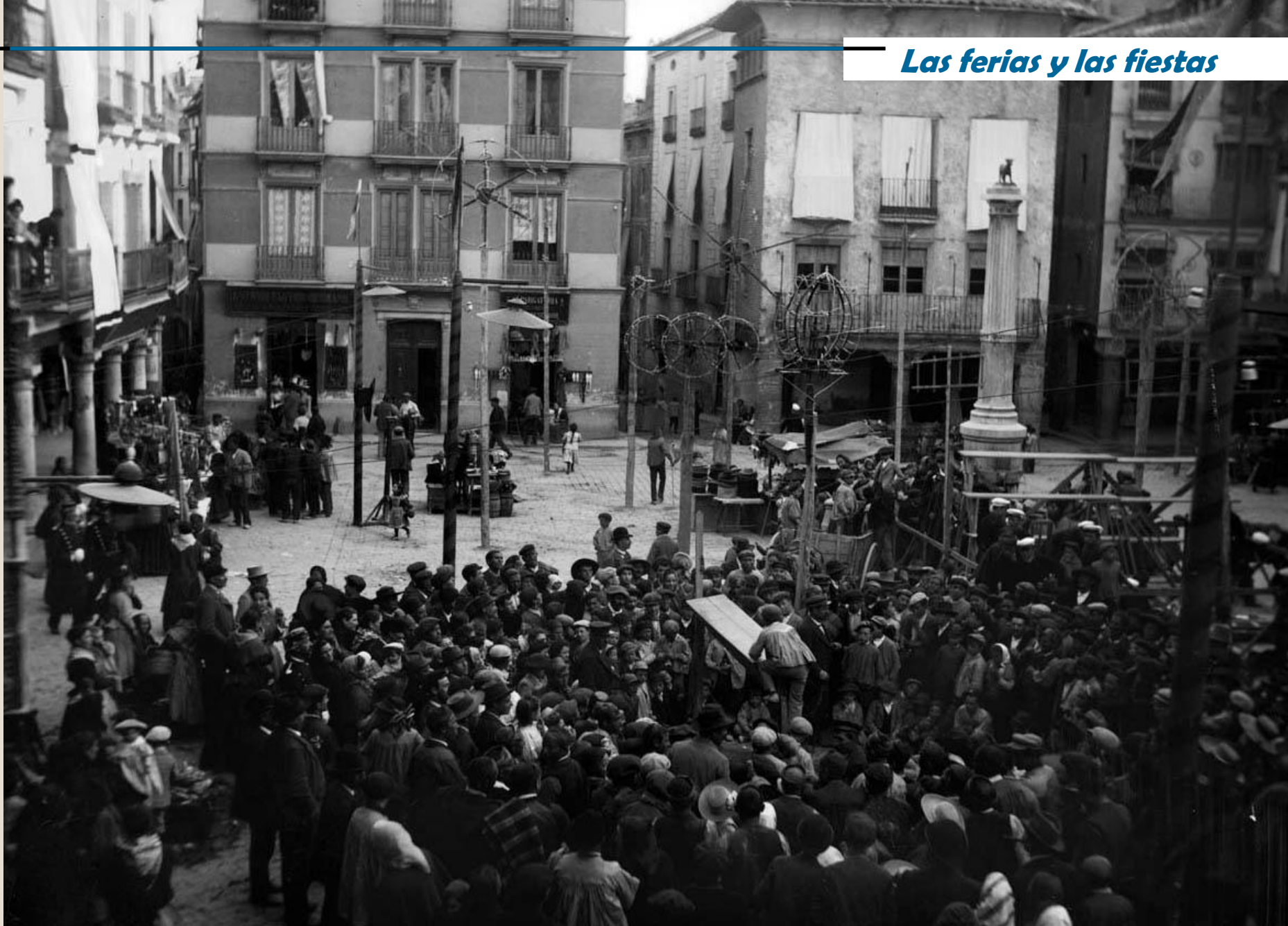
Fuegos artificiales y juegos infantiles en la Plaza del Torico, Teruel. Alrededor de 1900.