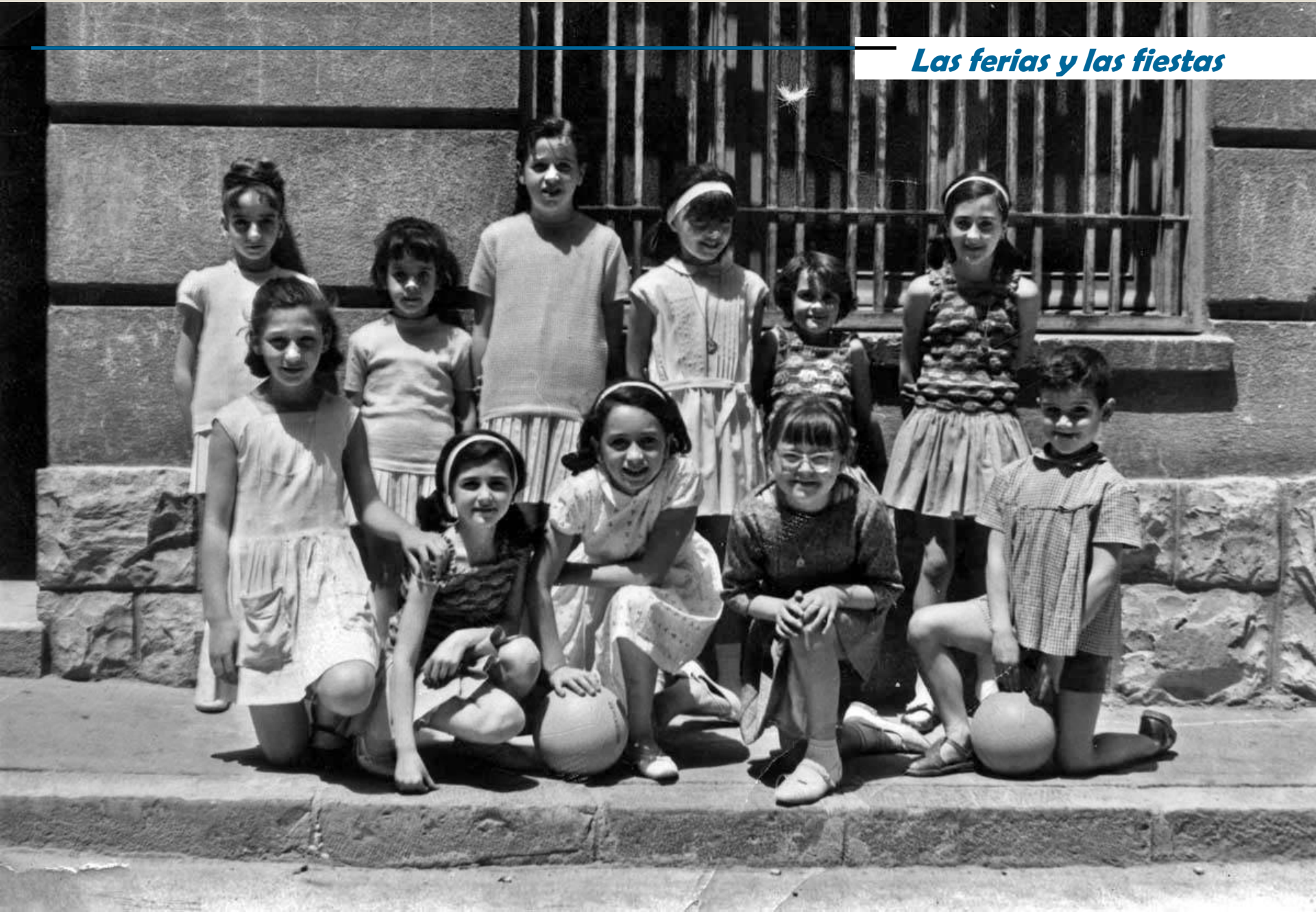
Niñas y niño, con pelotas en la calle 22 de Febrero, Teruel. Verano de 1964.