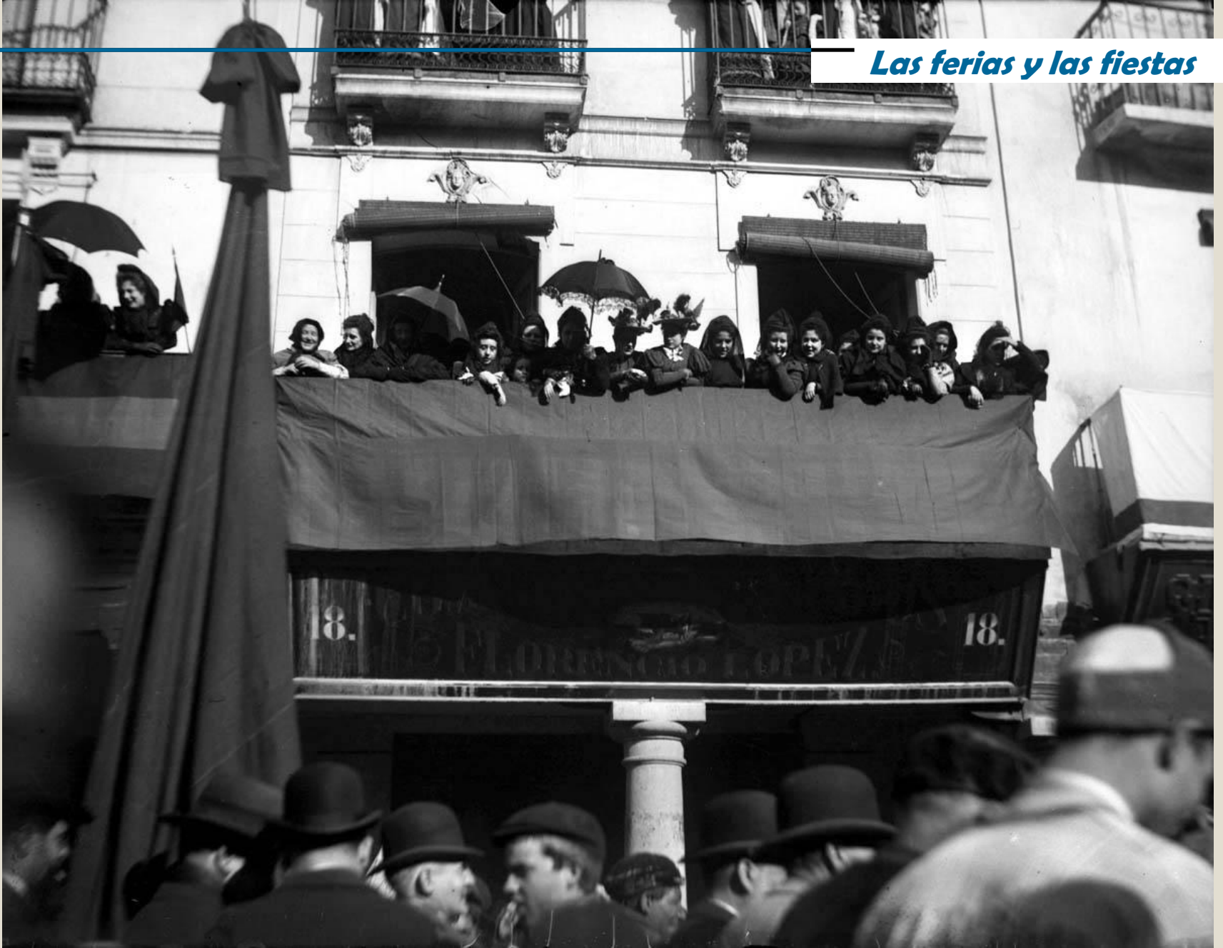
Manifestación en contra de la intervención de Estados Unidos en la Guerra de Cuba. Plaza del Torico, 1898.