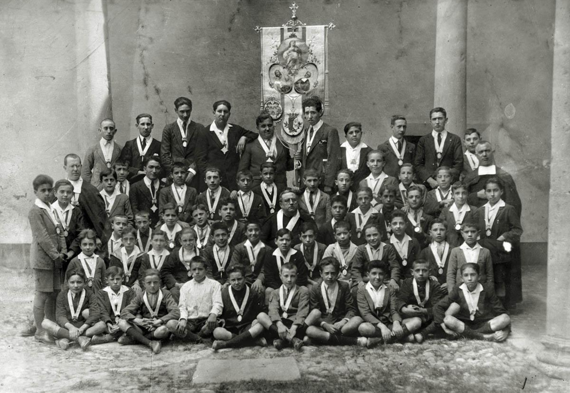
Grupo de alumnos de La Salle. Teruel. Década de los 20