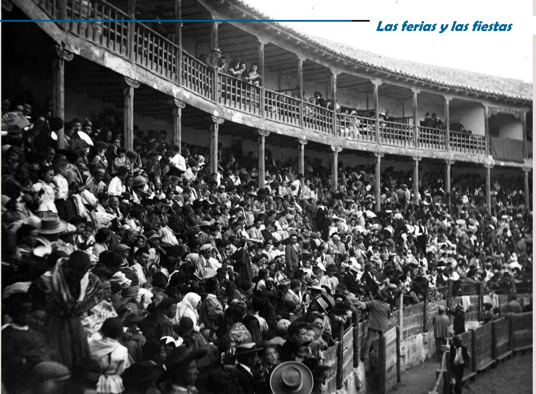
Plaza de Toros de San León, Teruel. Alrededor de 1900.