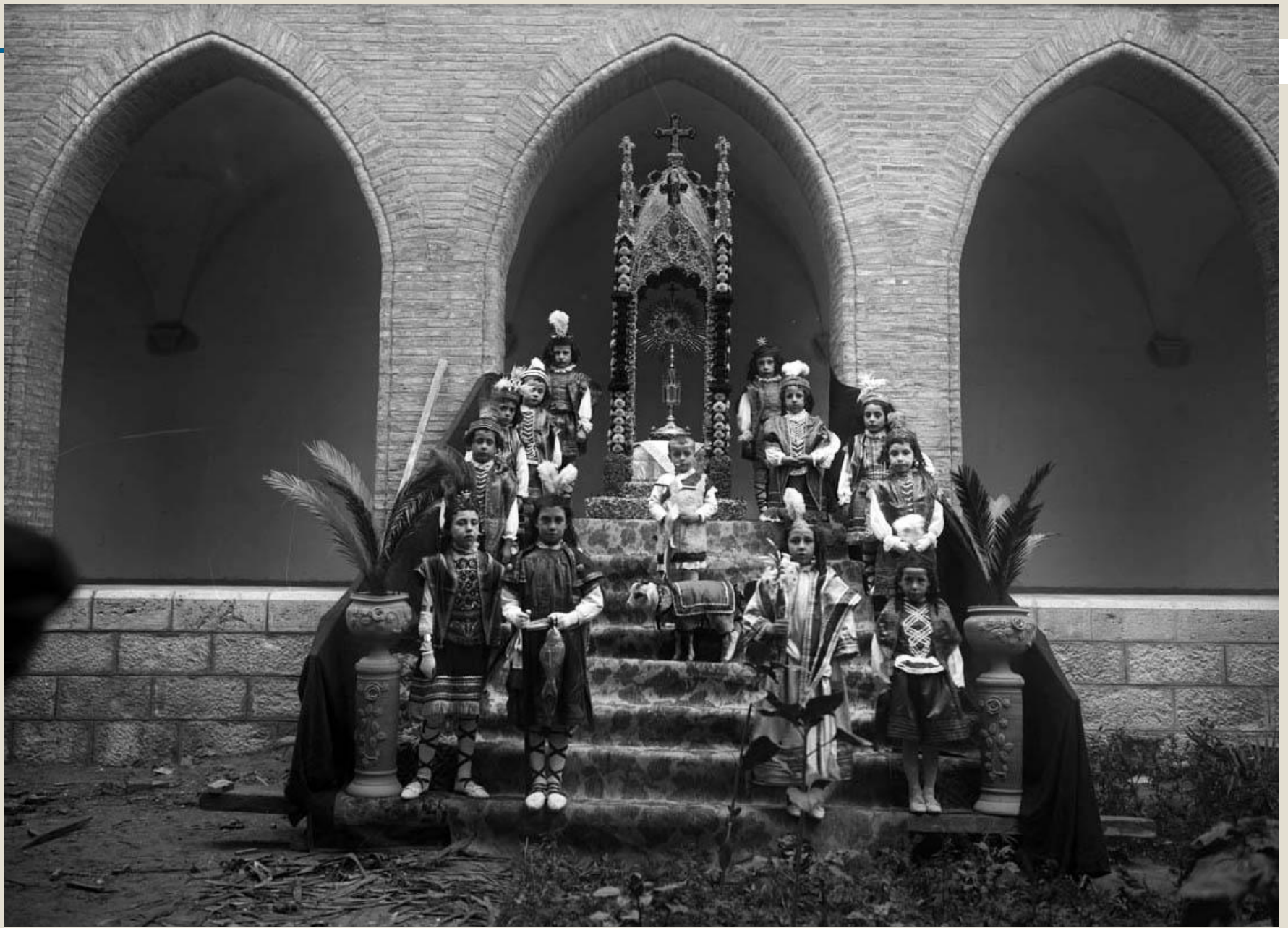
Representación religiosa infantil en el claustro del convento de los Franciscanos. ¿Corpus? Alrededor de 1900.