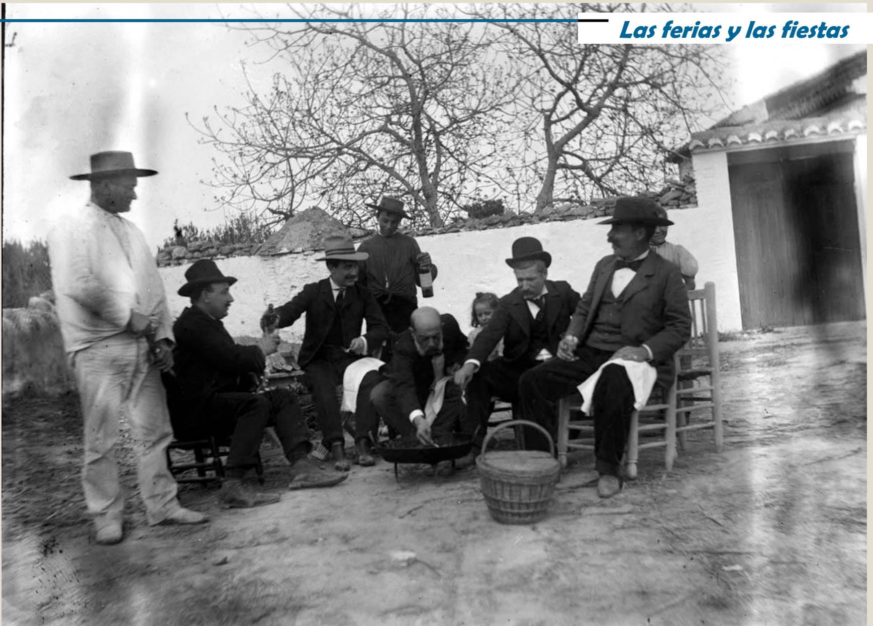
Merienda en la masada de burgueses, a principio de siglo XX en Villastar.