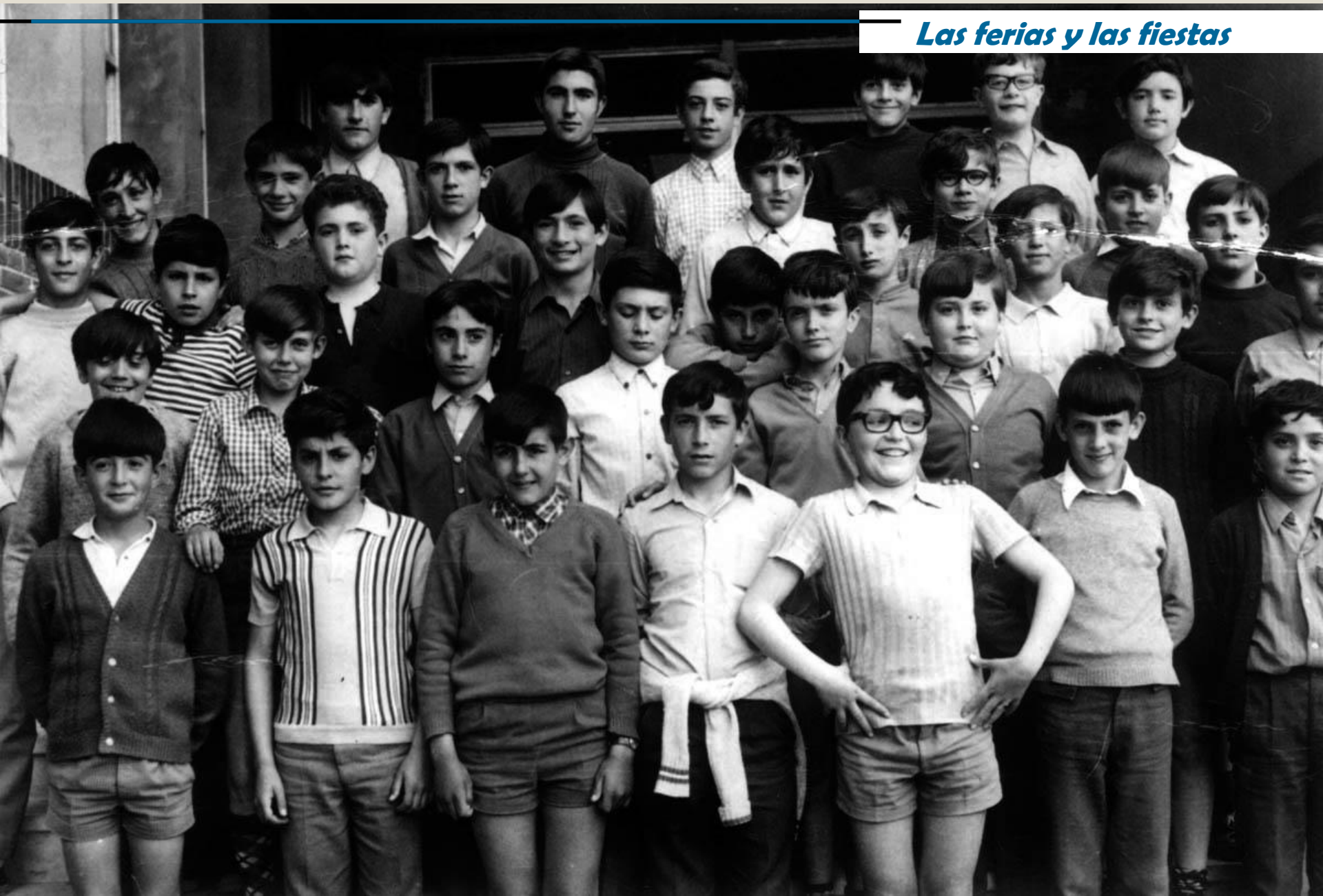
Una clase de cuarto de Bachiller Elemental en la Salle, Teruel. 1972.