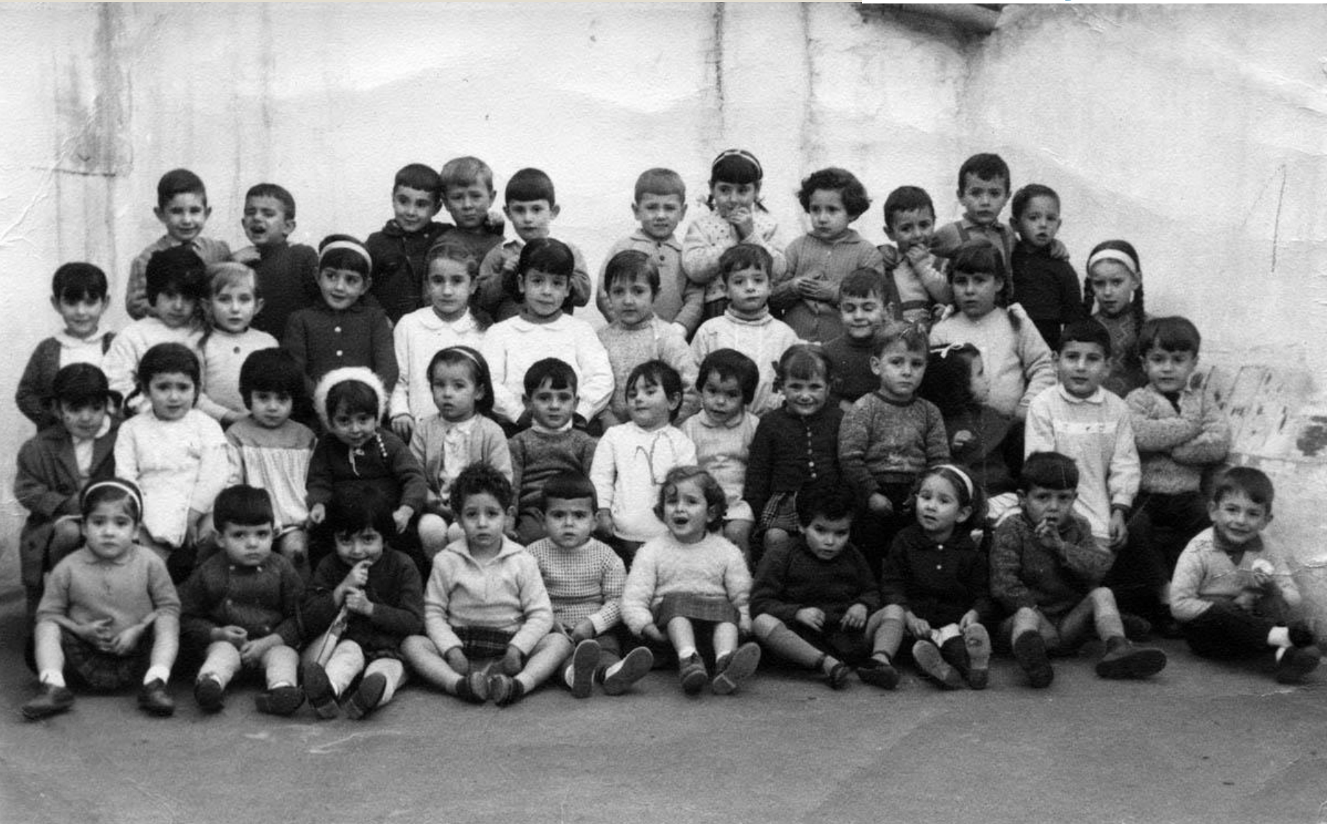
Colegio de las Claras. Clase de parbulitos. 1962.