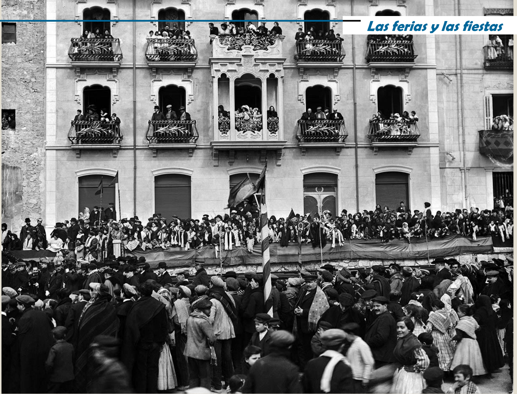
Fiestas en la Glorieta. Alrededor de 1914.