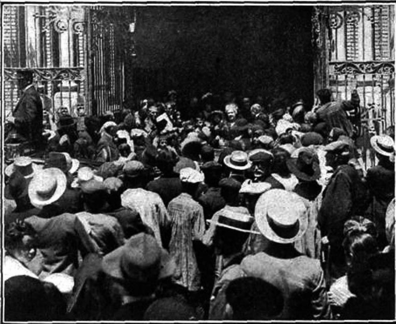
TERUEL.—La Infanta saliendo de la Catedral

Fiestas por la visita de la infanta Isabel a Teruel. Fotografía a la salida de la catedral. La infanta llevaba una corona para que se notara que era de la familia real. Plaza de la Catedral, en Teruel, julio de 1912. Imagen publicada en La hormiga de oro en 21 de julio de 1912.