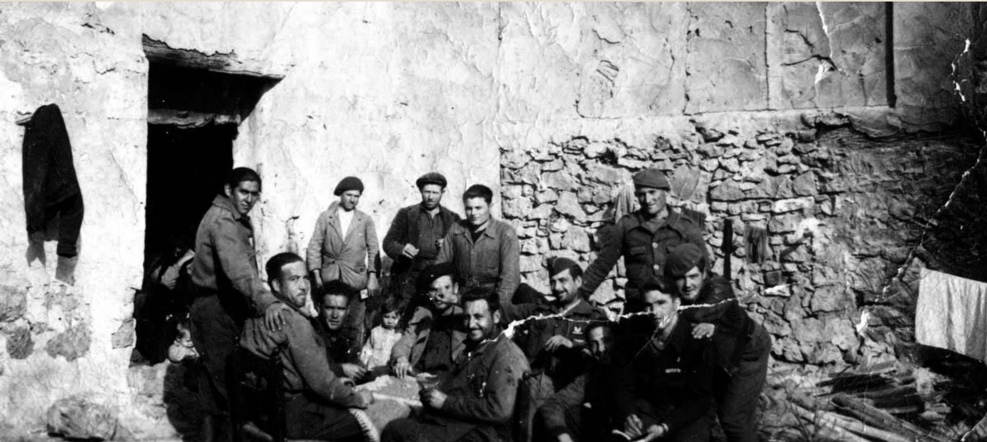
Familia Villarroya en la masada del Campano con soldados durante la Guerra Civil.