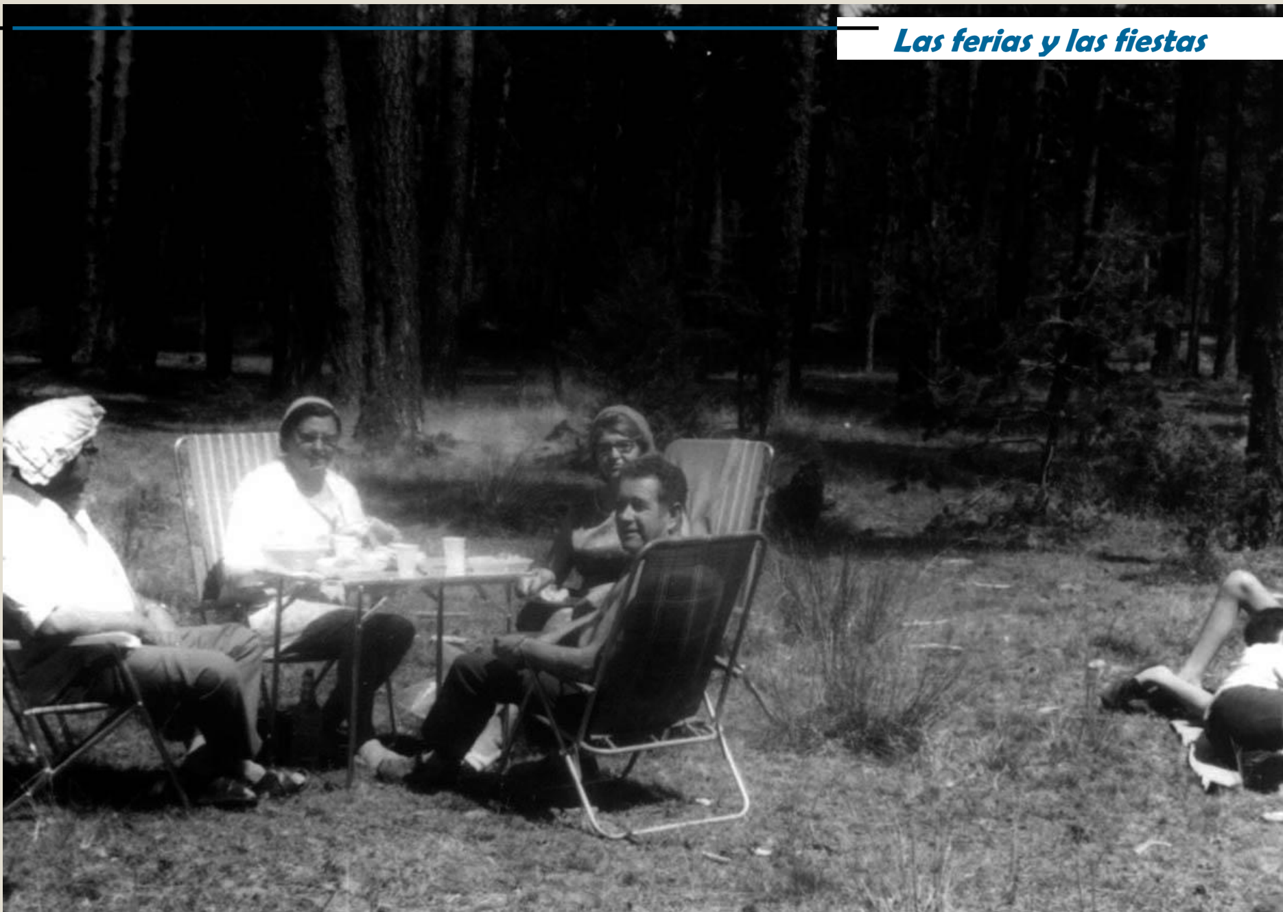
Comida campestre en los alrededores de la Laguna de Rubiales.