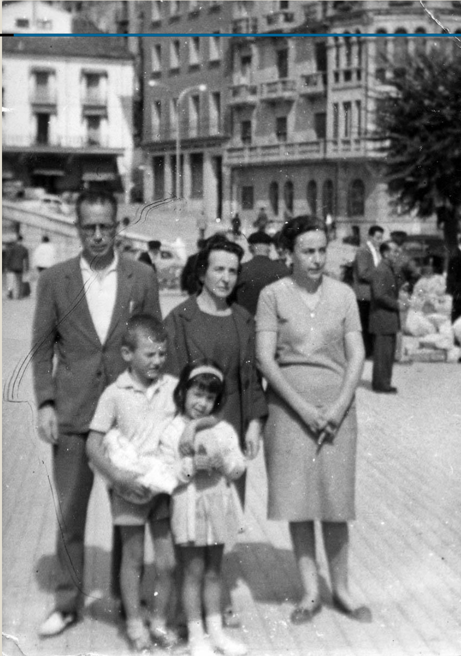
Familia en el Óvalo, años 60.