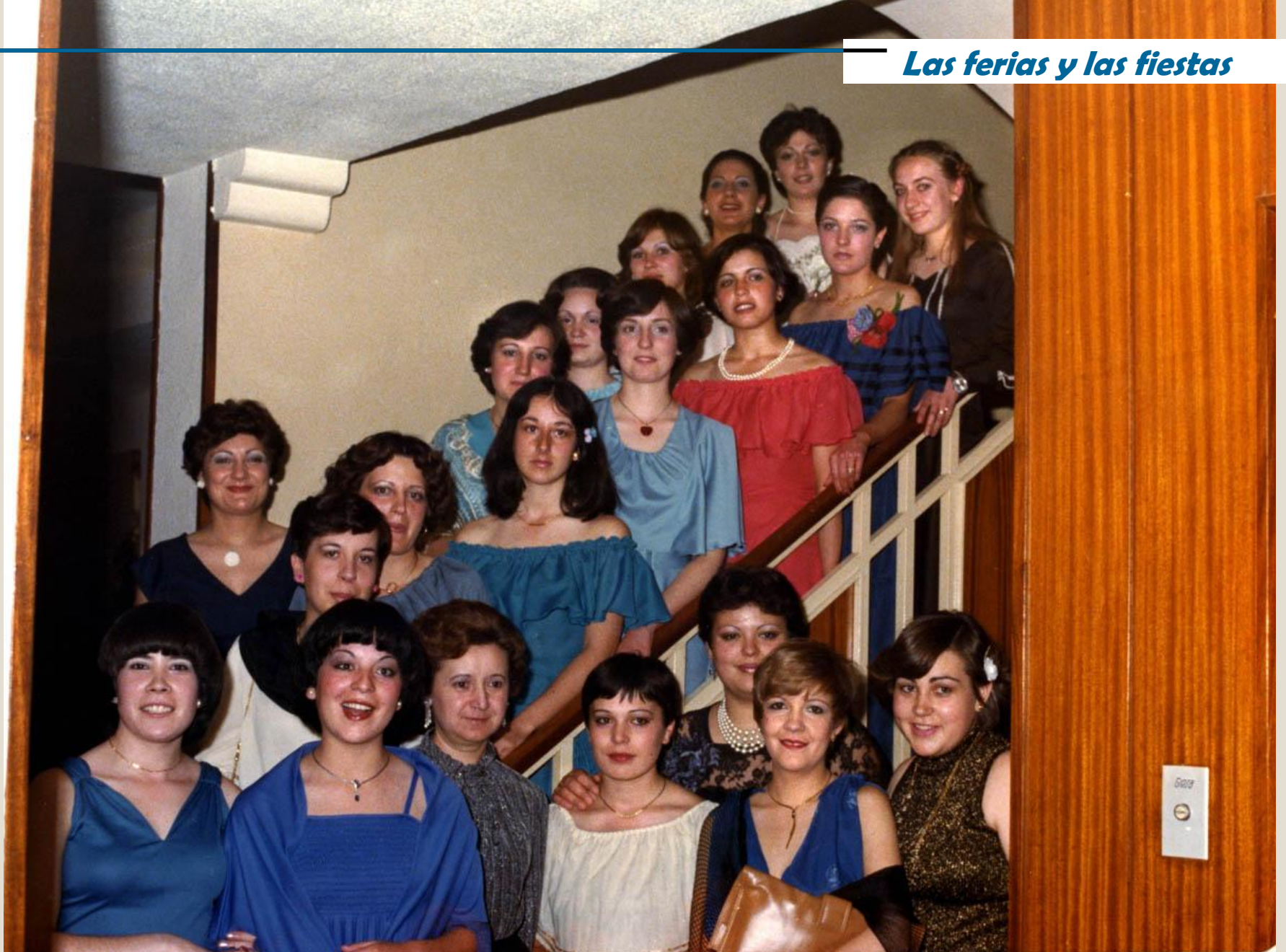
Fiesta de 7ª Promoción ATS en Teruel, año 1978.