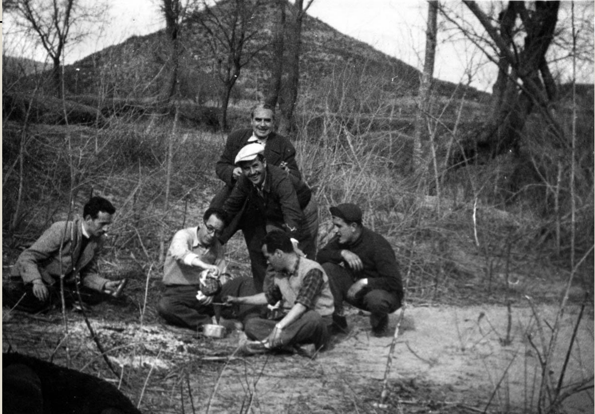
Grupo de amigos pescadores a la orilla del Turia. Teruel, años 50.