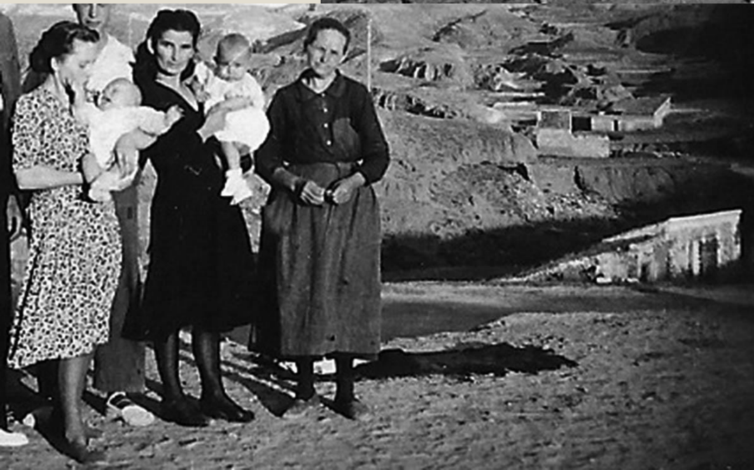
Fotos de familia desde las eras del Arrabal, Los Mansuetos. Año 1950.