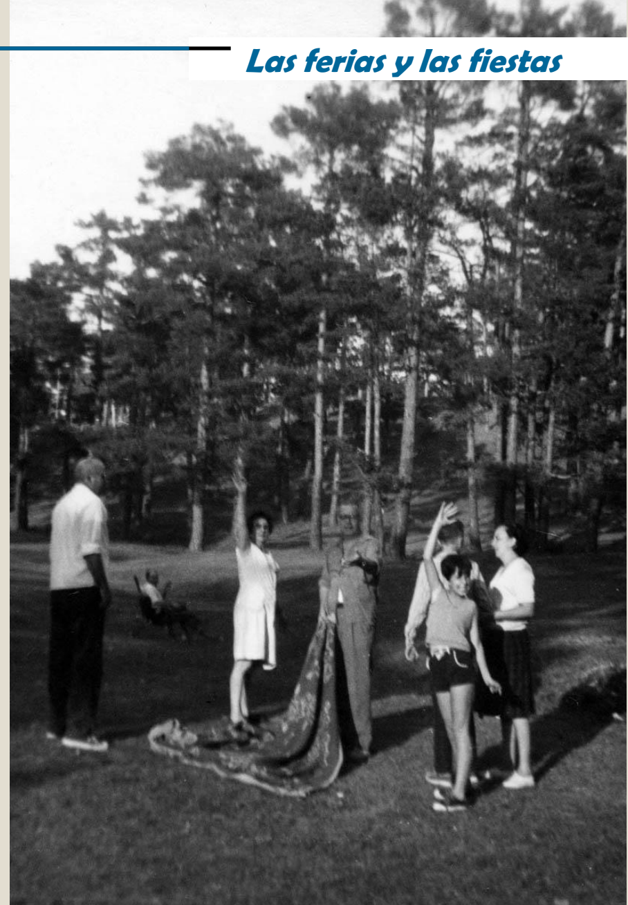
Comida campestre en el Algarbe, años 60.