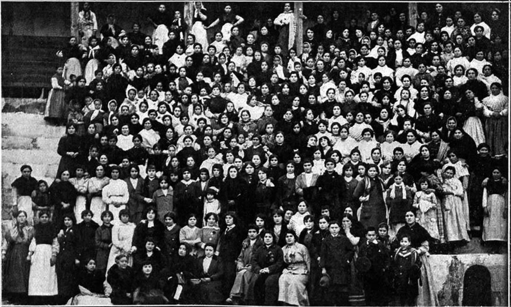
TERUEL.—Profesoras y alumnas de la Escuela Dominical

Imagen de la Escuela Dominical, de carácter religioso, que reunía a mujeres, aunque se ve algún niño, normalmente, damas caritativas de la alta sociedad turolense y mujeres y muchachas humildes. Plaza de Toros de San León en abril de 1918. Imagen publicada en La hormiga de oro el 29 de abril de 1918.