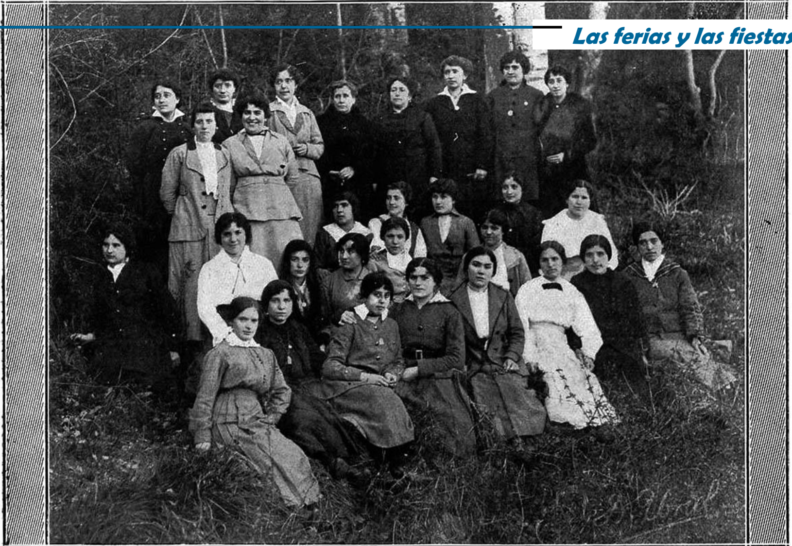
TERUEL.—Profesoras y alumnas que cursan el cuarto año en la Escuela Normal, verificando una excursión escolar en los alrededores de la capital.

En torno al magisterio había muchas actividades, desde el día del árbol, en que los niños con sus maestros salían al campo a plantar árboles, habría que recuperarlo, hasta excursiones educativas.