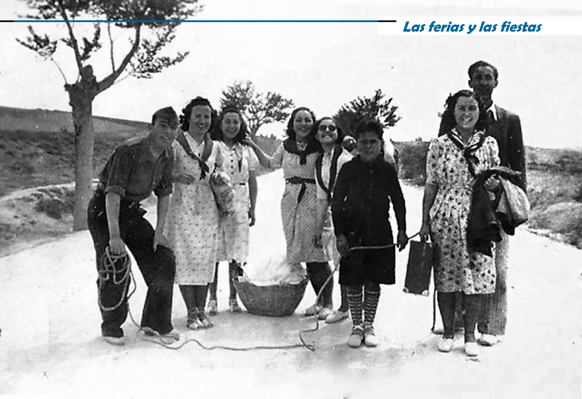
Merienda de jóvenes durante las vaquillas.. En la carretera de Alcañiz, entre 1942 y 1948.