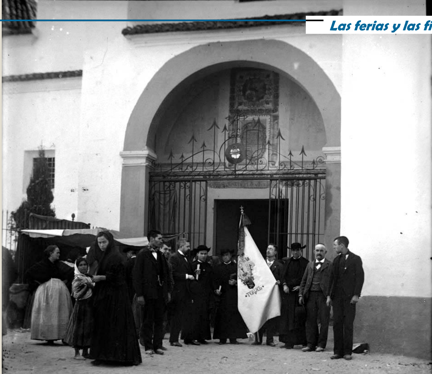
Miembros de la Adoración Nocturna de Teruel eran muy activos en romerías y procesiones. Aquí en la ermita de San Pascual Baylon en Villareal, Castellón. 1896.