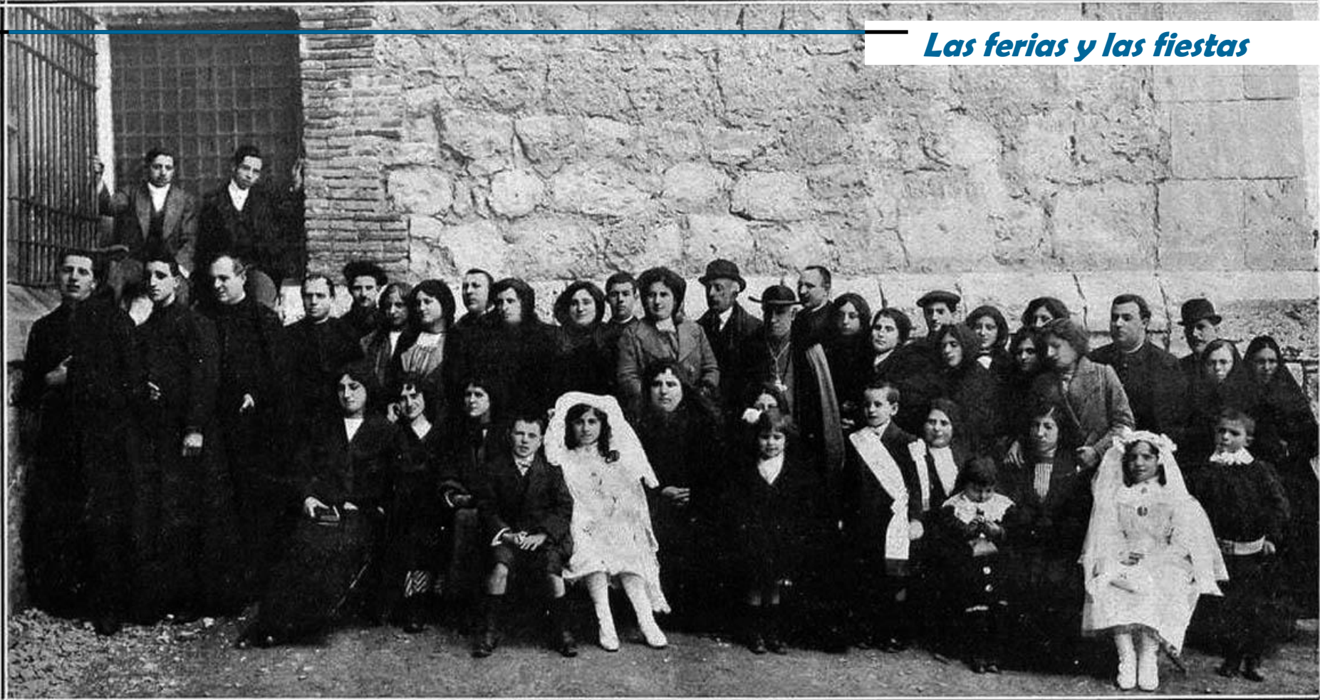
TERUEL. —Señoras y señoritas de las Conferencias de San Vicente de Paúl.

Organizado por las señoras y señoritas que forman la Conferencia de San Vicente de Paúl, se celebró en la iglesia del Seminario de Teruel, el día de la Ascensión del Señor, la Comunion de 1,326 niños: Un cántico divino, con exquisitices de sublime melodía resonó por toda la sagrada nave: unas angélicas voces ofrendaban al Señor ternuras y candores mientras la sagrada Forma era depositada en los virginales pechos. La palabra del Prelado se dejó oír, ensalzando la obra que se celebraba. Expresó el objeto de ella y dirigió frases de consuelo a los niños sin mostrar cansancio después de haber administrado el Santo Sacramento por espacio de dos horas a los niños que comulgaron.