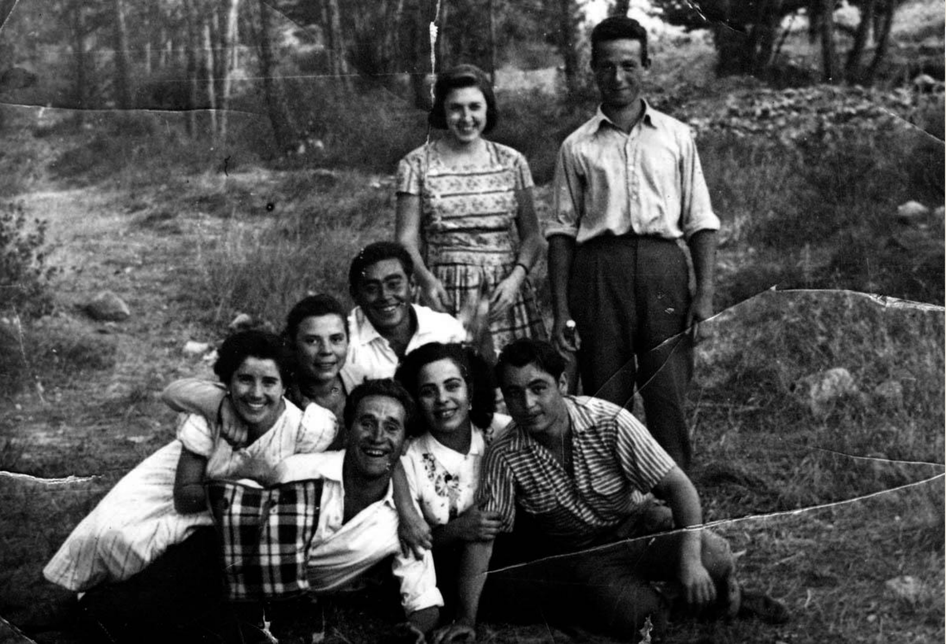
Grupo de amigos de día campestre. Años 50.