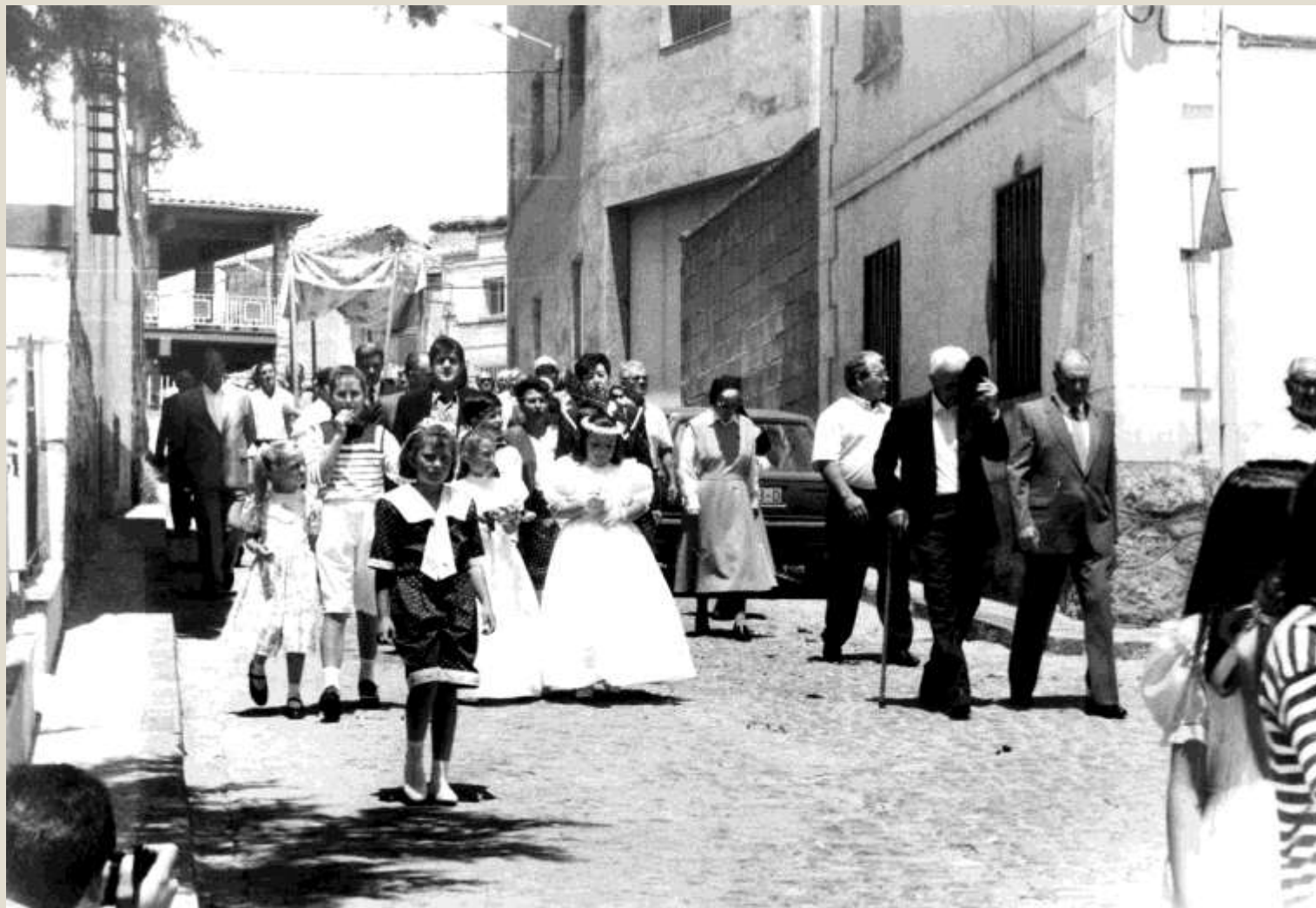
Procesión del Corpus con niñas vestidas de primera comunión. Contemporánea.