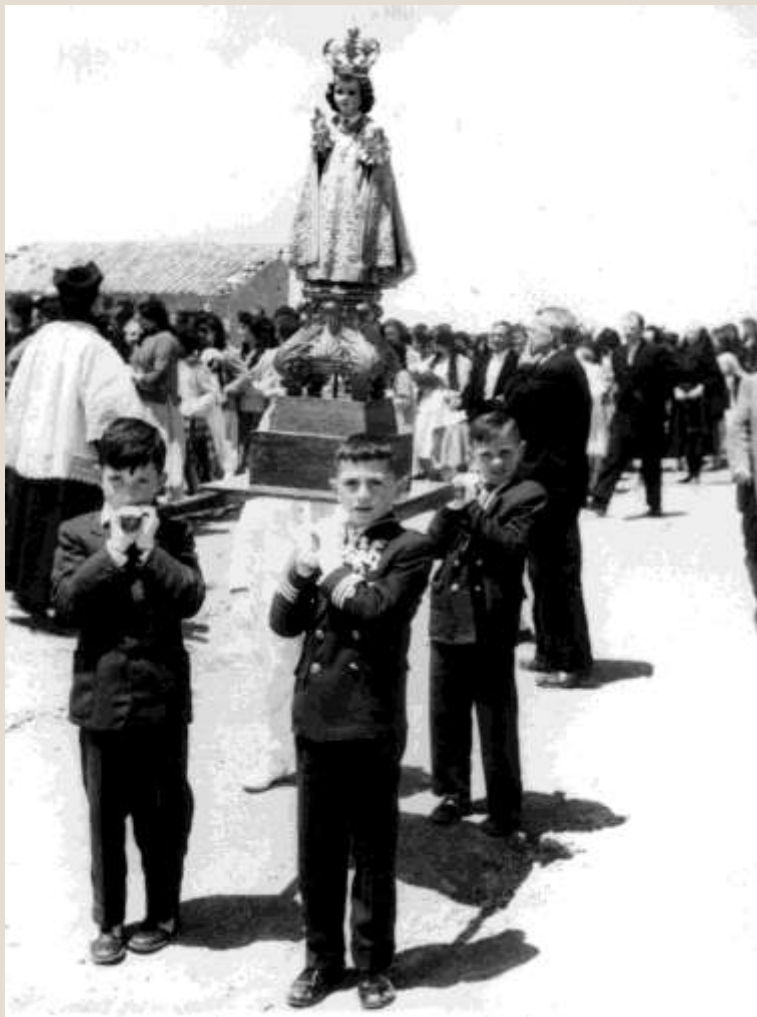
Procesión del Niño de la Bola llevado por los niños que hacen la comunión ese año.