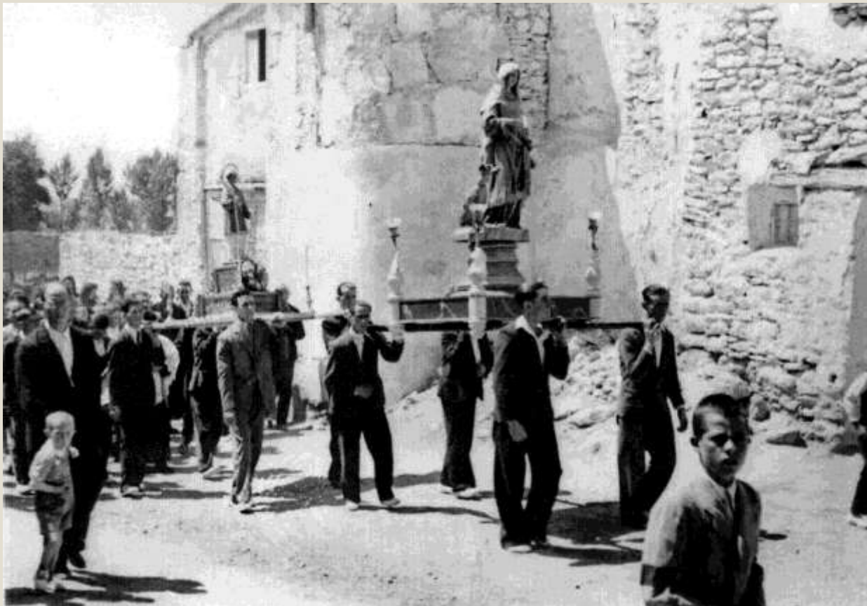
Procesión de Santa Quiteria y San Lorenzo , en las fiestas de agosto. 1957-1958.