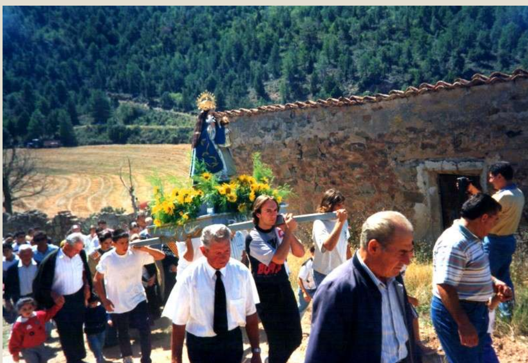
Romería a la ermita de la Virgen de Cilleruelos .