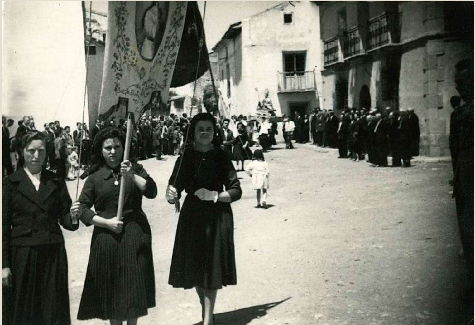
Fiestas mayores en Mayo. El viernes se saca en procesión a Santo Domingo de Silos. Plaza Padre Andrés. Años 60.