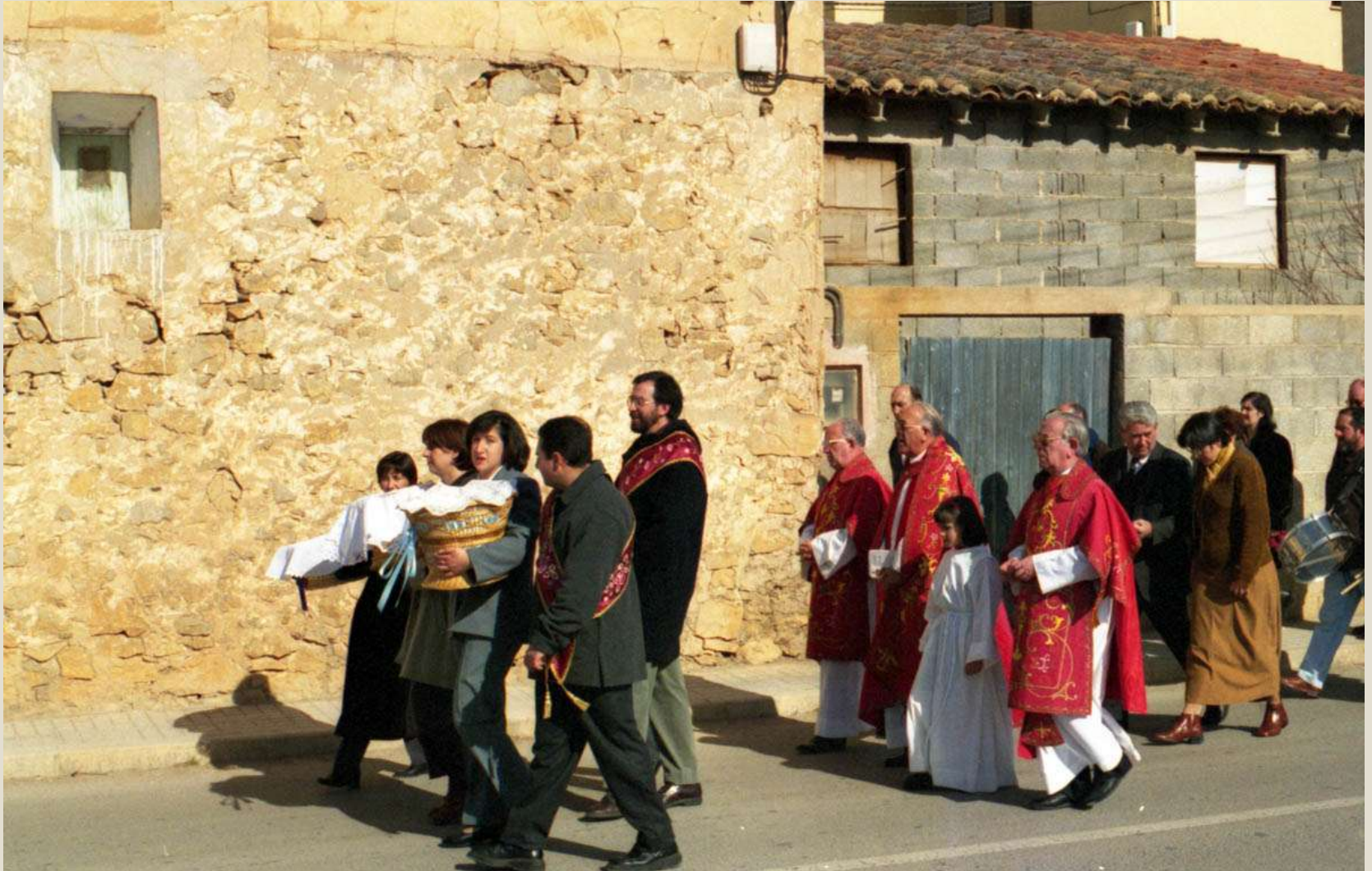
Procesión de San Blas . Las clavarias llevan las canastas con las pastas que se bendicen.