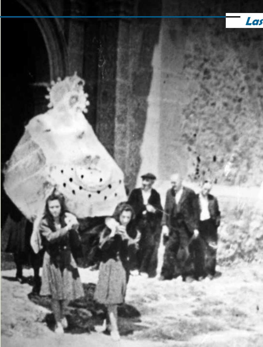
Procesión con la Virgen de la cama en las fiestas patronales. Años 50.