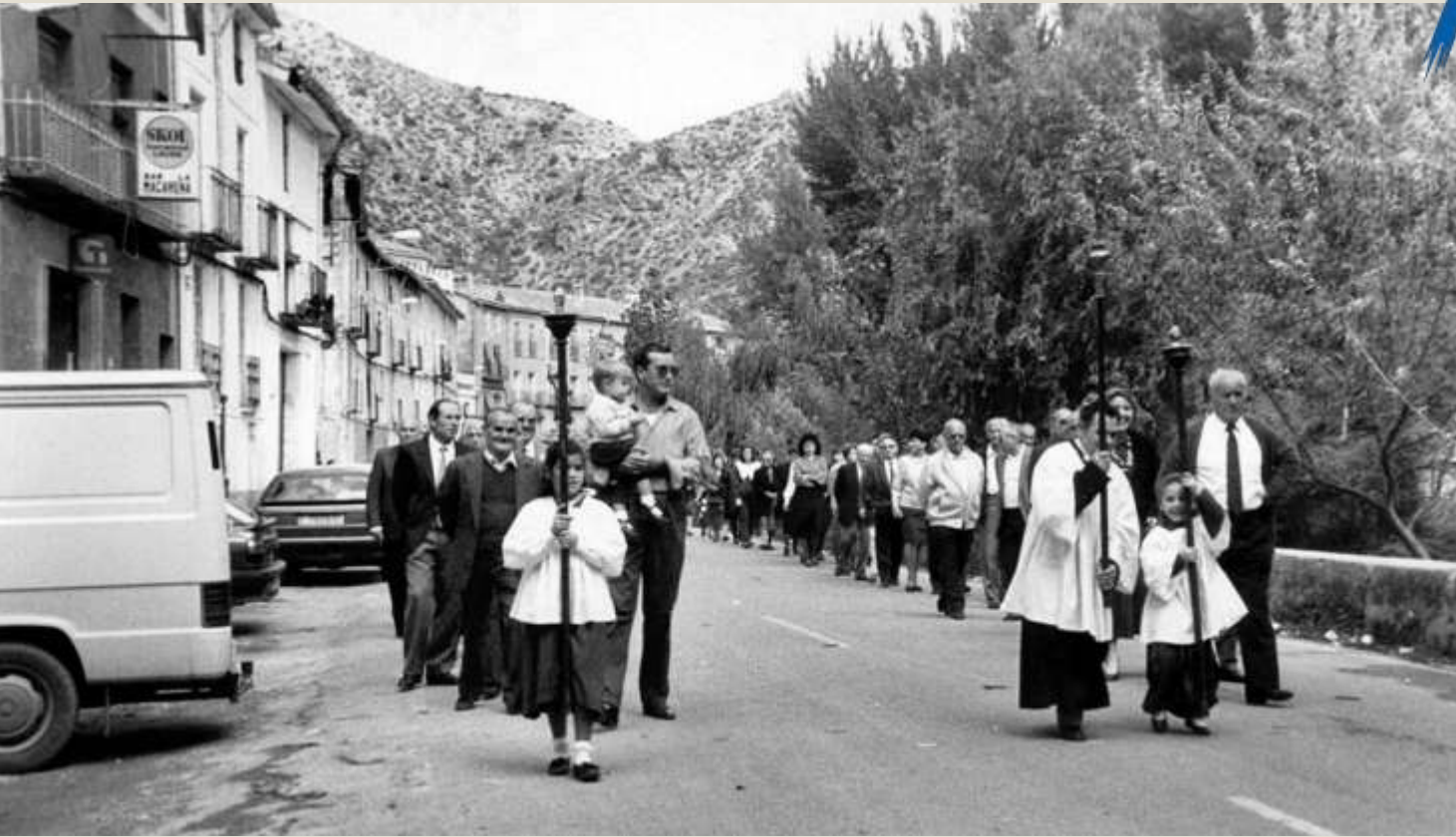
Procesión por la carretera. Años 80.