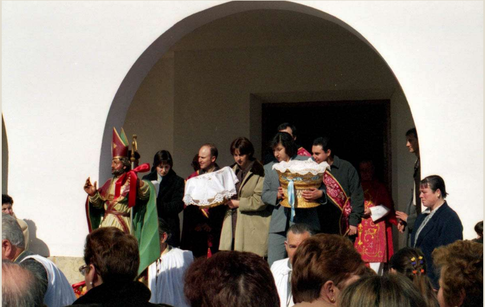
Fiesta de San Blas . Salida de la iglesia precedidos por la imagen del santo. Año 2000.