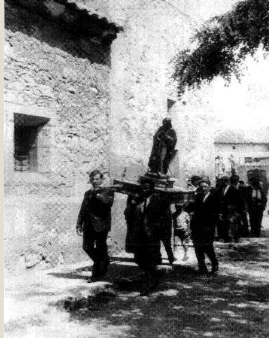
Jóvenes portando el anda de San Abdón . 1960. Fondo Asociación Cultural Fuentes Calientes.