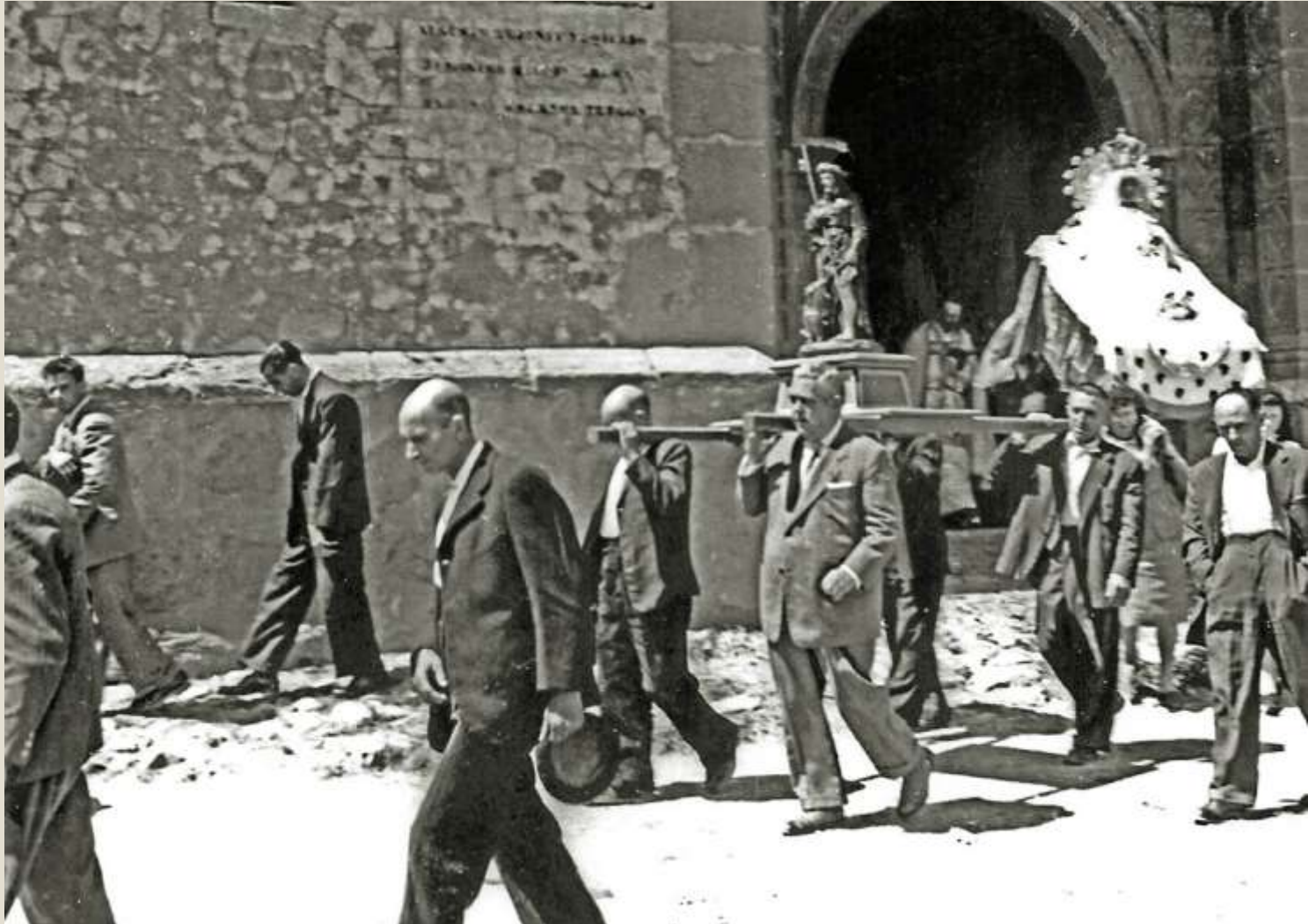
Procesión San Roque y la Asunción , Virgen de La Cama. Fiestas patronales de Galve. Años 60-70.