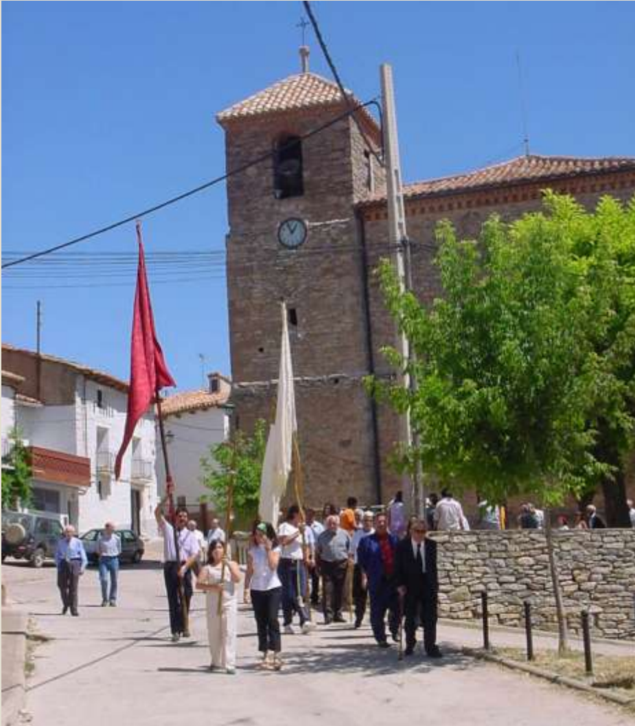
Procesión en la fiestas de agosto, 2008.