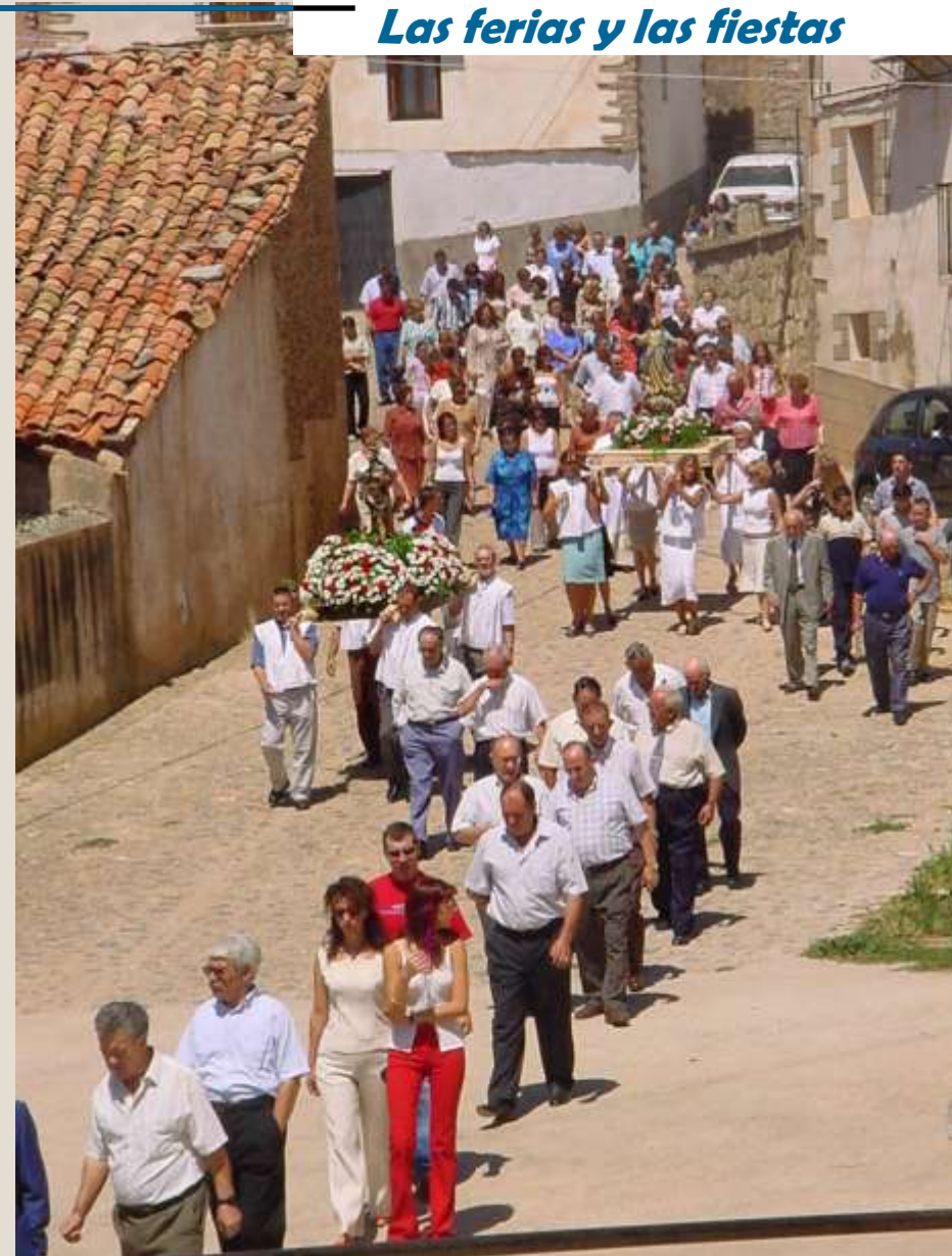
Procesión en las fiestas de agosto, 2008.