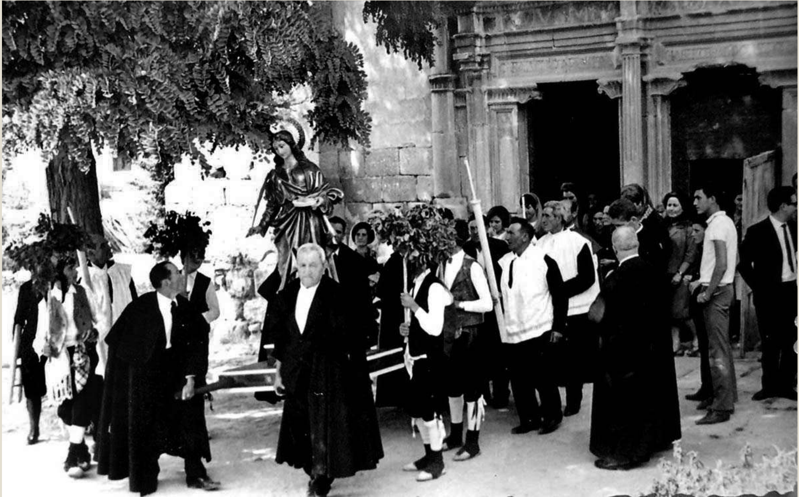
Procesión saliendo de la iglesia. Años 70-80.