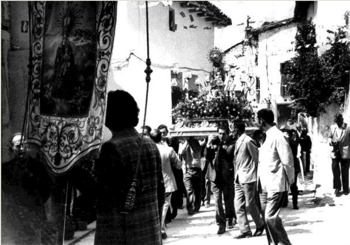
Procesión de la Virgen del Loreto con andas y estandarte. Años 80-90.