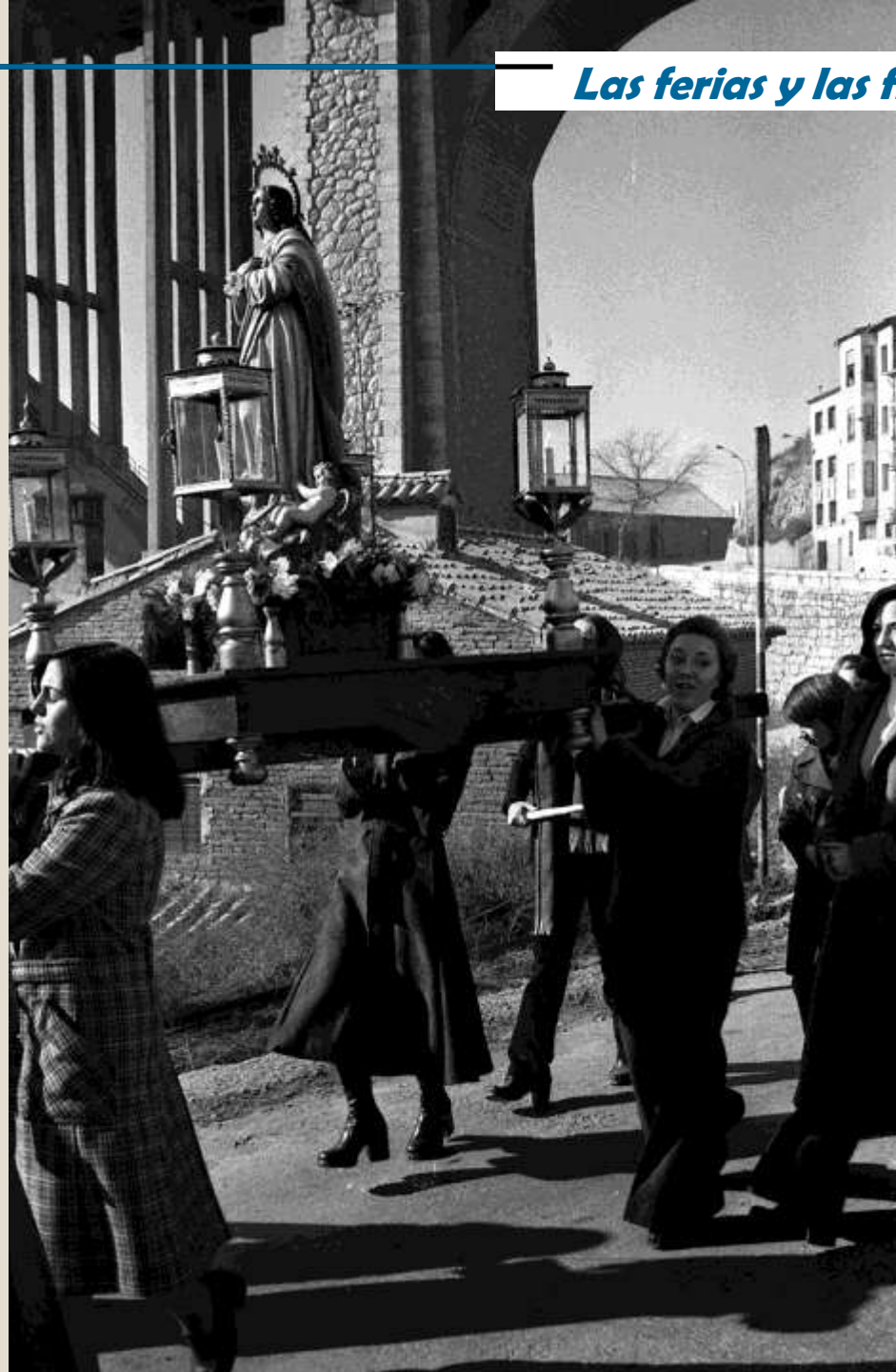
Procesión de San Antonio en la carretera de San Julián en 1976.