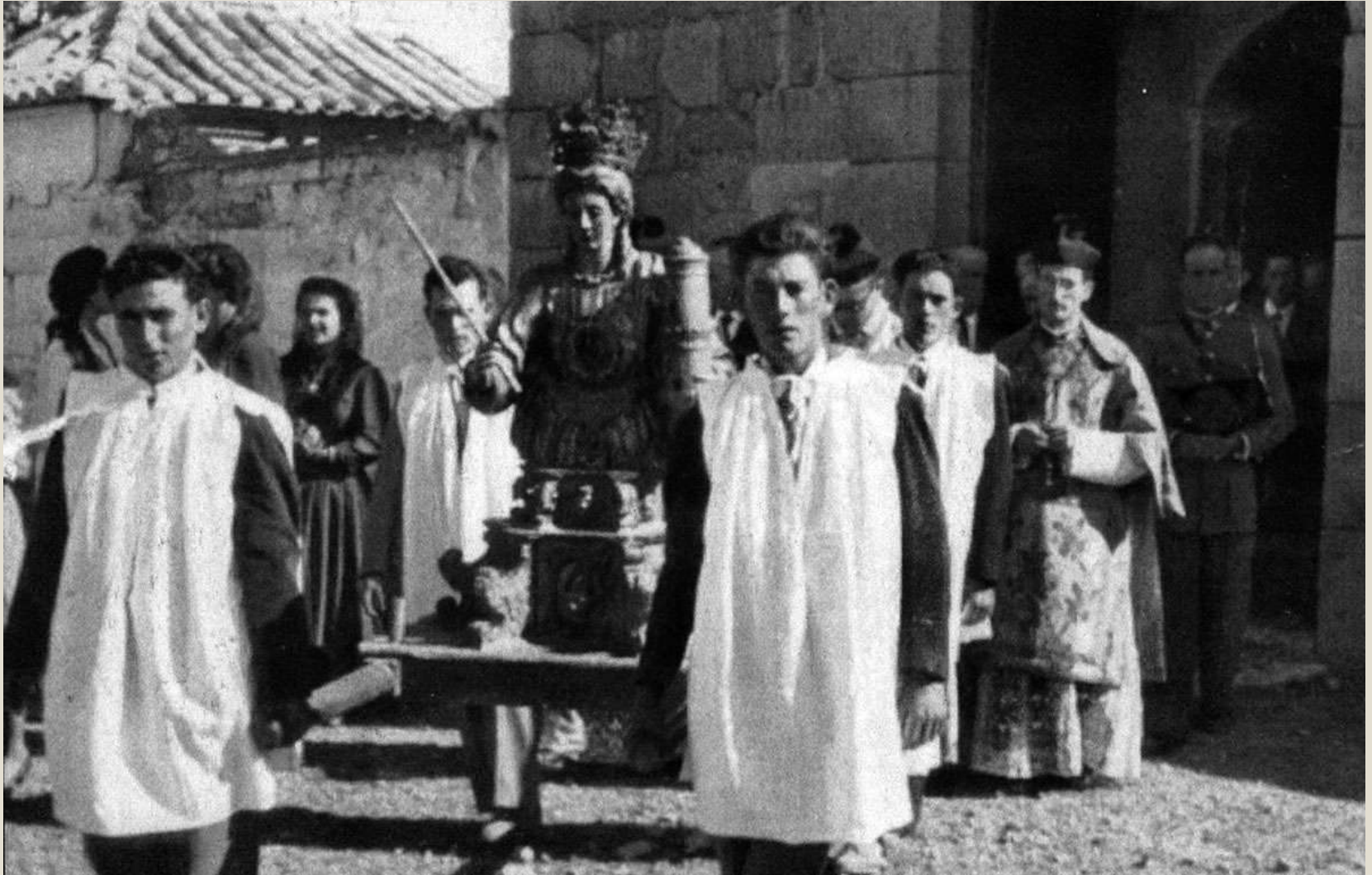
Procesión de Santa Bárbara