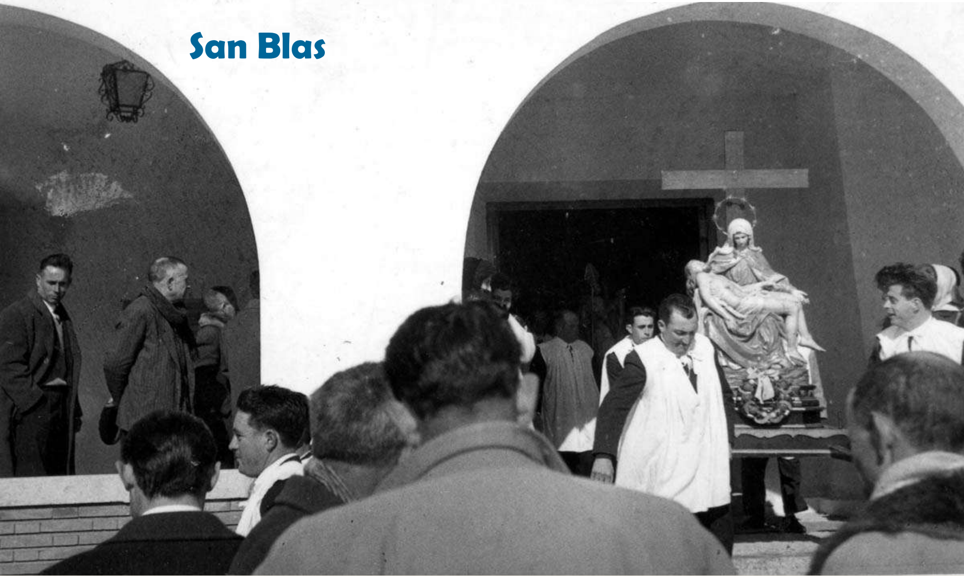
Fiesta de San Blas , sacando la Piedad. Años 60.