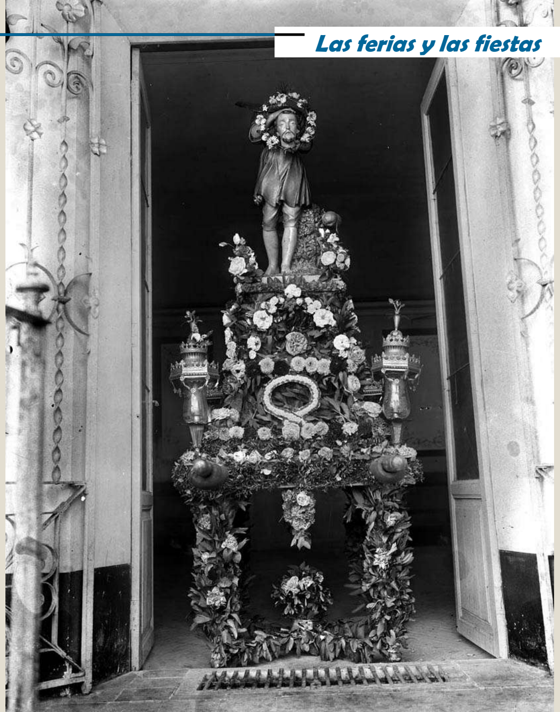
Imagen de San Lamberto , santo aragonés y patrón de los regantes de Teruel, adornada para la procesión. 19 de Junio. Alrededor de 1900.