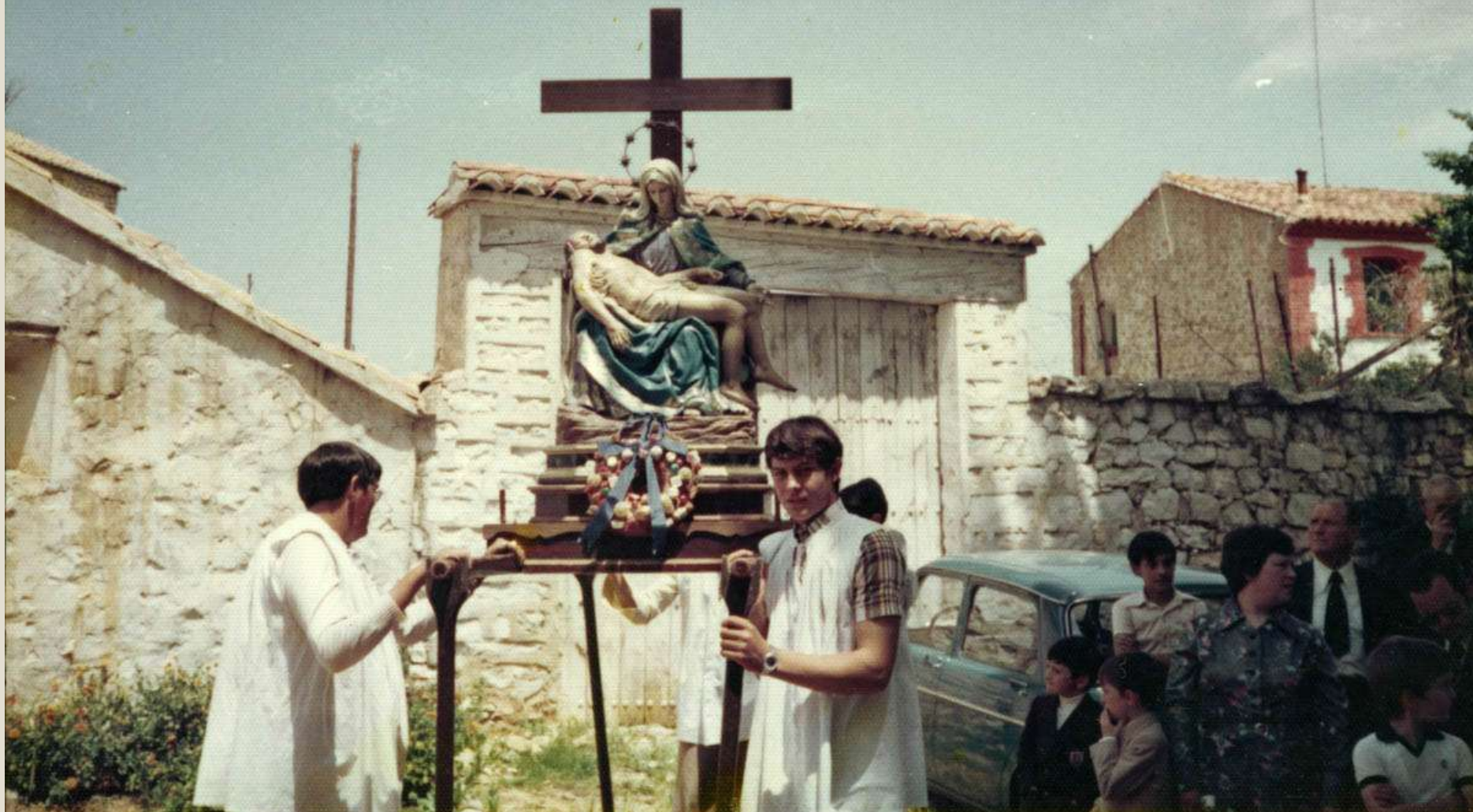
Descanso de la imagen de La Piedad con sus portadores. 1990. Vemos el roscón adornado.