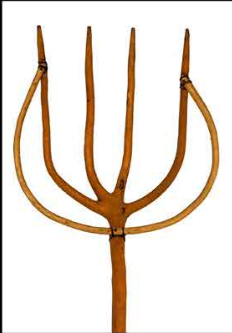
Horca para aventar la mies. Teruel.