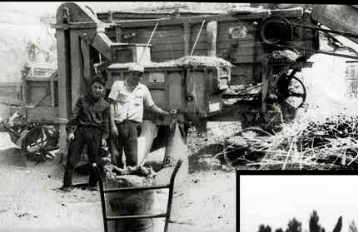
Trilladora mecánica en VILLARQUEMADO. Entre 1958 y 1959.