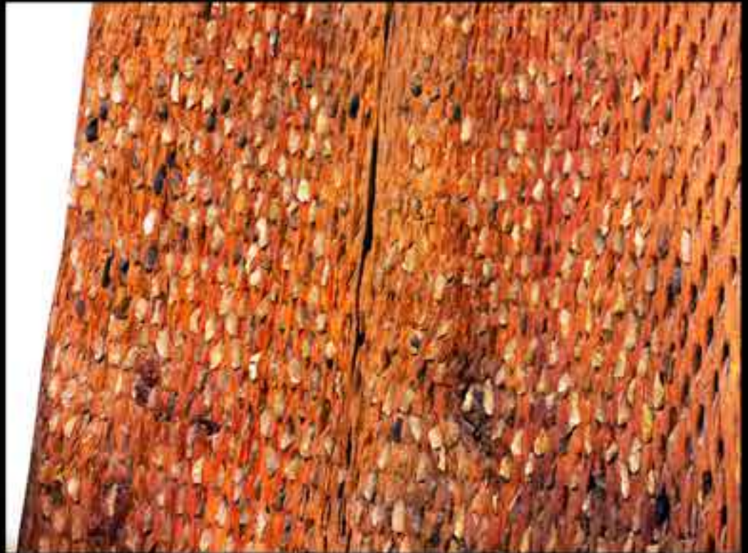
Trillo con piedras de sílex afiladas. Teruel.