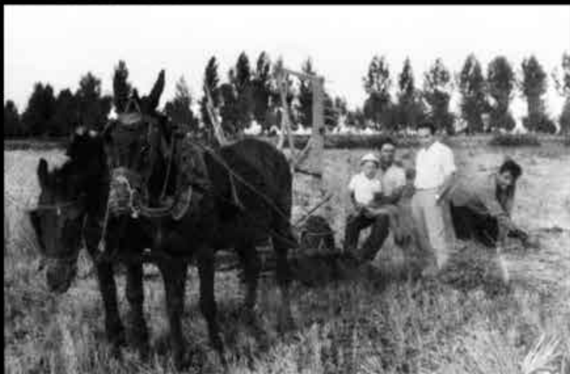
Segadora mecánica tirada por caballerías. Entre 1955 y 1957.