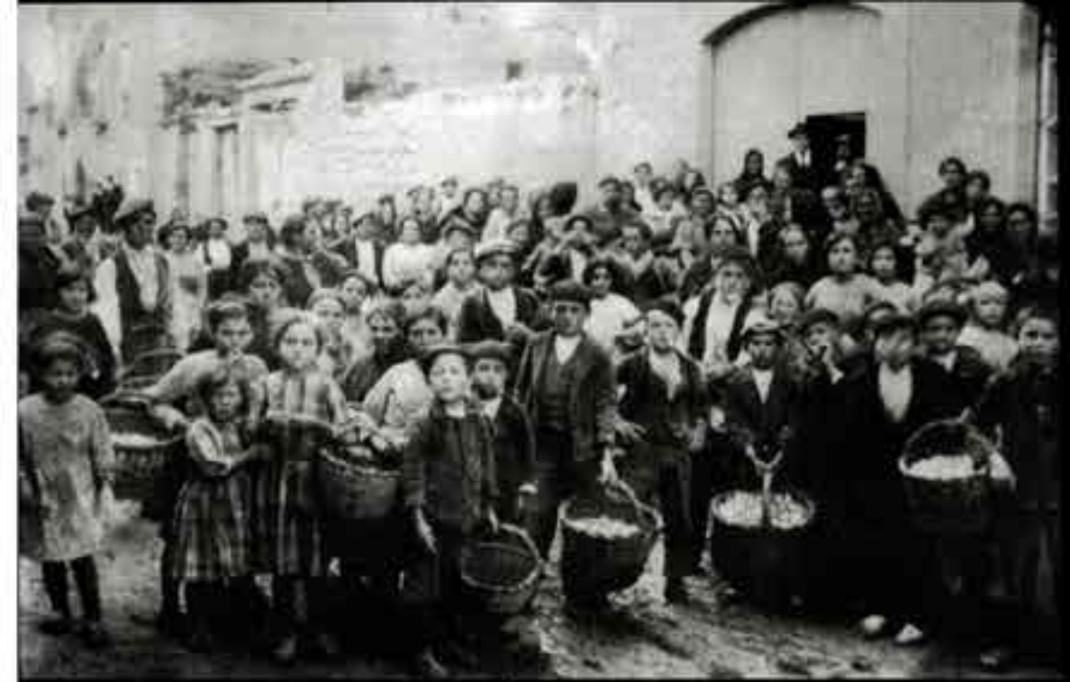
Recolectores del azafrán en VILLARQUEMADO , 1930 - 1935.